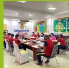
สรุปการเรียนรู