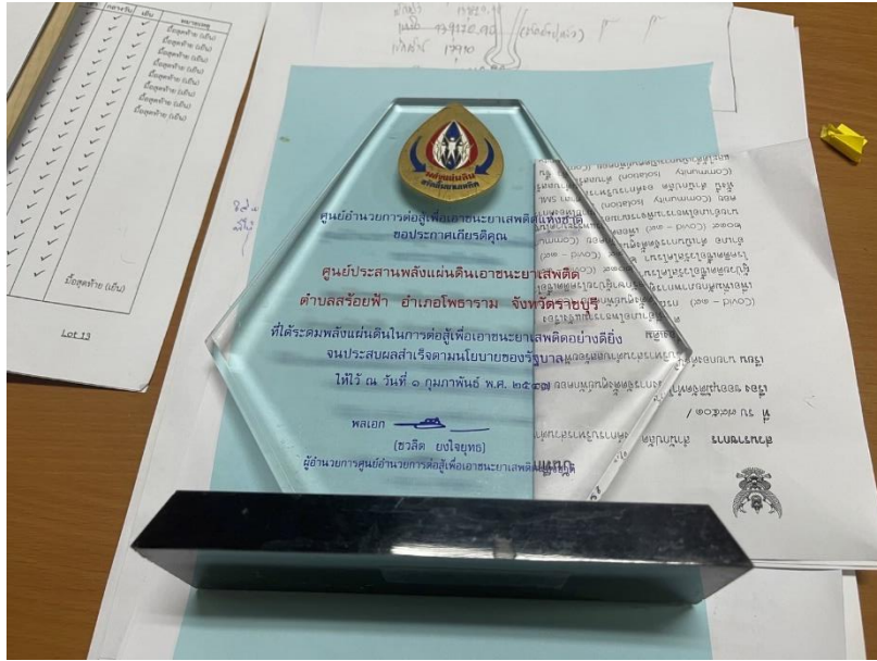
ภาพที่ 4 ศูนย์ประสานพลังงานแผ่นดิน ต้านยาเสพติด