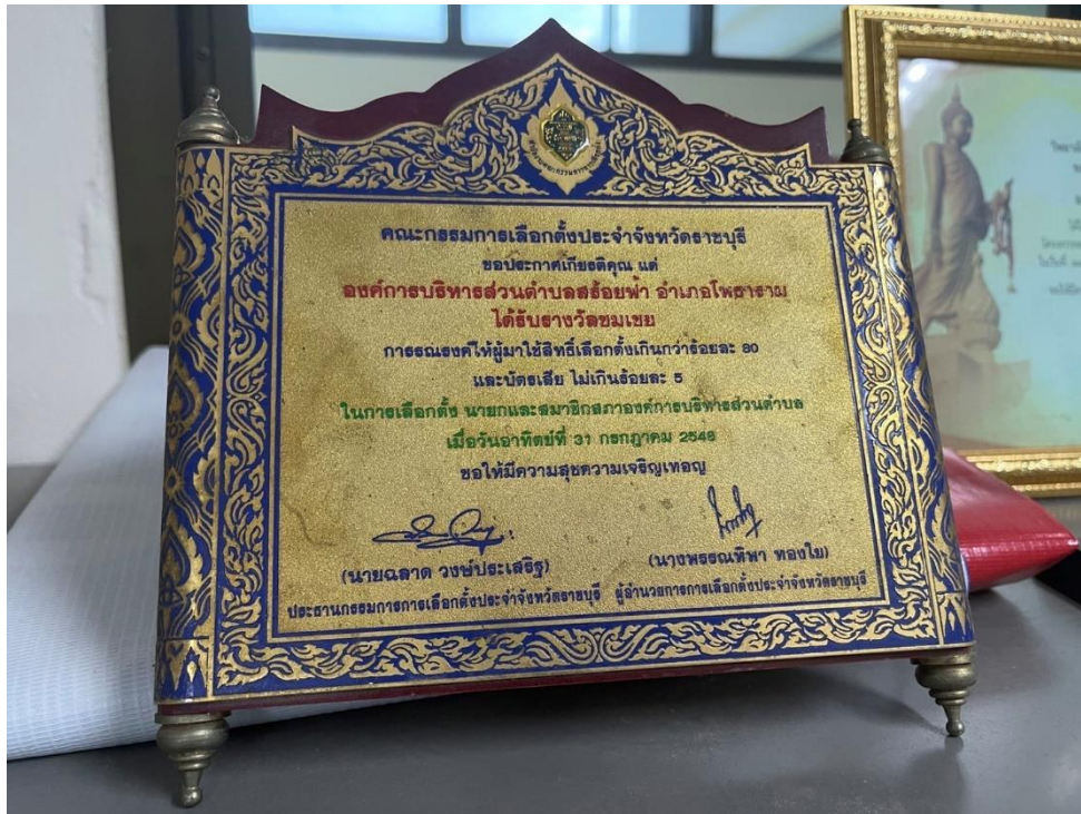
ภาพที่ 5 องค์การบริหารส่วนตำบลสร้อยฟ้า อำเภอโพธาราม ได้รับรางวัลชมเชยการรณรงค์ให้มาใช้สิทธิเลือกตั้ง