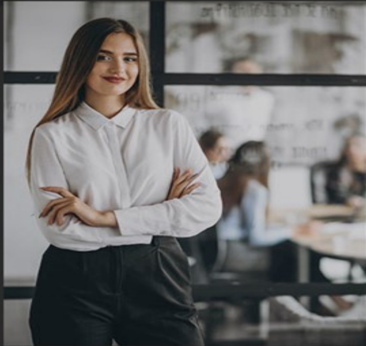
ทีมปรึกษามืออาชีพ

เรามีประสบการณ์การออกแบบกระบวนการเรียนรู้ให้สอดคล้องกับ Core Values, Core Competency และความต้องการขององค์กร มีผลงานให้กับองค์กรชั้นนำมากมาย