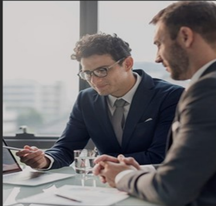
จัดการอย่างมีประสิทธิภาพ