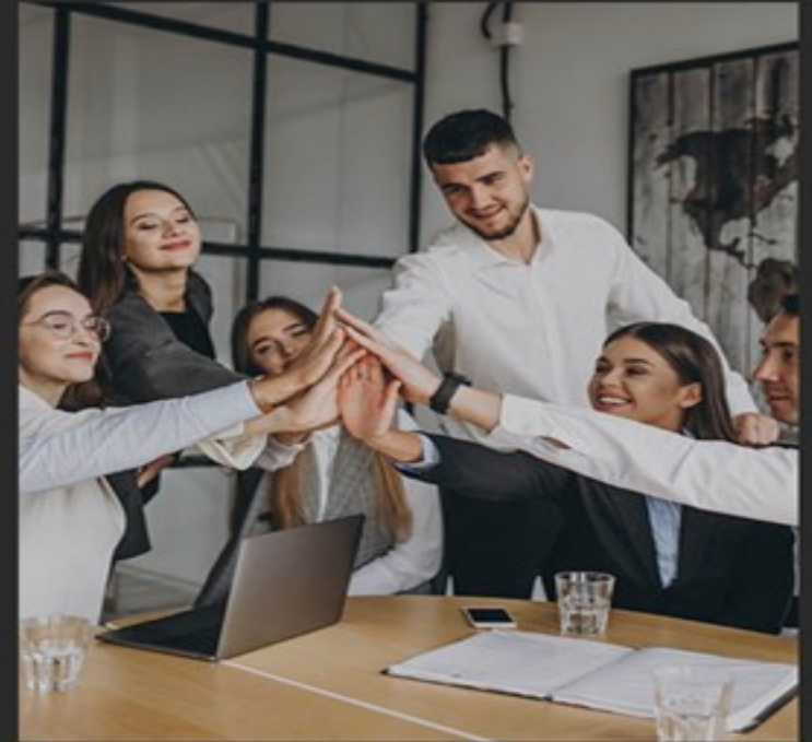
ผลลัพธ์ตามต้องการ

Training organize ที่ตอบสนองความต้องการของลูกค้าอย่างครบถ้วน