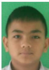
เด็กชายทรงยศ ณ.พัทลุง รองประธานสถานักเรียน