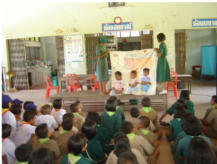
ละครผ้าเจาะหน้า เรื่อง เศรษฐกิจพอเพียง สิ่งแวดล้อม ปัญหาวัยรุ่น สุขภาพ