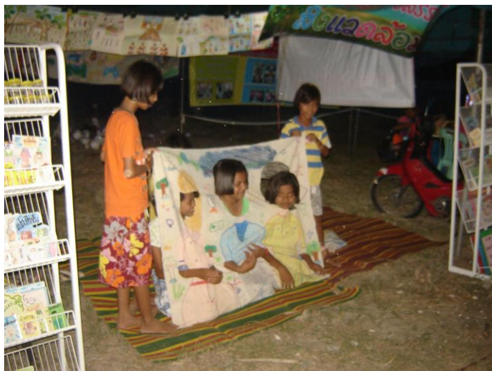
แสดงละครผ้าเจาะหน้าที่งานเปิดโลกทะเล่อ่าวไทย