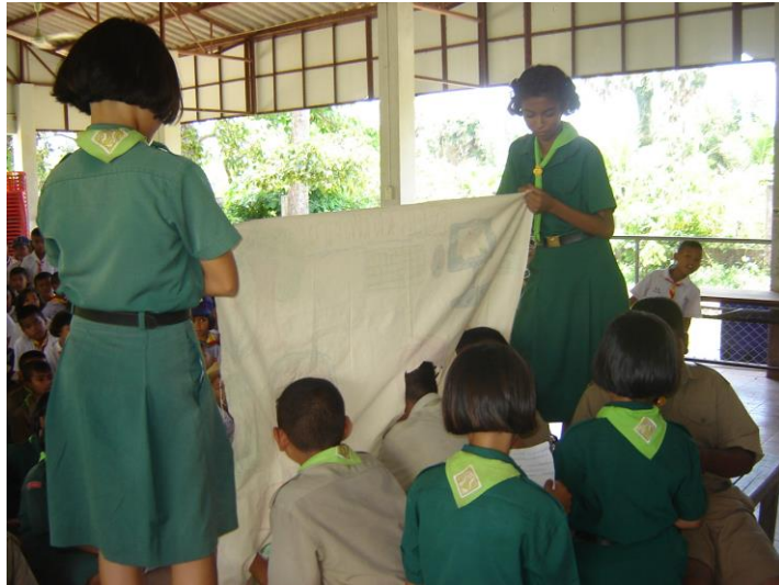
เบื้องหลังละครผ้าเจาะหน้า