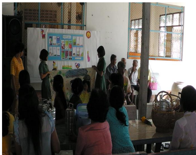
แสดงละครฟ้าเจาะหน้าที่วัดวันสารทเดือนสิบ