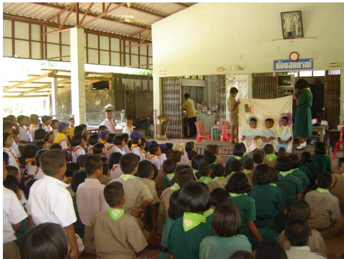
แสดงละครผ้าเจาะหน้าให้น้องดู