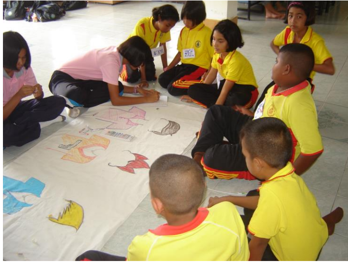
พี่ๆวิทยากรจากอบต.กระดังงาสอนทำละครผ้าเจาะหน้า