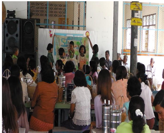
แสดงละครฟ้าเจาะหน้าที่วัดวันสารทเดือนสิบ