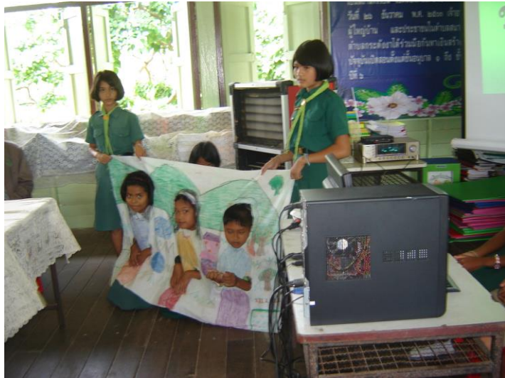
แสดงละครผ้าเจาะหน้าให้ผู้มาดูงานชม