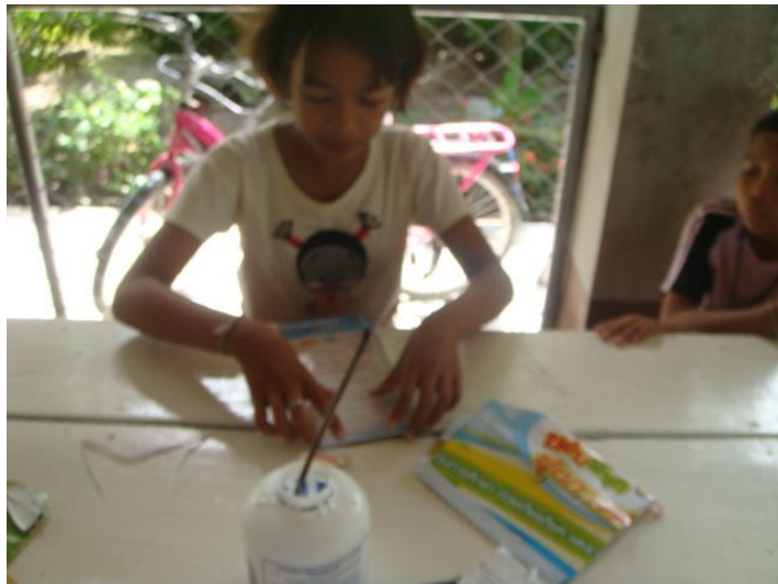
ทำละครหุ่นมือ