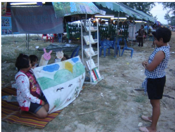
แสดงละครหุ่นมือในงานเปิดโลกทะเลอ่าวไทยของอบต.กระดังงา