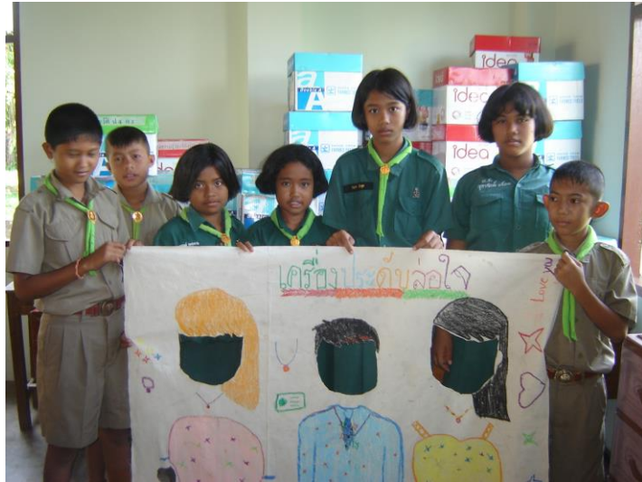
ผ้าเจาะหน้า