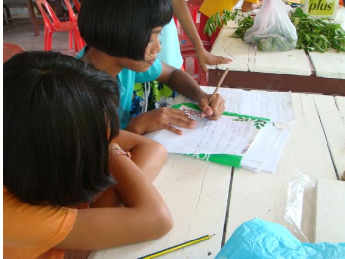
เขียนบทละคร