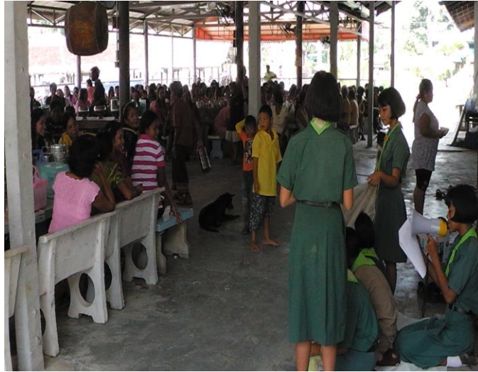
แสดงละครฟ้าจะหน้าที่วัดวันสารทเดือนสิบ