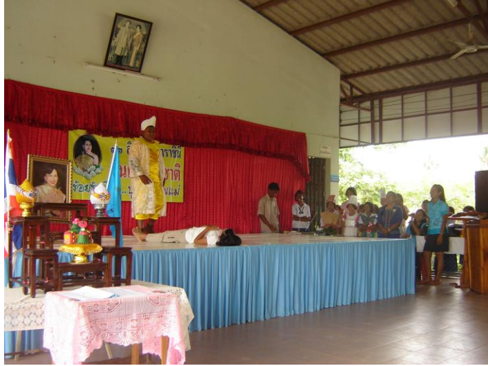
แสดงละครเวทีในวันแม่