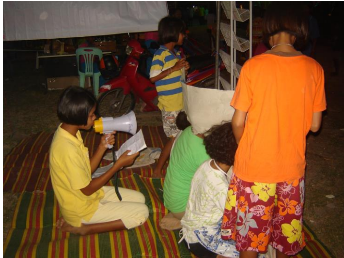
แสดงละครฟ้าเจาะหน้า จัดโดยอบต.กระดิงา