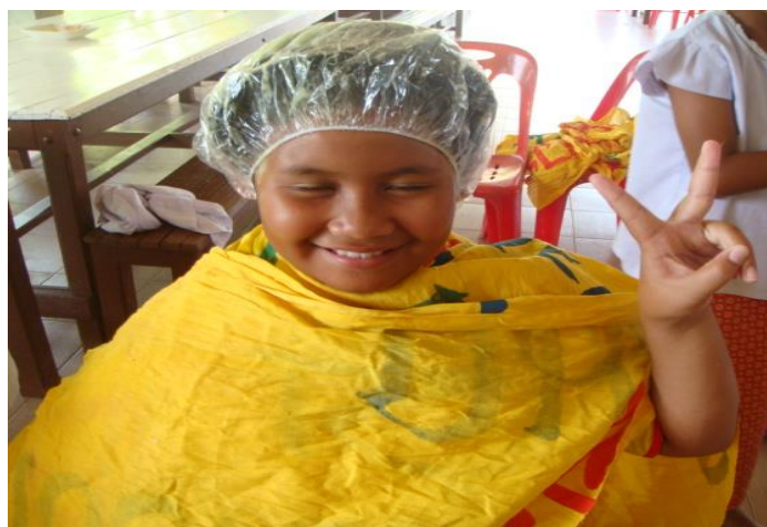
หมักทิ้งไว้ ๒ ชั่วโมง