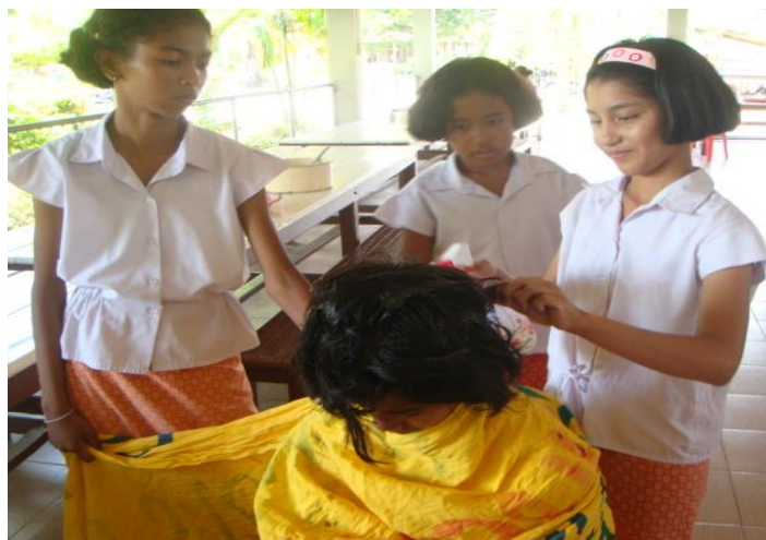
ติดบนศีรษะนักเรียนที่เป็นเหา