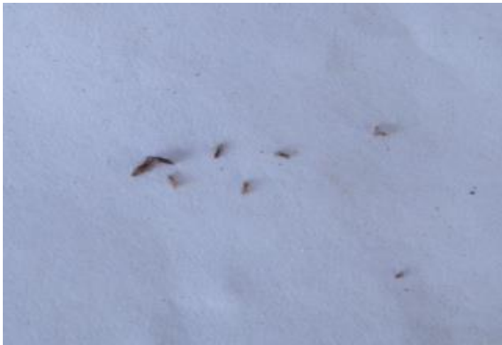
เหตายนิต