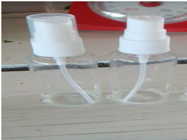
บรรจุสเปรย์กำจัดเหา