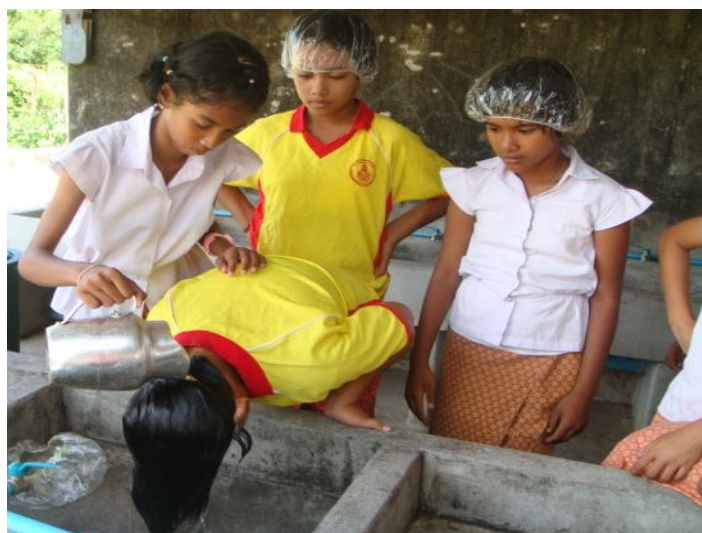
ล้างออกด้วยน้ำสะอาด