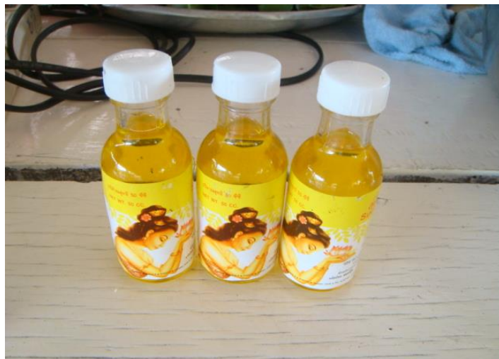
น้ำมันมะกอก