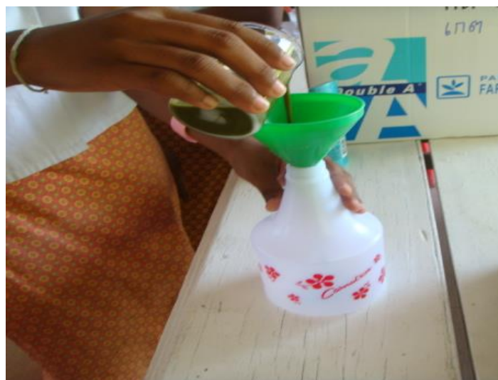
เทส่วนผสมในกระบอกฉีด