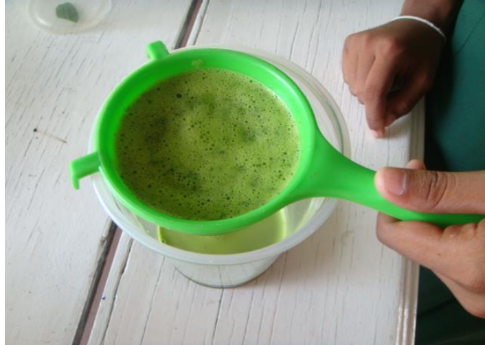
กรองเอาน้ำ