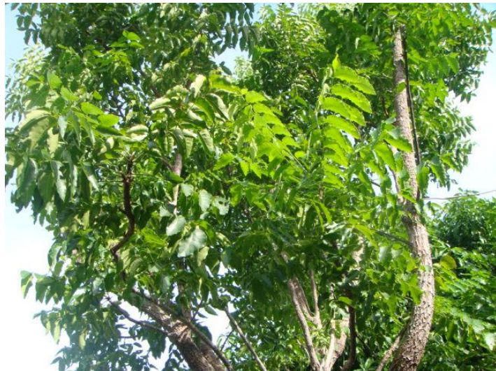
ต้นตะเคา