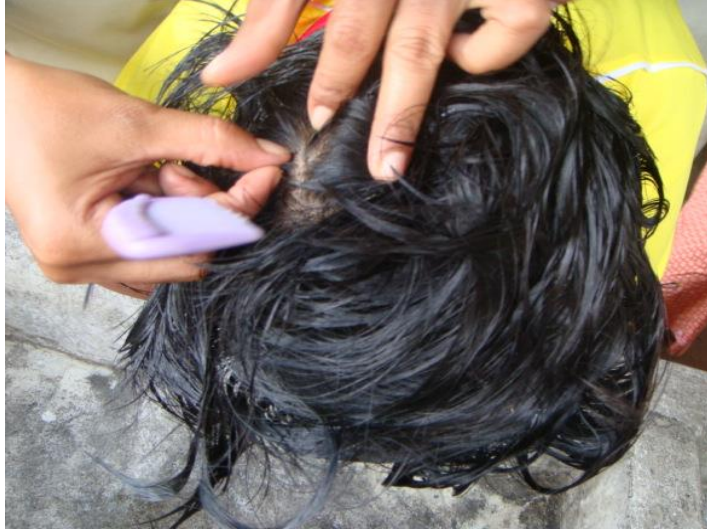
เหตายนิต