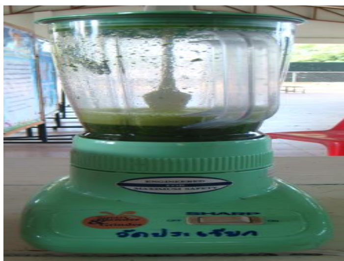
น้ำ ๔๐๐ มิลลิลิตร บดนาน ๑ นาที