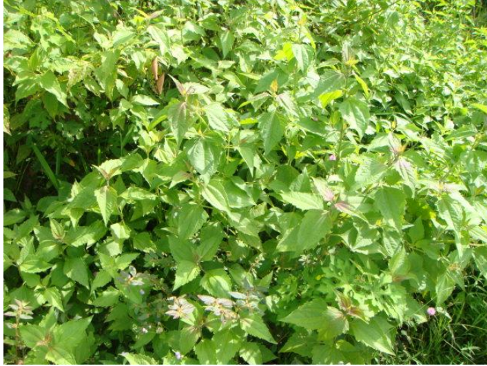
ต้นสาบเสือ