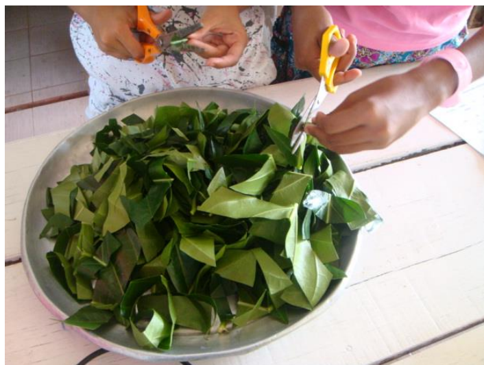
ตัดใบสมุนไพรมาน