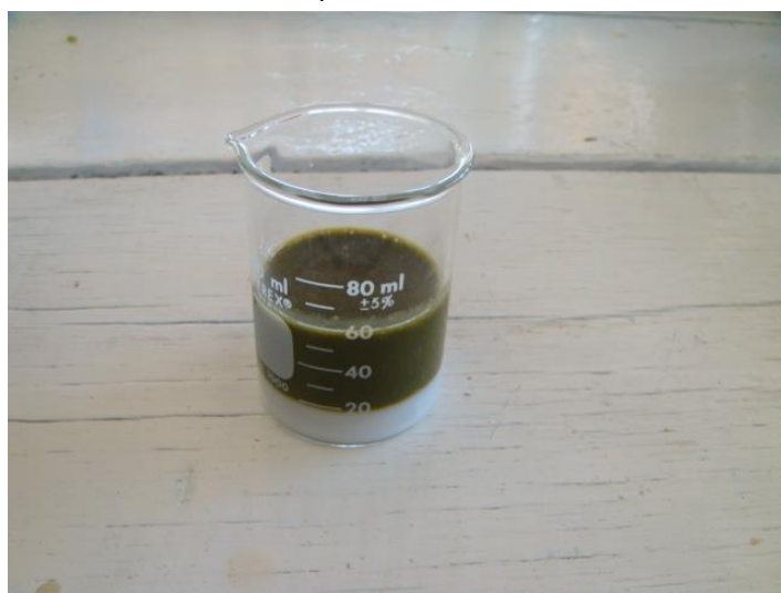
ผสมยาสะสม ๑๐ มิลลิลิตร น้ำสมุนไพร ๕๐ มิลลิลิตร