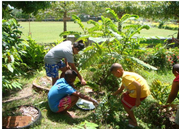
สมุนไพรของโรงเรียน