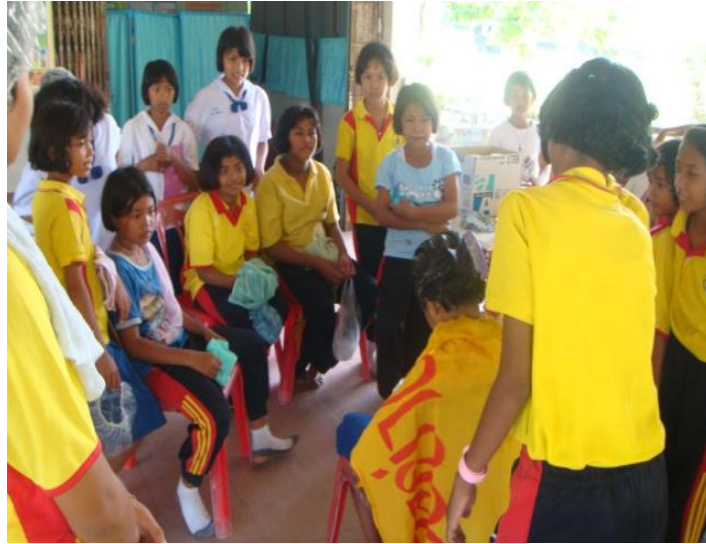
เข้าคิวทำจัดเหา

ส่วนผสมประกอบด้วย ยาสระผม ๑๐ มิลลิลิตร น้ำใบขี้ไก่ ๕๐ มิลลิลิตร น้ำมะกรูด ๒ ลูกบาศก์เซนติเมตร น้ำมันมะกอก ๒ ลูกบาศก์เซนติเมตร น้ำดอกอัญชัน ๒ ลูกบาศก์เซนติเมตร