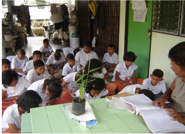
เรียนสมุนไพรที่บ้านยายเสม