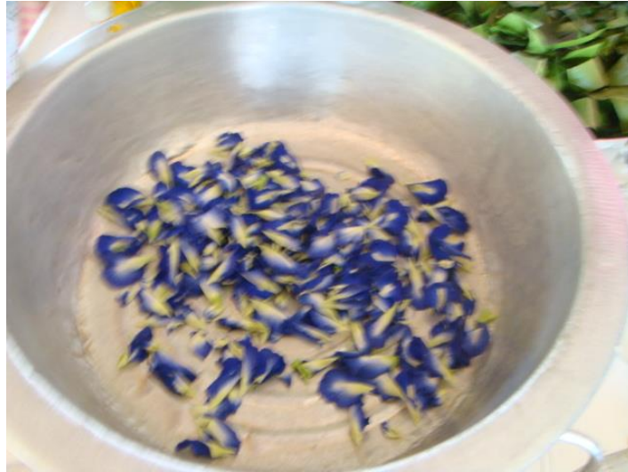
น้ำดอกอัญชัน