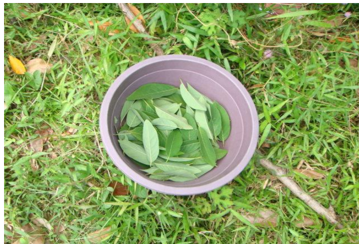
โบน้อยหน้า