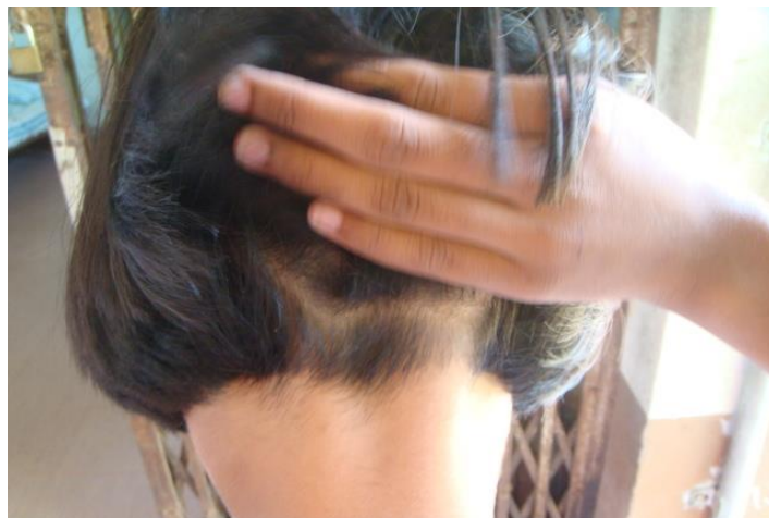
เลือกกลุ่มตัวอย่างมาทดลอง