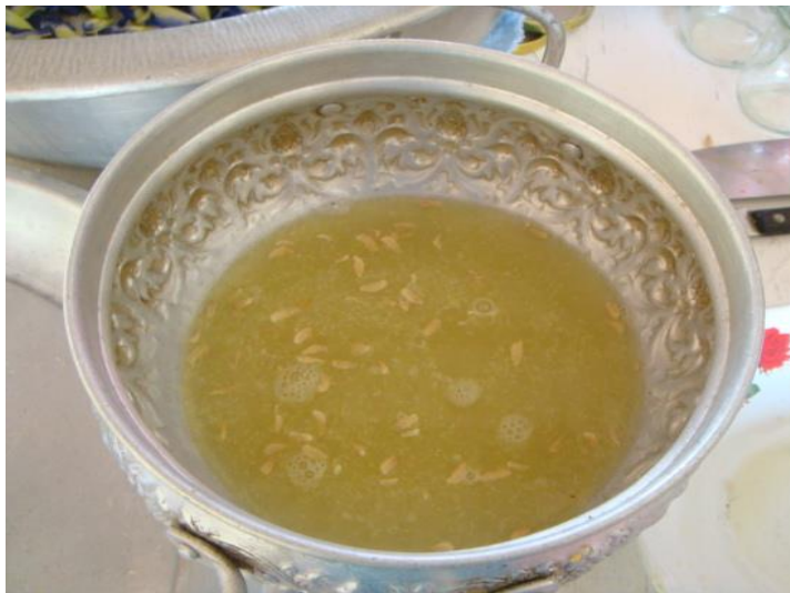
น้ำมะกรูด