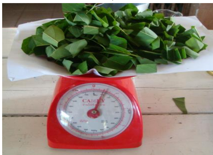
ชั่ง ๕๐ กรัม