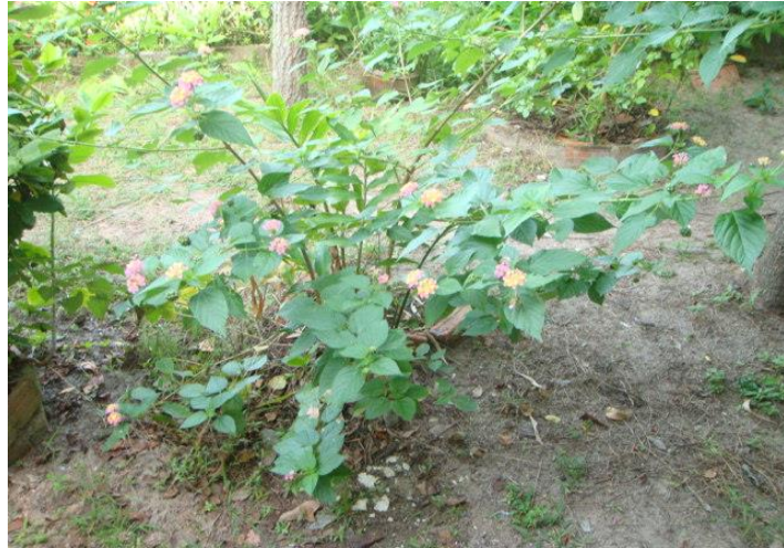
ต้นจีโก้