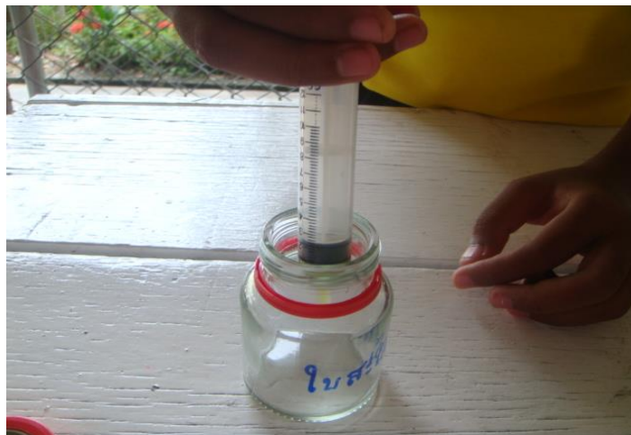
ทดลองหา ๕ ตัว น้ำสมุนไพร ๑ ลูกบาศก์เซนติเมตร น้ำใบขมิ้นใก่มาหาได้ดีที่สุด