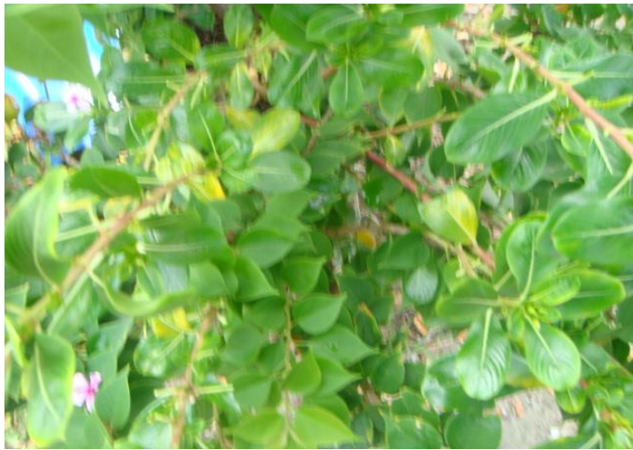
ต้นแพงพวย