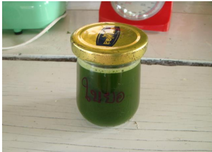
ใส่ขวดไว้ใช้