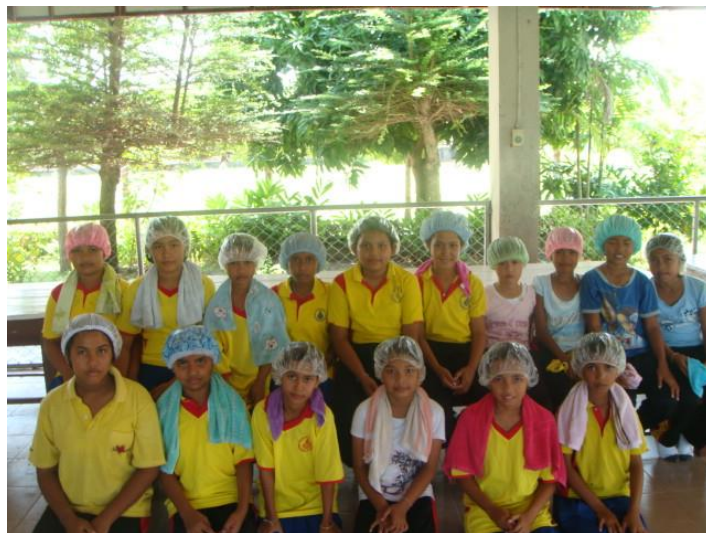
นำไปใช้กับนักเรียนหญิงที่เป็นเหาตั้งแต่ชั้นป.๓-ป.๖