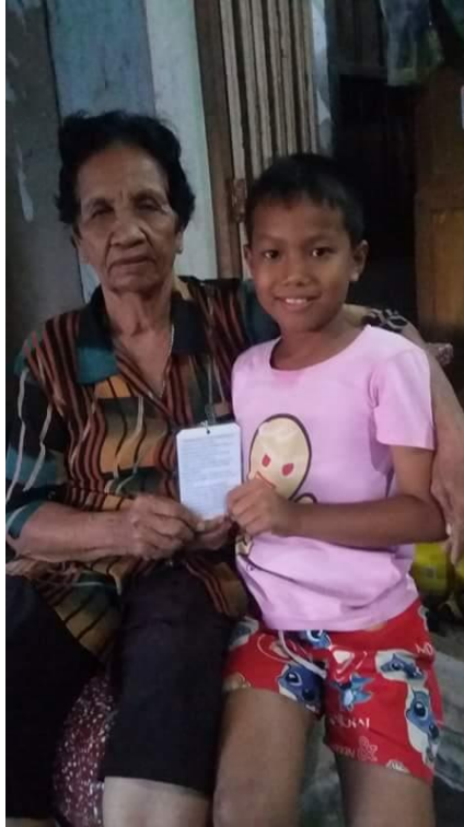
นำพวงกุญแจดอกไม้ไปไม้เท้าคนนิยม ๑๒ ประการ ไปแจกจ่ายผู้ปกครองเพื่อเผยแพร่คนนิยม ๑๒ ประการ