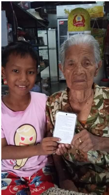
นำพวงกุญแจดอกไม้ไปไม้เท้าคนนิยม ๑๒ ประการ ไปแจกจ่ายผู้ปกครองเพื่อเผยแพร่คนนิยม ๑๒ ประการ