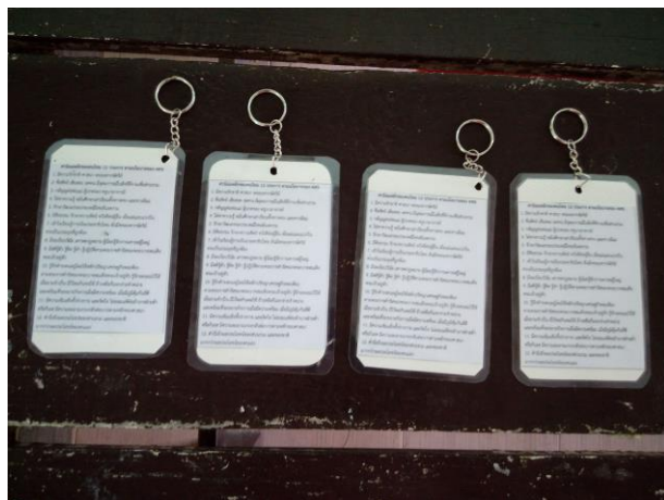
พวงกุญแจดอกไม้ใบไม้แห้งค่านิยม ๑๒ ประการ ด้านหลัง