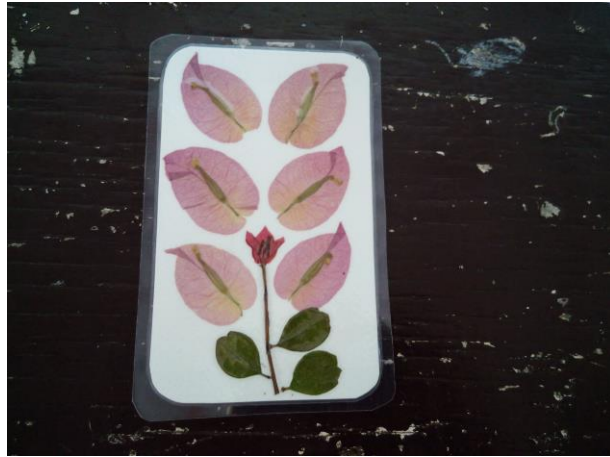
ด้านหน้าติดดอกไม้และใบไม้