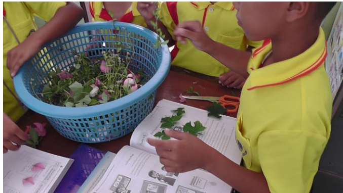
นำดอกไม้และใบไม้มาทับในหนังสือให้เรียบ