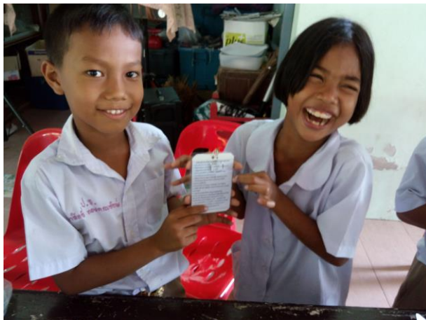
พวงกุญแจดอกไม้ไปไม้แห้งค่านิยม ๑๒ ประการ ด้านหลัง