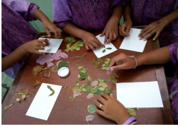
นำดอกไม้และใบไม้ที่เรียบและแห้งแล้ว มาทากาวติดบนกระดาษ