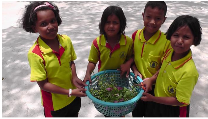
ดอกไม้และใบไม้