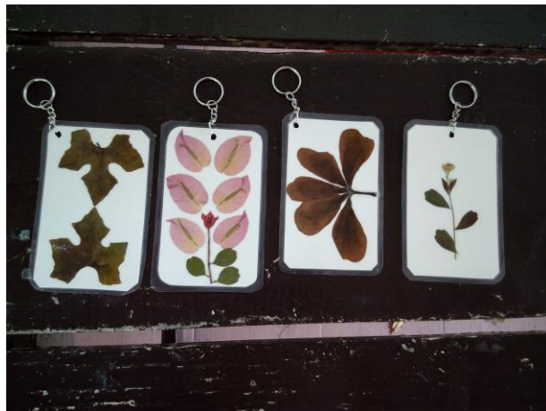
พวงกุญแจดอกไม้ใบไม้แห้งค่านิยม ๑๒ ประการ ด้านหน้า