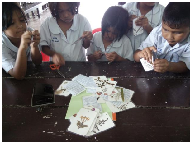
นำไปเคลือบและเจาะรูเพื่อใส่พวงกุญแจ