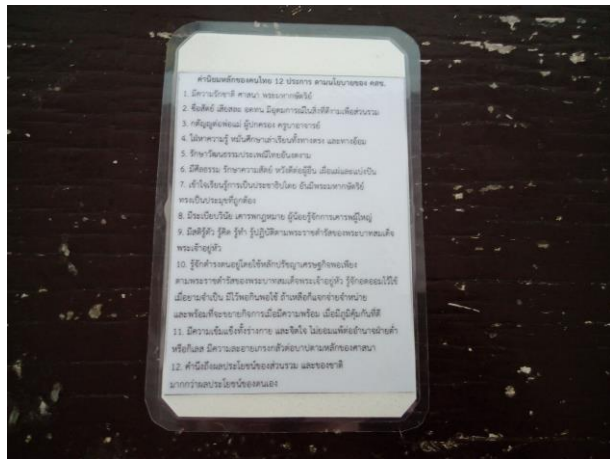
ด้านหลังติดค่านิยม ๑๒ ประการ