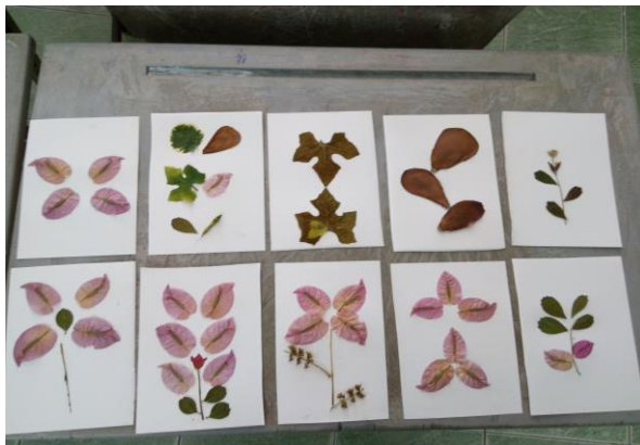
นำดอกไม้และใบไม้ที่เรียบและแห้งแล้ว มาทากาวติดบนกระดาษ