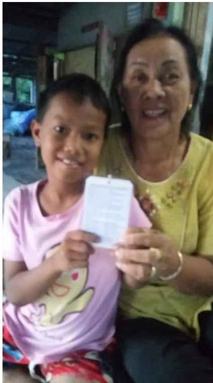
นำพวงกุญแจดอกไม้ไปไม้แห้งค่านิยม ๑๒ ประการ ไปแจกจ่ายผู้ปกครองเพื่อเผยแพร่ค่านิยม ๑๒ ประการ