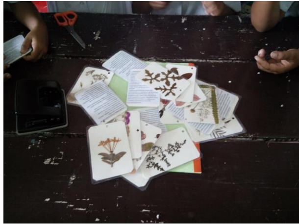
นำไปเคลือบและเจาะรูเพื่อใส่พวงกุญแจ