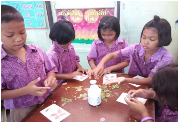
นำดอกไม้และใบไม้ที่เรียบและแห้งแล้ว มาทากาวติดบนกระดาษ