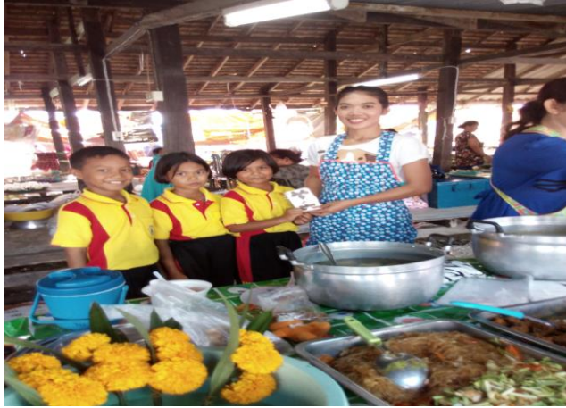
นำพวงกุญแจดอกไม้ไปไม้แห้งค่านิยม ๑๒ ประการ ไปแจกจ่ายที่ตลาดเพื่อเผยแพร่ค่านิยม ๑๒ ประการ