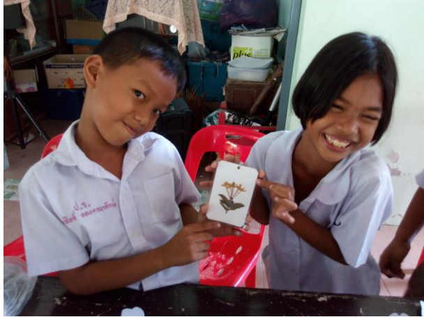
พวงกุญแจดอกไม้ไปไม้แห้งค่านิยม ๑๒ ประการ ด้านหน้า