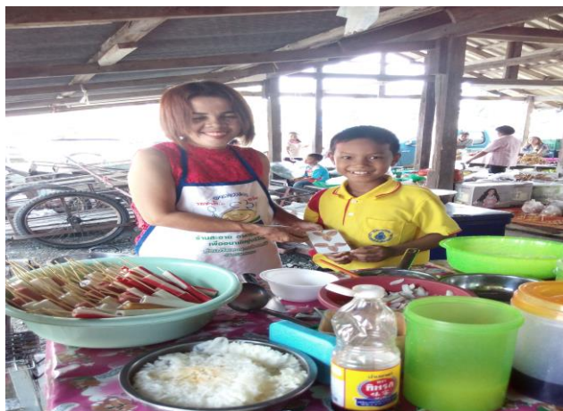
นำพวงกุญแจดอกไม้ไปไม้แห้งค่านิยม ๑๒ ประการ ไปแจกจ่ายที่ตลาดเพื่อเผยแพร่ค่านิยม ๑๒ ประการ