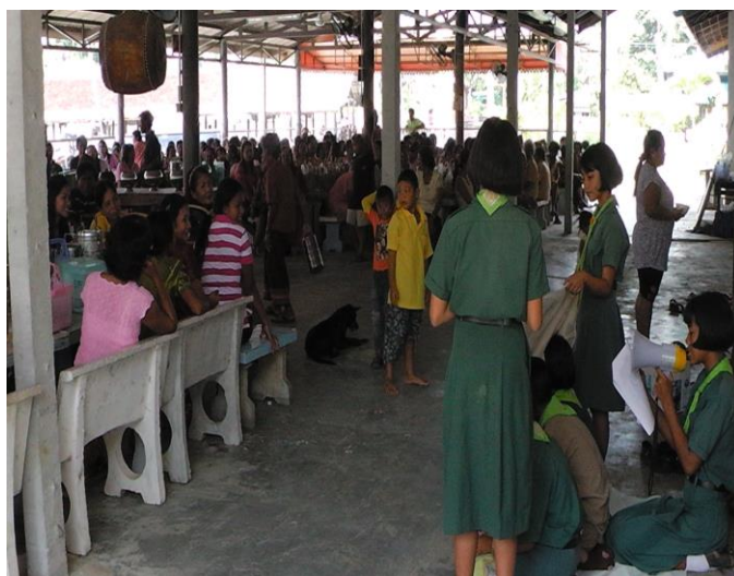
แสดงละครผ้าเงาะหน้าที่วัดวันสารทเดือนสิบ