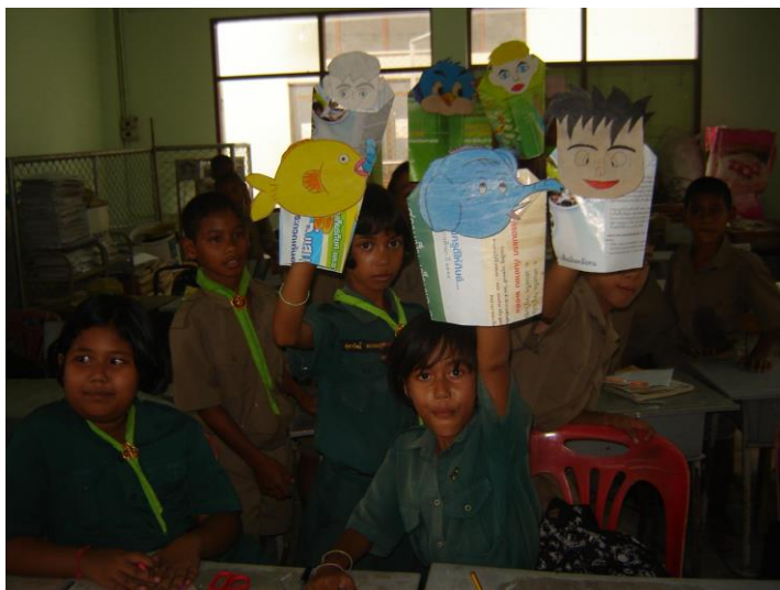
ละครหุ่นมือ