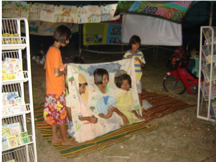
แสดงละครผ้าเจาะหน้าที่งานเปิดโลกทะเล่อ่าวไทย