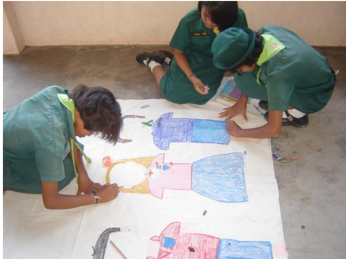
ทำละครผ้าเจาะหน้า