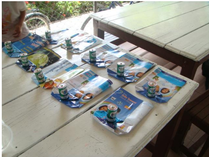
ตัวละครหุ่นมือ