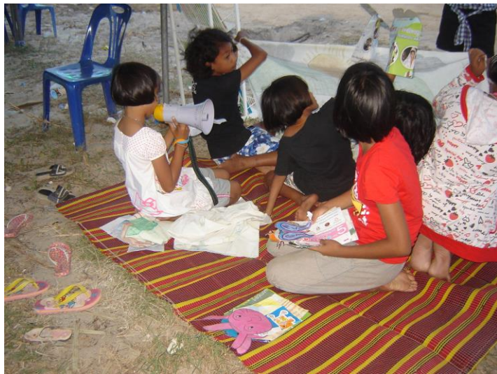
แสดงละครหุ่นมือ ละครผ้าเงาะหน้า