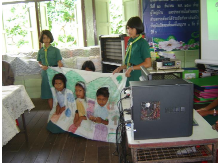
แสดงละครผ้าเจาะหน้าให้ผู้มาดูงานชม