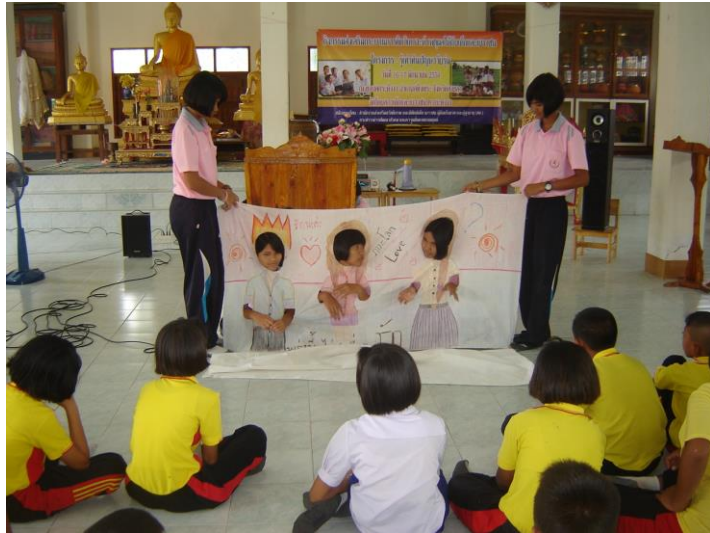
พี่ๆวิทยากรจากอบต.กระดังงาแสดงละครผ้าเจาะหน้าให้ดู