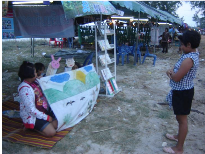
แสดงละครหุ่นมือที่งานเปิดโลกทะเลอ่าวไทยของอบต.กระดังงา