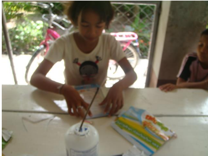
ทำละครหุ่นมือ