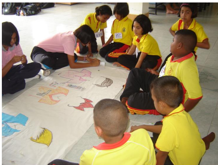
พี่ๆวิทยากรจากอบต.กระดังงาสอนทำละครผ้าเงาะหน้า