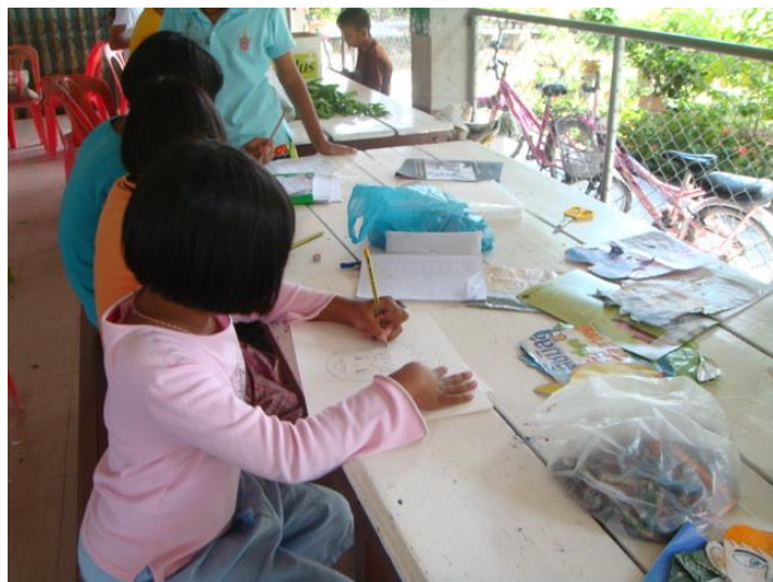
วาดภาพละครหุ่นมือ