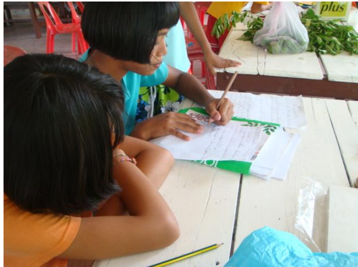
เขียนบทละคร