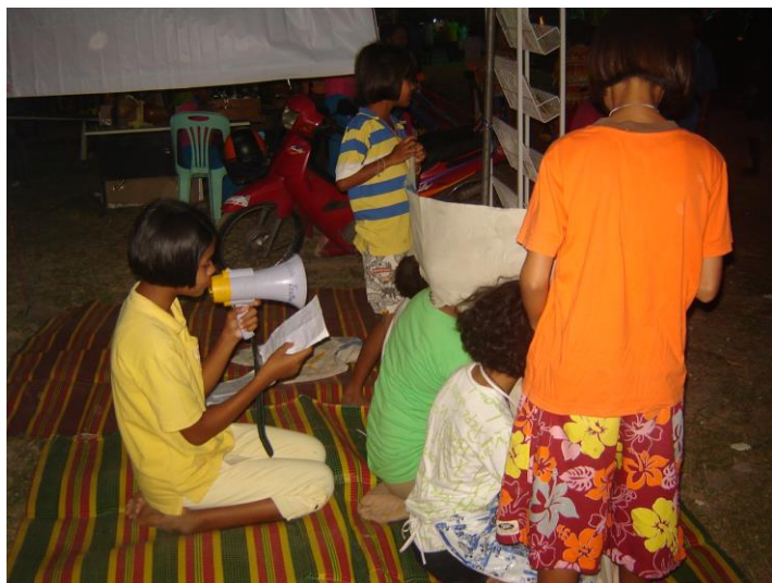
แสดงละครผ้าเจาะหน้า จัดโดยอบต.กระดังงา