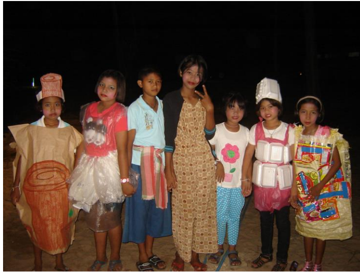
แสดงที่งานเปิดโลกทะเลอ่าวไทยจัดโดยอบต.กระดิ่งงา