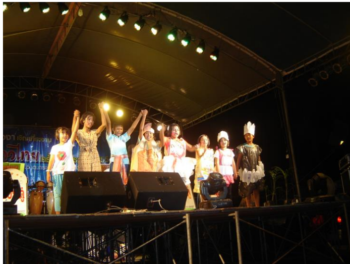
ละครเวทีเรื่องรวมพลังลดโลกร้อน มีผู้ชมประมาณ ๕๐๐ คน