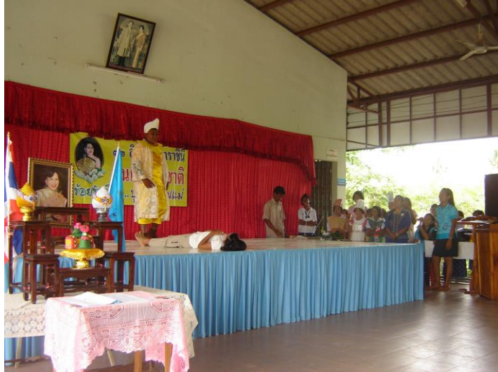
แสดงละครเวทีในวันแม่ ละครหุ่นมือ