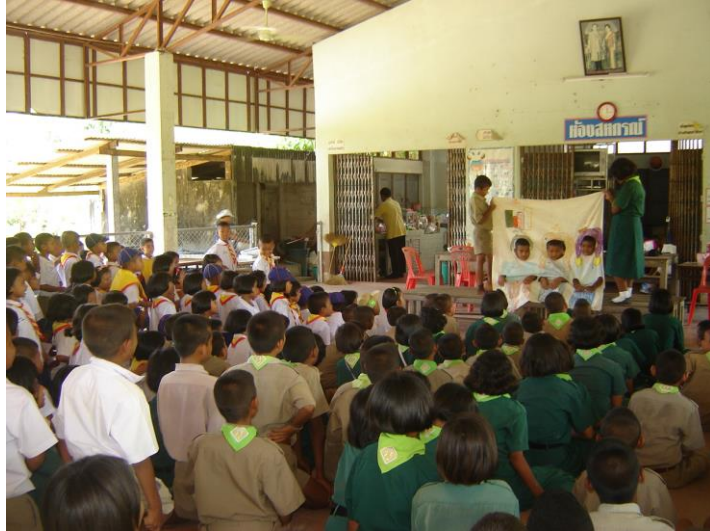
แสดงละครผ้าเจาะหน้าให้น้องดู