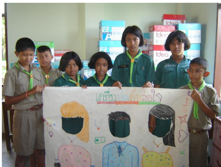
ผ้าเจาะหน้า