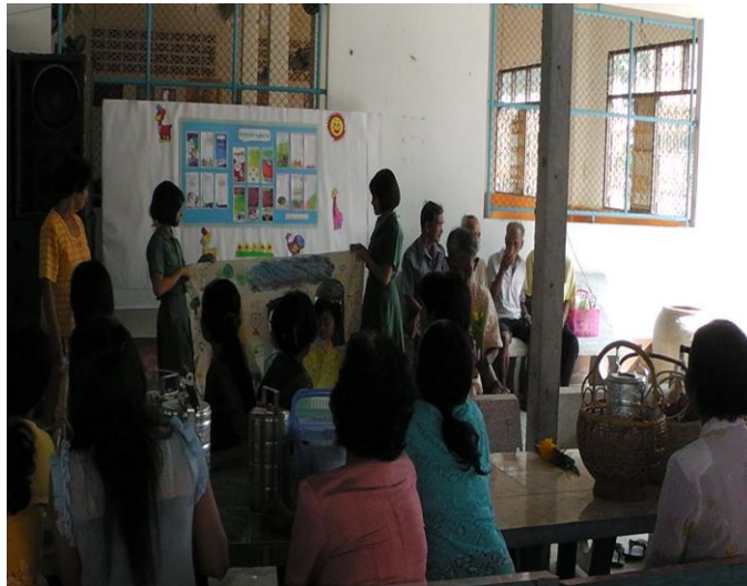
แสดงละครผ้าเงาะหน้าที่วัดวันสารทเดือนสิบ