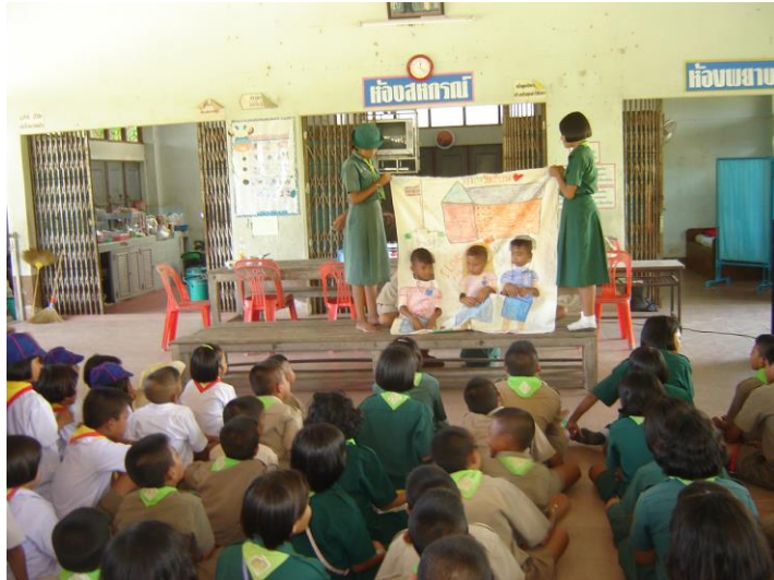
ละครผ้าเจาะหน้า เรื่อง

เศรษฐกิจพอเพียง ถึงแควดล้อม ปัญหาวัยรุ่น สุขภาพ