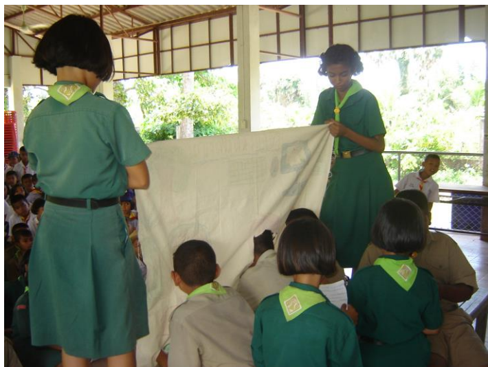
เบื้องหลังละครผ้าเจาะหน้า

เศรษฐกิจพอเพียง ถึงแควดล้อม ปัญหาวัยรุ่น สุขภาพ