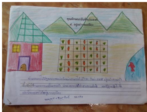
เขียนเค้าโครงเรื่องเพื่อทำนิทาน