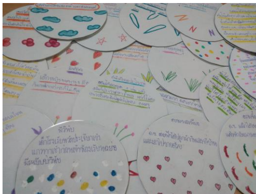
นิทานจากแผ่นซีดี