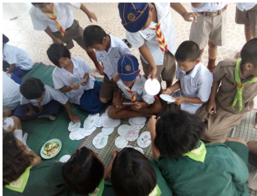
นักเรียนนำนิทานจากแผ่นซีดี ไปให้น้อง ๆ อ่าน