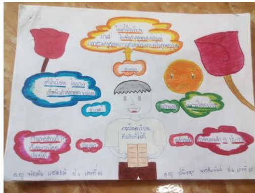
เขียน mind map เพื่อทำนิทาน