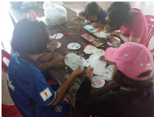
นักเรียนทำนิทานจากแผ่นซีดี