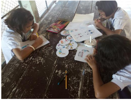
นักเรียนทำนิทานจากแผ่นซีดี