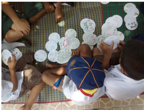
นักเรียนนำนิทานจากแผ่นซีดี ไปให้น้อง ๆ อ่าน