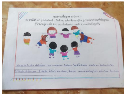
เขียนเค้าโครงเรื่องเพื่อทำนิทาน