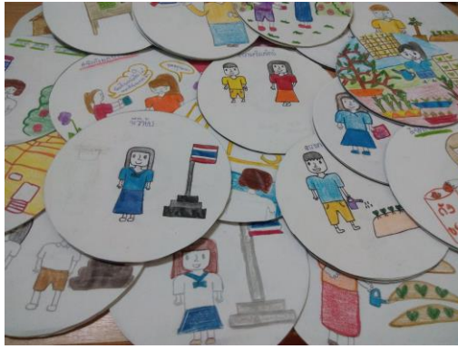
นิทานจากแผ่นซีดี