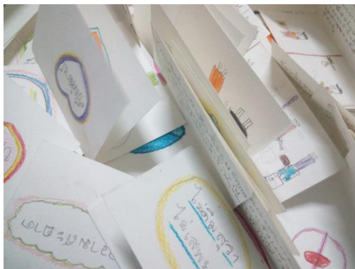
นิทานเล่มเล็กฉบับมินิ