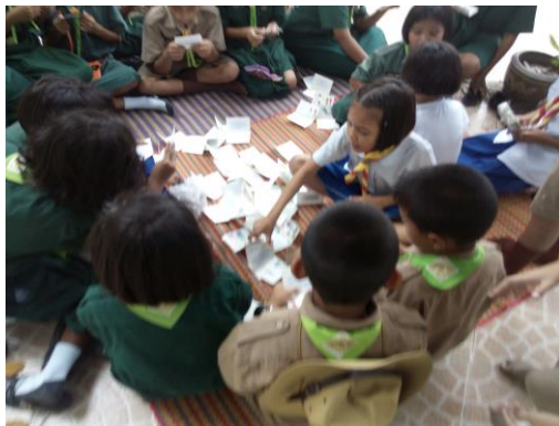
นักเรียนนำนิทานเล่มเล็กฉบับมินิ ไปให้พี่ ๆ และน้อง ๆ อ่าน