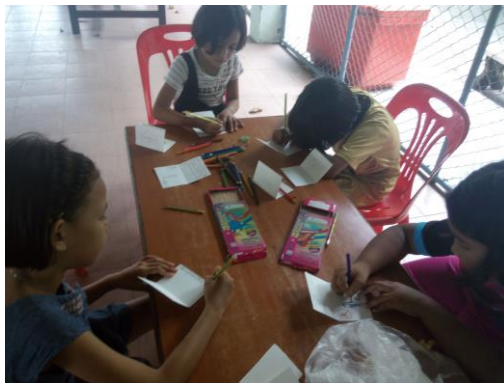
นักเรียนทำนิทานเล่มเล็กฉบับมินิ