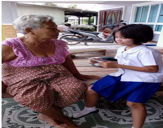
นักเรียนนำนิทานเล่มเล็กฉบับมินิ ไปอ่านให้ผู้ปกครองฟัง