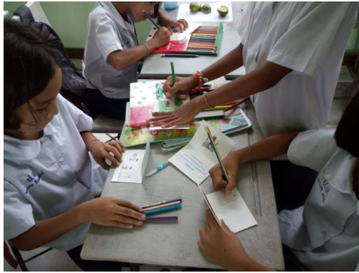
นักเรียนทำนิทานเล่มเล็กฉบับมินิ