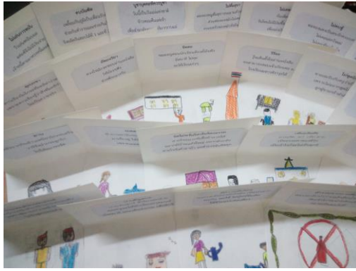
นิทานเล่มเล็กฉบับมินิ