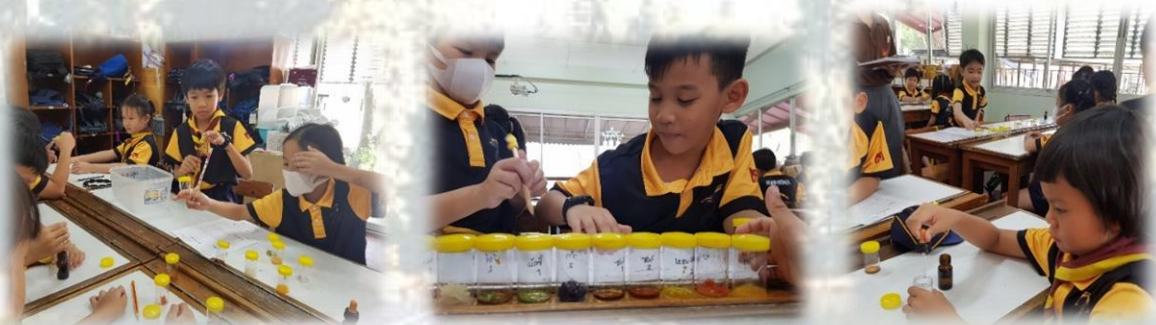
ภาพการทำงานของนักเรียนในสัปดาห์ที่ ๔ ครั้งที่ ๑ เรื่องการทดสอบสารอาหาร

หลังจากการแลกเปลี่ยนในวง KM ของวิชามานุษยกับโลก ได้มีการนำวิธีตั้งเป้าหมายการทำงานกลุ่มไปใช้อีกครั้งในสัปดาห์ที่ ๔ ครั้งที่ ๑ แต่เปลี่ยนเป้าหมายจากวิธีการทำงานกลุ่มเป็นลักษณะของการทำงานร่วมกันว่าจะต้องมีลักษณะอย่างไร ซึ่งนักเรียนทั้งห้องตอบเหมือนกันว่าต้องมีความสามัคคี ครูจึงอธิบายเพิ่มเติมว่าสมาชิกในกลุ่มจะต้องมีการพูดคุย ประเมินและรับรู้หรือเข้าใจข้อมูลในกลุ่มตรงกัน จากนั้นครูได้นำเป้าหมายนี้ไปตั้งเป็นเป้าหมายร่วมกันของห้องและให้นักเรียนประเมินการทำงานตามเป้าหมายนี้ พบว่ามีนักเรียนกลุ่ม ๔ เพียงกลุ่มเดียวที่ประเมินว่าสามารถทำตามเป้าหมายได้ดีมาก