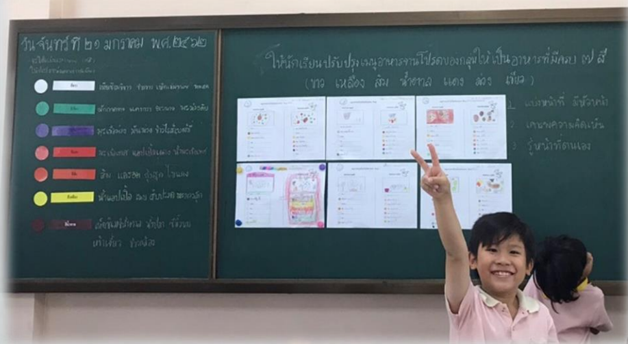
ภาพกระดานที่นักเรียนแลกเปลี่ยนเป้าหมายของห้อง ๓ ข้อ (ด้านขวามือ) และชิ้นงานของนักเรียนแต่ละกลุ่ม

เมื่อให้นักเรียนประเมินการทำงานหลังจากกิจกรรมจบลง นักเรียนกลุ่มที่ ๑-๕ ประเมินว่าสามารถทำตามเป้าหมายได้ดี ส่วนกลุ่มที่ ๖ ประเมินว่าทำได้บ้างไม่ได้บ้างเนื่องจากยังมีการทะเลาะกันอยู่ในกลุ่ม และจากการสังเกตพบว่ามีนักเรียนที่ไม่ค่อยมีส่วนร่วมในการทำงานอยู่บ้างแต่มีความขัดแย้งในการทำงานน้อยลง