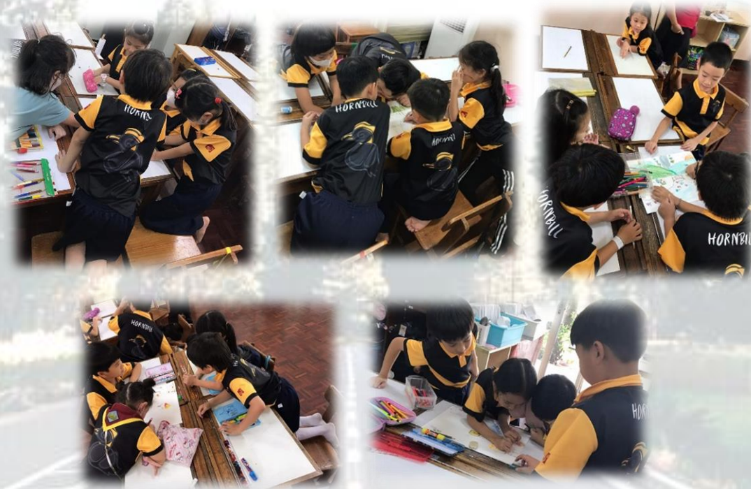
บรรยากาศการทำงานของนักเรียนแต่ละกลุ่ม

สัปดาห์ที่ ๔ ครั้งที่ ๒ เป็นครั้งสุดท้ายของการทำงานกลุ่มในภาควิมังสา ฉะนั้นให้นักเรียนแต่ละกลุ่มตั้งเป้าหมายของกลุ่มตนเอง ซึ่งมีนักเรียน ๒ กลุ่มจากทั้งหมด ๕ กลุ่มที่ตั้งเป้าหมาย แต่ทั้ง ๒ กลุ่มตั้งเป้าหมายเหมือนกันว่า จะรับฟังความคิดเห็นของเพื่อน แต่เนื่องจากในชั่วโมงเรียนนั้น ได้ใช้เวลาในการทำงานนานกว่าที่วางไว้ในแผน ทำให้นักเรียนไม่ได้ประเมินการทำงานของกลุ่มในครั้งนั้น