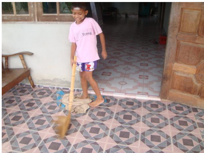
ทัน กวาดบ้าน