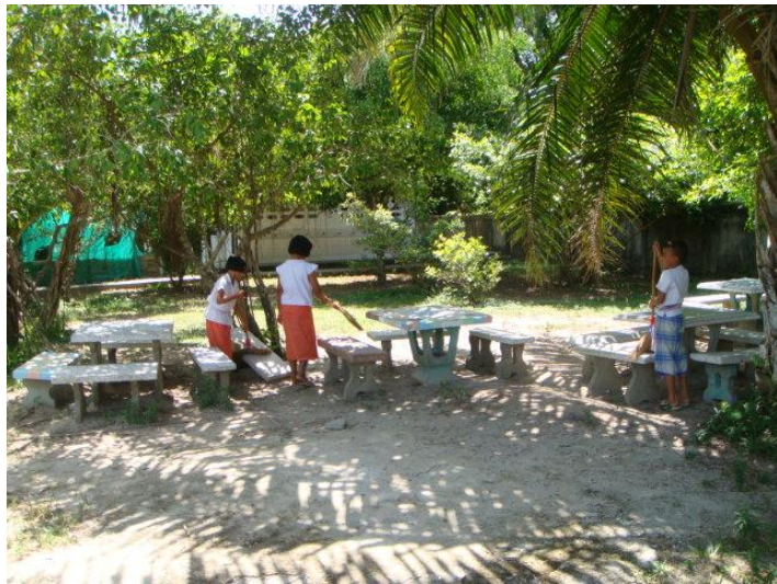
กวาดม้านั่ง ที่บ้าน