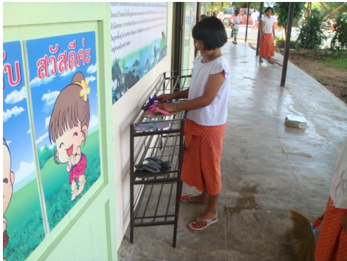
จัดรองเท้า