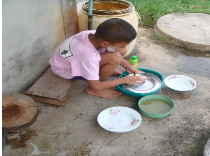
ทัน ล้างจาน