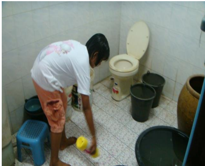
วิว ล้างห้องน้ำ