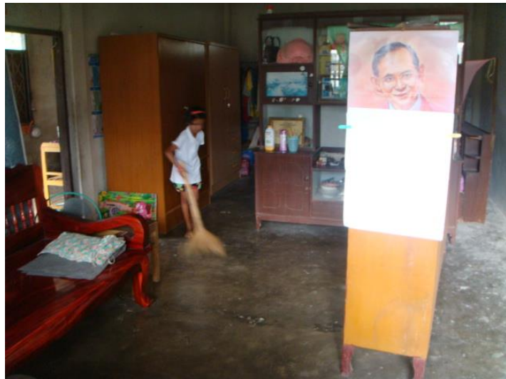
ฟ้า กวาดบ้าน