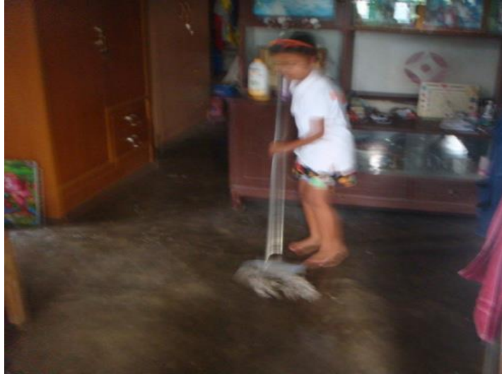
ฟ้า ถูพื้น