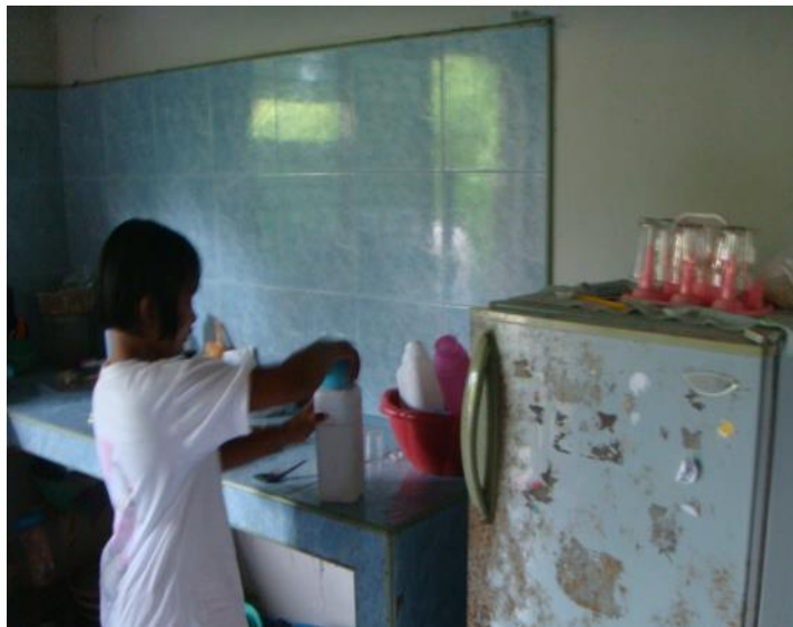
วิว กรอกน้ำใส่ตู้เย็น