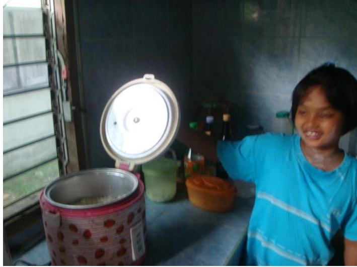
วิว หุงข้าว