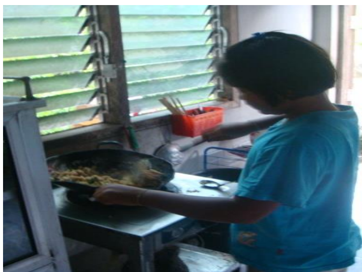
วิว ทำข้าวผัด