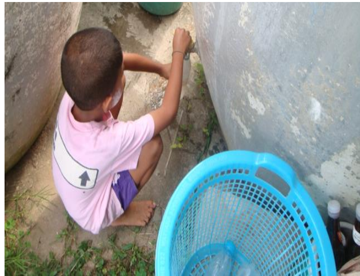
ทัน กรอกน้ำใส่ตุ๋ยี่น