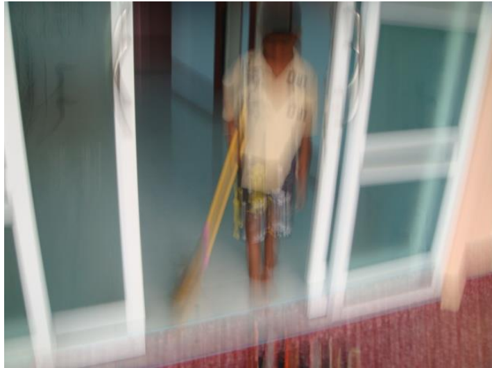
อาร์ม กวาดบ้าน