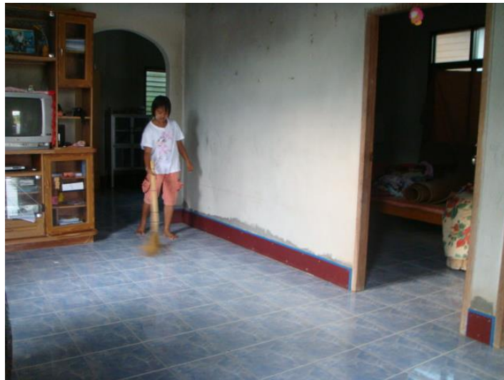
วิว กวาดบ้าน