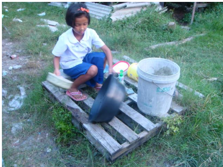
ฟ้่า ล้างจาน