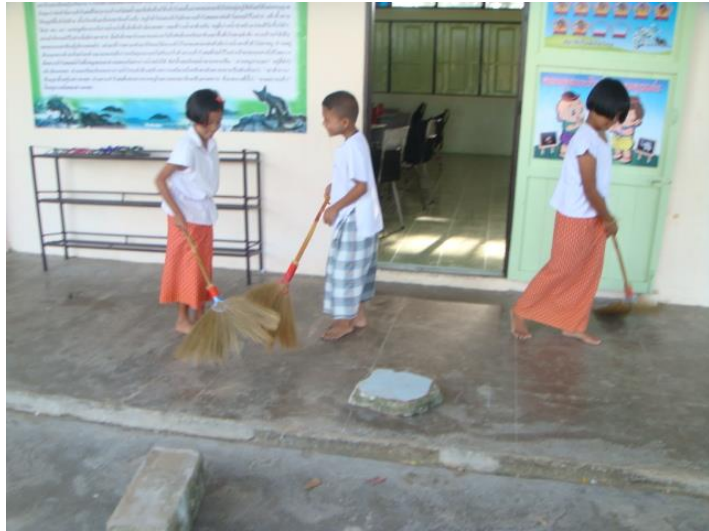
กวาดห้อง