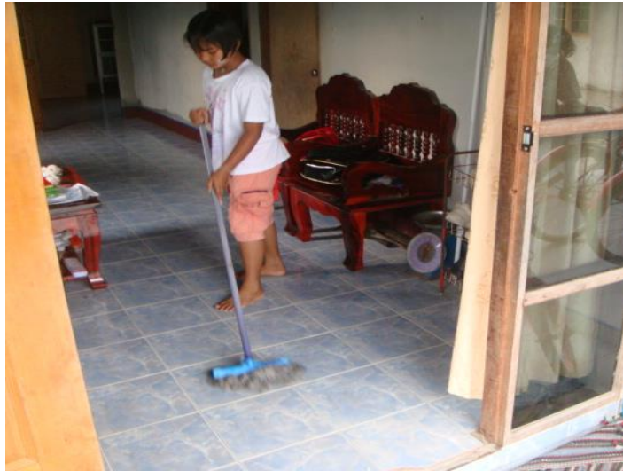
วิว ถูบ้าน