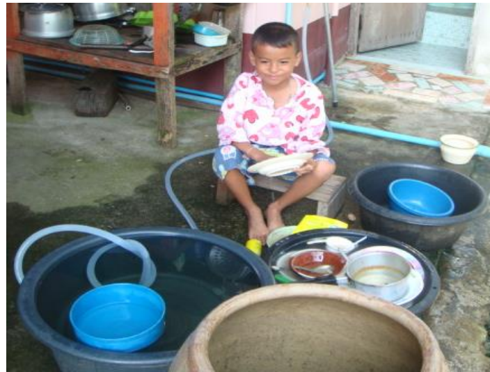
เขต ล้างจาน