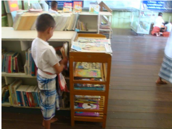
จัดห้องสมุด