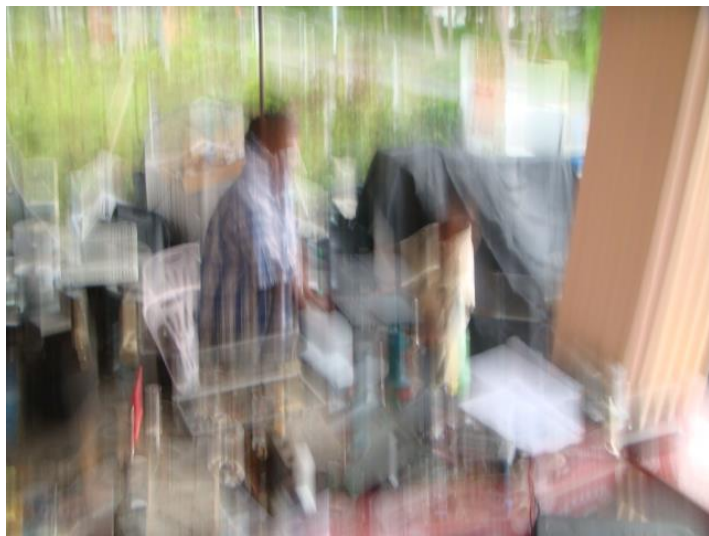
อาร์ม ช่วยพ่อทำงาน