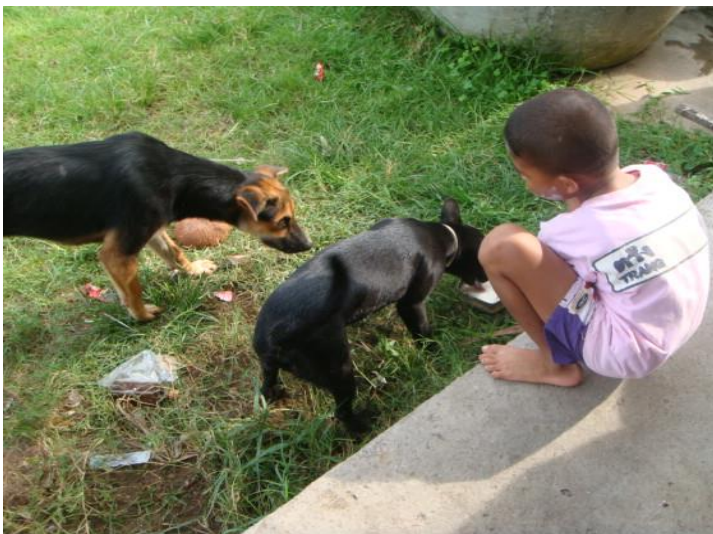
ทัน ให้อาหารสุนัข