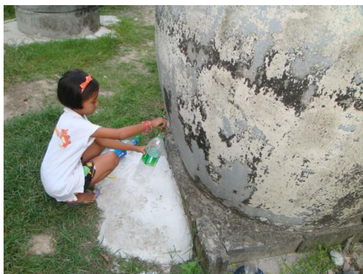
ฟ้า กรอกน้ำใส่ตุ๋ยั้น