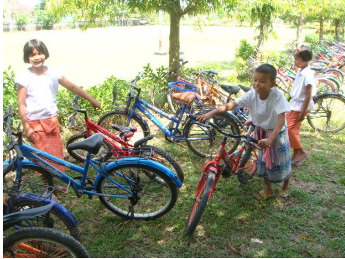
จัดจักรยาน