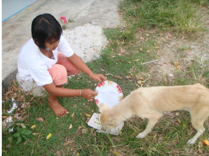
วิว ให้อาหารสุนัข