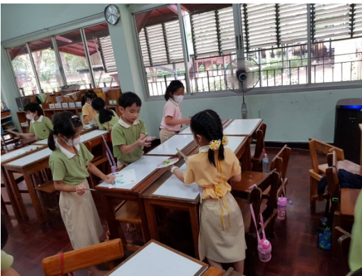
เก็บโต๊ะ