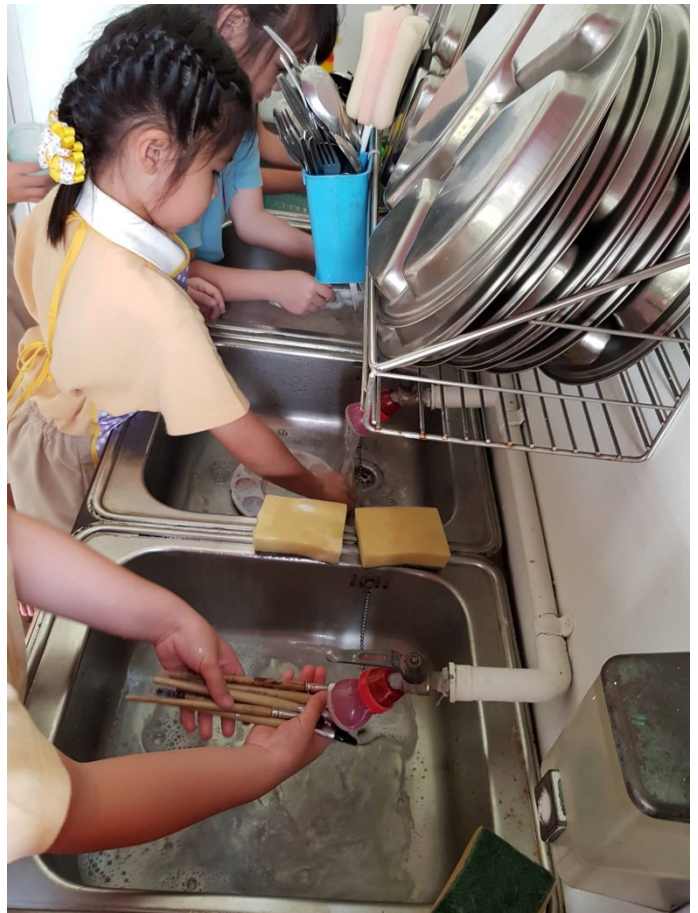
ล้างฟู้กัน