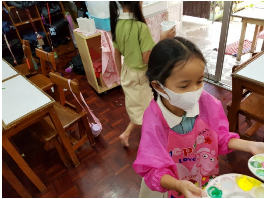
ล้างจานสี

กลุ่มที่แบ่งหน้าที่การจัดเก็บอุปกรณ์ตามเลขที่ตัวเองจากน้อยไปหาเลขที่มาก