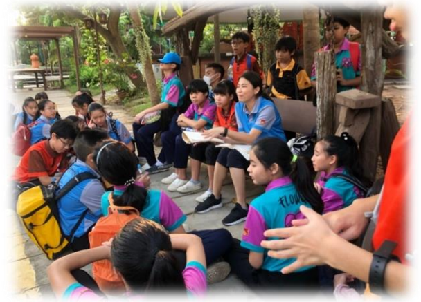
(ประชันร้อยกรอง “ชมอัมพวา” ธาษา ๖/๓)