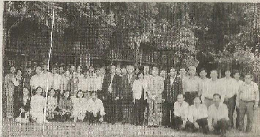
ผู้เข้าร่วมการประชุม กว่า 40 คน ที่เข้าร่วม Learning Forum "Sufficiency Economy and New Agricultural Theory in Ho-Chi Minh, Vietnam" เมื่อวันที่ 29 กันยายน 2549 Minh Tran Co.,Ltd.