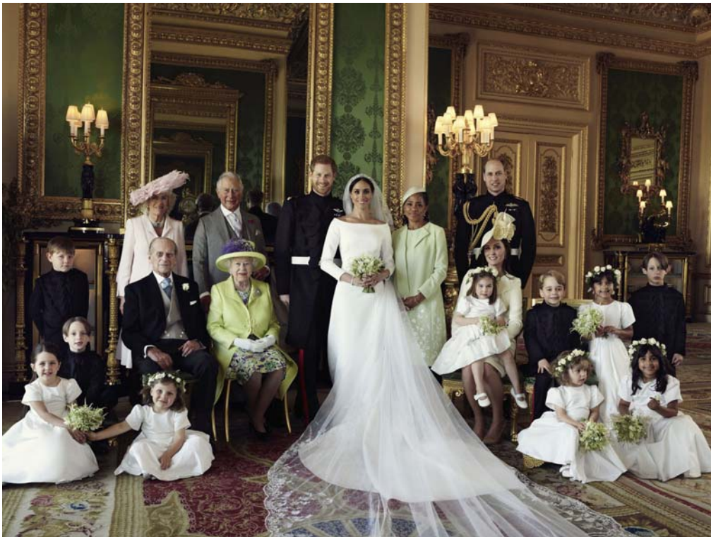
งานเสกสมรสระหว่างเจ้าชายแฮร์รีและมาร์เคิล

ศ.ดร.จีระ หงส์ลดารมภ์ กล่าวว่า ก่อนงานพิธีเสกสมรสของเจ้าชายแฮร์รีและมาร์เคิล มันมีวิธีการที่น่าสนใจอยู่ตรงที่ว่า เจ้าชายแฮร์รีเป็นพระราชนัดดาในสมเด็จพระราชินีนาถเอลิซาเบธที่ 2 เป็นพระโอรสองค์ที่ 2 ของเจ้าหญิงไดอาน่า งานพิธีเสกสมรสครั้งนี้คึกคักมาก ในสหรัฐอเมริกา ก็มีถ่ายทอดทางโทรทัศน์และโรงภาพยนตร์ ศ.ดร.จีระ หงส์ลดารมภ์ก็ได้ติดตามเรื่องนี้และก็อยากจะเสนอแนวคิดทฤษฎี 3V's Value Added คือ เพิ่มจากมูลค่าที่เรามีอยู่แล้ว Value Creation มาจากความคิดสร้างสรรค์ Value Diversity คือนำความหลากหลายมาเป็นพลัง ความหลากหลายของราชวงศ์และมาร์เคิลมีเรื่องน่าสนใจหลายเรื่อง งานเสกสมรสของเจ้าชายแฮร์รีและมาร์เคิลเพิ่งเกิดขึ้น อีกเรื่องคือเรื่องอันวาร อิบราฮิม ศ.ดร.จีระ หงส์ลดารมภ์ได้เคยเจอเขาตอนสมัยดร.อำนวยการ วิวัฒนาการเคยเชิญเขามาที่เมืองไทย ได้แนะนำให้ศ.ดร.จีระ หงส์ลดารมภ์รู้จัก ได้คุยกันหลายครั้ง นั่งร่วมโต๊ะอาหารด้วยกัน แต่ว่าไม่ได้พบหน้าจิบ ราชชัค ได้ยินชื่อเสียงของดร.มหาเธร์ โมฮัมหมัดเสมอ