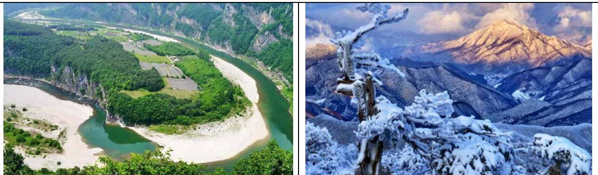
ทิวทัศน์ในเมือง PyeongChang ประเทศเกาหลีใต้ สถานที่จัดการแข่งขันกีฬาโอลิมปิกฤดูหนาวประจำปี พ.ศ. 2561

ศ.ดร.จีระ หงส์ลดารมภ์กล่าวว่า แนวนี้ก็เป็นแนวแปลก เพราะเป็นการริเริ่มของผู้นำเกาหลีเหนือ แต่การริเริ่มครั้งนี้ไปเริ่มที่เกาหลีใต้ ขณะเดียวกันเกาหลีใต้ก็เป็นสมาชิกและเป็นพันธมิตรกับสหรัฐอเมริกา เกาหลีเหนือกับเกาหลีใต้ก็พยายามจะเจรจาดตกลงกันเอง ก็พยายามให้อเมริกาค่อยๆเป็นขั้วนอกนา มันก็น่าสนใจ แต่ว่า ทรัมป์ได้ให้ความสนใจว่า ถ้ามีการคุยกันมันก็จะประโยชน์ ประธานาธิบดีเกาหลีใต้คนปัจจุบันเป็นนักพัฒนาความสัมพันธ์ระหว่างประเทศที่ดี ไม่ได้พึ่งพาสหรัฐอเมริกาอย่างเดียว ถึงแม้ว่าเกาหลีเหนือจะมีนิวเคลียร์ แต่ถ้าคุยกันได้ก็ไม่มี ความรุนแรง มันก็คือศึก 3 ฝ่าย เพราะฉะนั้นบทบาทของสหรัฐอเมริกาในครั้งนี้จะเป็นอย่างไรเพราะที่ผ่านมา ทรัมป์ก็เป็นคนกดดัน พุดจารุนแรง แล้วก็ทำตัวเป็นศัตรูกับเกาหลีเหนือโดยตรง ในขณะที่เกาหลีเหนือก็อยากจะมีสัมพันธ์ที่ดีกับเกาหลีใต้ น้องสาวของคิมจองอินก็บินมาการแข่งขันกีฬาโอลิมปิกฤดูหนาวครั้งนี้ ด้านการทูตก็ถือว่ามีความสัมพันธ์ที่ดีต่อกัน มีข่าวว่าประธานาธิบดีเกาหลีใต้พยายามจะให้คุณ Mike Pence ได้เข้าไปมีบทบาทได้คุยกัน