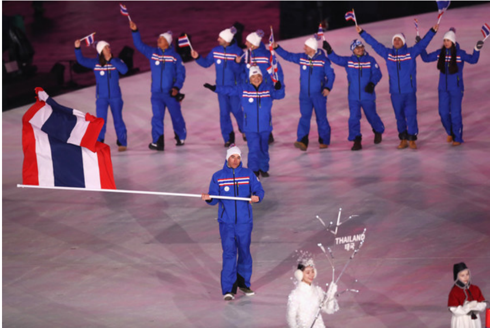
คณะนักกีฬาไทยที่เข้าร่วมการแข่งขันกีฬาโอลิมปิกฤดูหนาวประจำปี พ.ศ. 2561