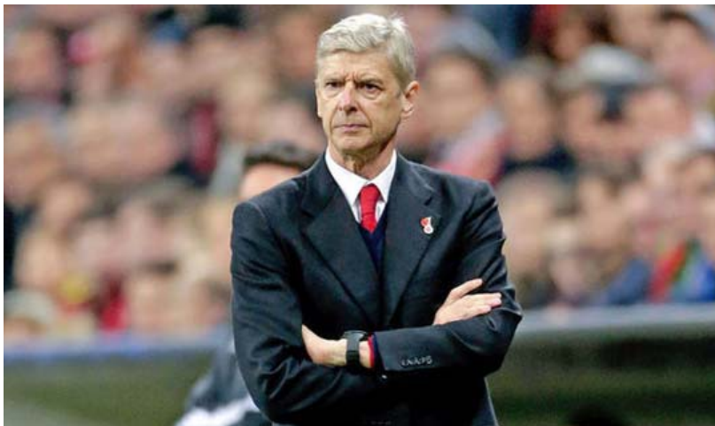
อาร์แซน แวงแกร์ ผู้จัดการทีมอาร์เซนอล