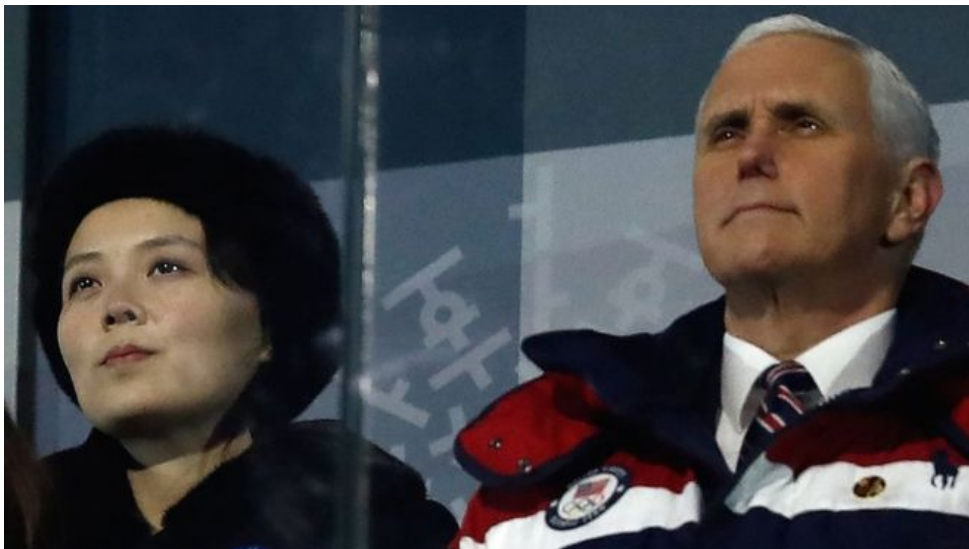
คิมโยจอง (ซ้าย) น้องสาวประธานาธิบดีเกาหลีเหนือ คิมจองอึน นั่งใกล้กับ ไมค์ เพนซ์ รองประธานาธิบดีสหรัฐอเมริกา (ขวา) ในพิธีเปิดการแข่งขันกีฬาโอลิมปิกฤดูหนาวประจำปี พ.ศ. 2561

2018+Winter+Olympic+Games+Opening+Ceremony/LYEKBhd61Ho