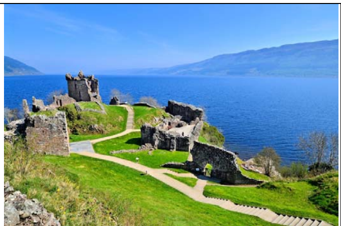
Loch Ness สก็อตแลนด์

https://www.instagram.com/p/BTYUYluhRpd/?utm_source=ig_embed