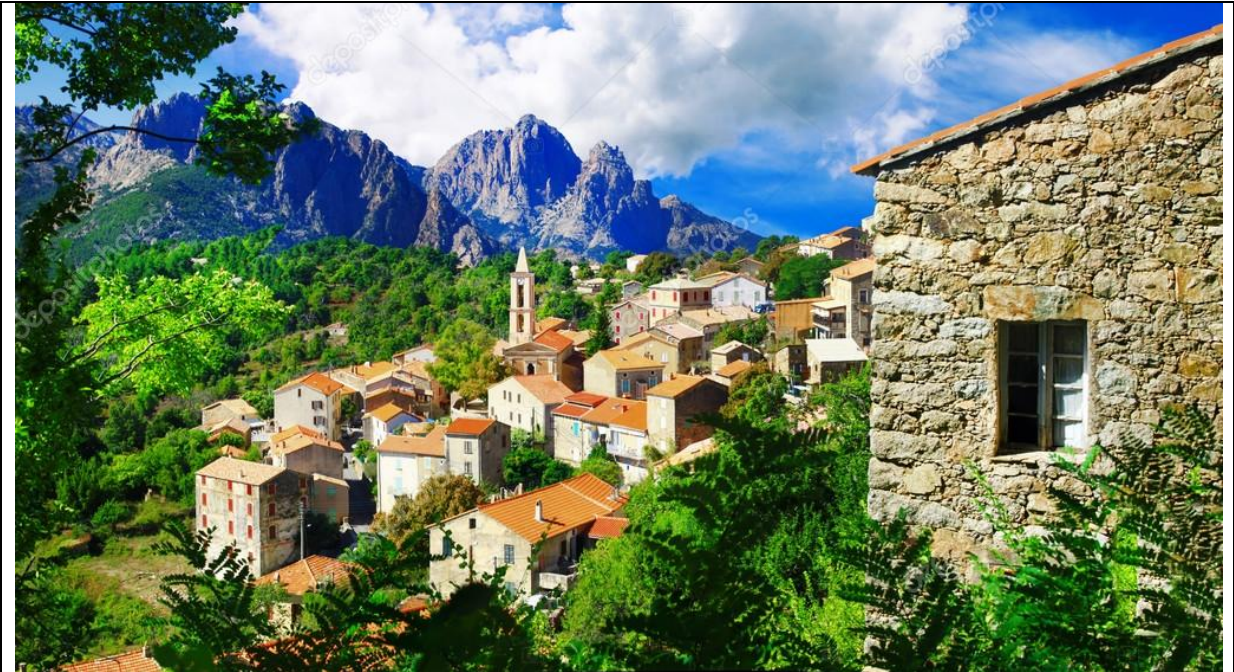
หมู่บ้านบนภูเขาที่ Corsica Island ประเทศฝรั่งเศส