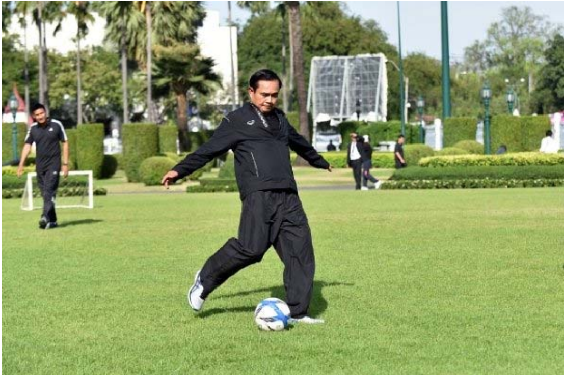
พลเอกประยุทธ์ จันทร์โอชาออกกำลังกายทุกวันพุธ

แต่ละวันก็คุ้มถ้ามีการคิดล่วงหน้า สมัยก่อน ศ.ดร.จีระ หงส์ลดารมภ์เคยคิดว่าการทำงานต้องเข้าไปทำที่ทำงาน แต่บางครั้งการไปนั่งชั่วโมงแรกในที่ทำงานก็ไม่ว่าจะทำอะไร นี่เป็นแนวคิดที่ศ.ดร.จีระ หงส์ลดารมภ์อยากฝากไว้ซึ่งก็ได้รับอิทธิพลจากตุน บอดี้สแลมด้วย พลเอกประยุทธ์ จันทร์โอชาออกกำลังกายทุกวันพุธ ก็เป็นประโยชน์