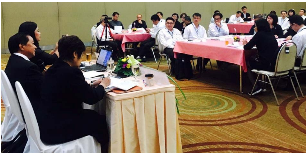
หลักสูตร พัฒนาสมรรถนะผู้ช่วยผู้อำนวยการฝ่ายของการไฟฟ้าฝ่ายผลิตแห่งประเทศไทย (EGAT Assistant Director Development Program: EADP 2017) - EADP 13