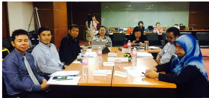
หลักสูตร ผู้นำนักบริหารเพื่ออนาคตของมหาวิทยาลัยสงขลานครินทร์ รุ่นที่ 1