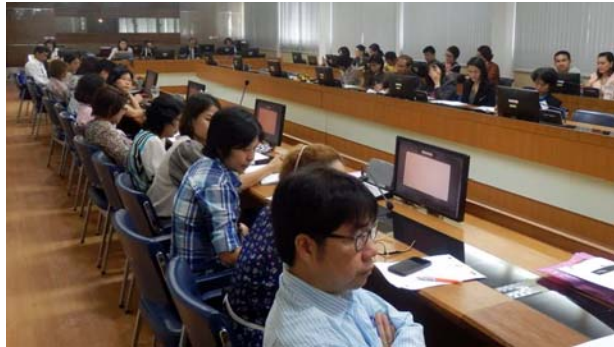
โครงการพัฒนาบุคลากรเพื่ออนาคตของคณะแพทยศาสตร์ มหาวิทยาลัยสงขลานครินทร์ รุ่นที่ 3