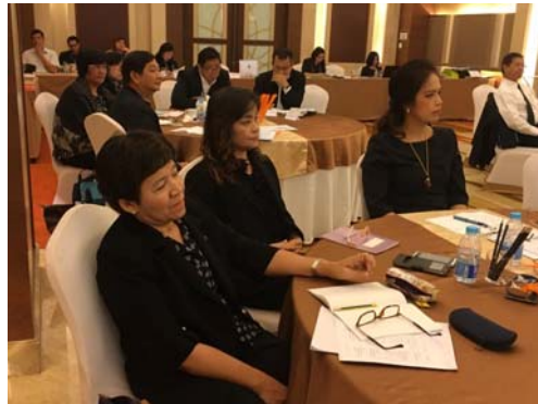
โครงการอบรมหลักสูตร “การพัฒนาผู้บริหารระดับสูง” (Executive Development Program for Top Team) ของการเคหะแห่งชาติ