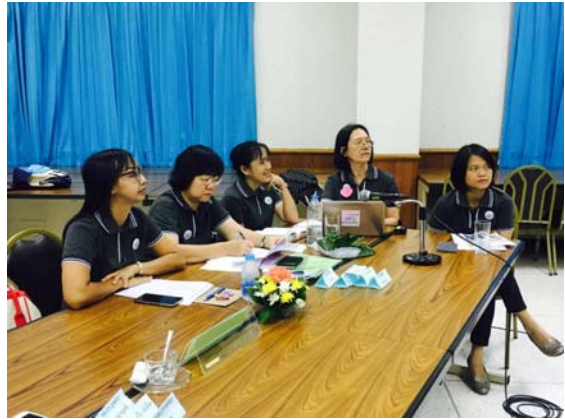
โครงการพัฒนาบุคลากรเพื่ออนาคตของคณะพยาบาลศาสตร์ มหาวิทยาลัยสงขลานครินทร์ รุ่นที่ 1