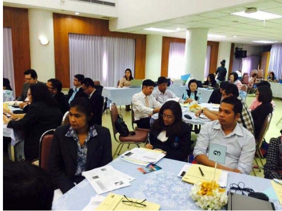
โครงการพัฒนาผู้นำและนักบริหารเพื่ออนาคตของมหาวิทยาลัยทักษิณรุ่นที่ 1