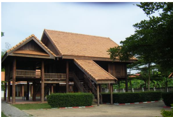
อนุสรณ์สถานบ้านเกิด ท่านหนูอັก ภูมิสุวรรณค์ ที่บ้านพาลูกา อ.ห้วยน้ำใหญ่ จ.มุกดาหาร

ลูกสาวคนแรกและเก้าอี้พักผ่อนของท่านหนูอັก