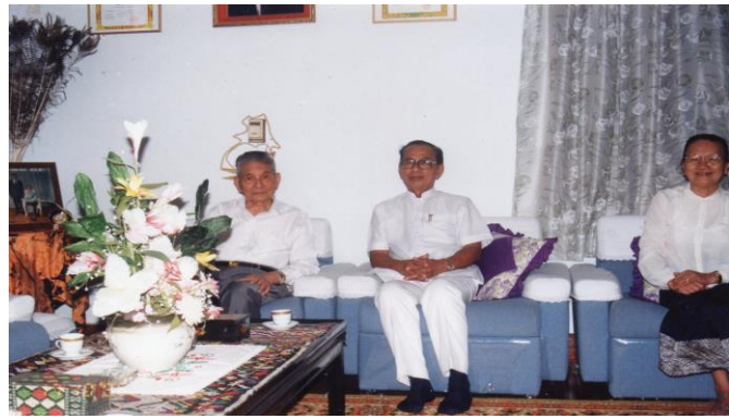
ท่านหนูอັก ภูมิสุวรรณค์ และ นางบุญมา ภูมิสุวรรณค์ ภรรยา

พระบาทสมเด็จพระเจ้าอยู่อยู่ และท่านหนูอັก