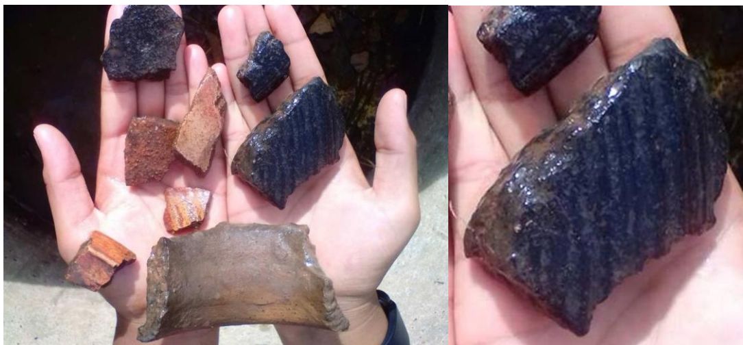
ภาพที่๒๐ ภาชนะลายเชือกทาบ : ถ่ายเมื่อวันที่ ๒๐ พฤษภาคม ๒๕๖๐