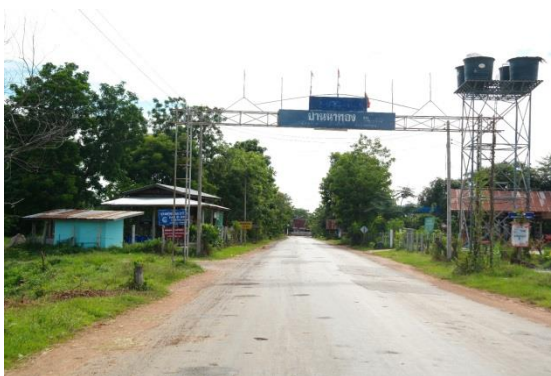
ภาพที่ ๑ บ้านนาทอง ต.นาทอง อ.เชียงยืน ถ่ายเมื่อวันที่ ๒๐ พฤษภาคม ๒๕๖๐

บ้านนาทอง ตำบลนาทอง อำเภอเชียงยืน จังหวัดมหาสารคาม อยู่ห่างจากตัวจังหวัดไปทางทิศตะวันตกเฉียงเหนือ ระยะทางประมาณ ๕๐ กิโลเมตร และอยู่ที่ทิศตะวันตกอำเภอเชียงยืนห่างออกไปประมาณ ๖ กิโลเมตร ตามถนนแผ่นดินหมายเลข ๒๐๙ สายขอนแก่น – กาฬสินธุ์ บ้านนาทองเป็นหมู่บ้านที่เป็นชุมชนโบราณ เดิมชื่อว่า บ้านนาค้อ ในปี พ.ศ. ๒๔๘๙ ได้เปลี่ยนชื่อจากบ้านนาค้อเป็นบ้านนาทอง เพราะมองดูทุ่งนาเต็มไปด้วยข้าวเหลืองอร่ามตั้งทองคำ จึงได้ชื่อว่าตำบลนาทอง ตั้งแต่นั้นมา ต่อมา ในปีพ.ศ. ๒๕๓๕ ได้แบ่งแยกหมู่บ้านนาทอง ออกเป็น ๒ หมู่บ้าน คือ บ้านนาทองหมู่ที่ ๓ และบ้านนาทองหมู่ที่ ๙