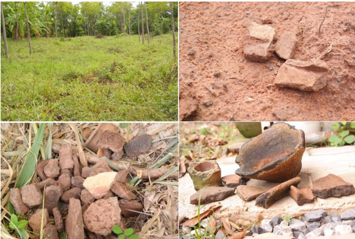
ภาพที่๑๙ เนินโพธิ์เป็นบริเวณที่พบภาชนะโบราณ : ถ่ายเมื่อวันที่ ๒๐ พฤษภาคม ๒๕๖๐

เล่าว่า จะพบภาชนะเครื่องใช้ อยู่รอบๆ เนิน ชาวบ้านเรียกเนินนี้ว่าเนินโพธิ์ ส่วนมากพบทางทิศตะวันตกของหมู่บ้าน บางทีไถพรวนไปก็เจอเศษภาชนะโบราณ แต่ไม่มีใครเอาไปครอบครอง จึงพบเศษภาชนะโบราณในสภาพที่วางอยู่บนพื้นดิน