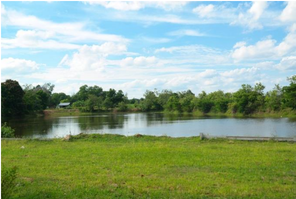
ภาพที่ ๕ หนองสาธารณะประโยชน์

มีหนองธรรมชาติคือหนองฮางกับหนองสาธารณะประโยชน์ที่ขุดใหม่ มีห้วยค้อเป็นห้วยที่ผ่านหลายหมู่บ้าน มีสระแดงที่อยู่ทางใต้ มีน้ำสีแดงไม่ใช่ประโยชน์ในการเกษตร