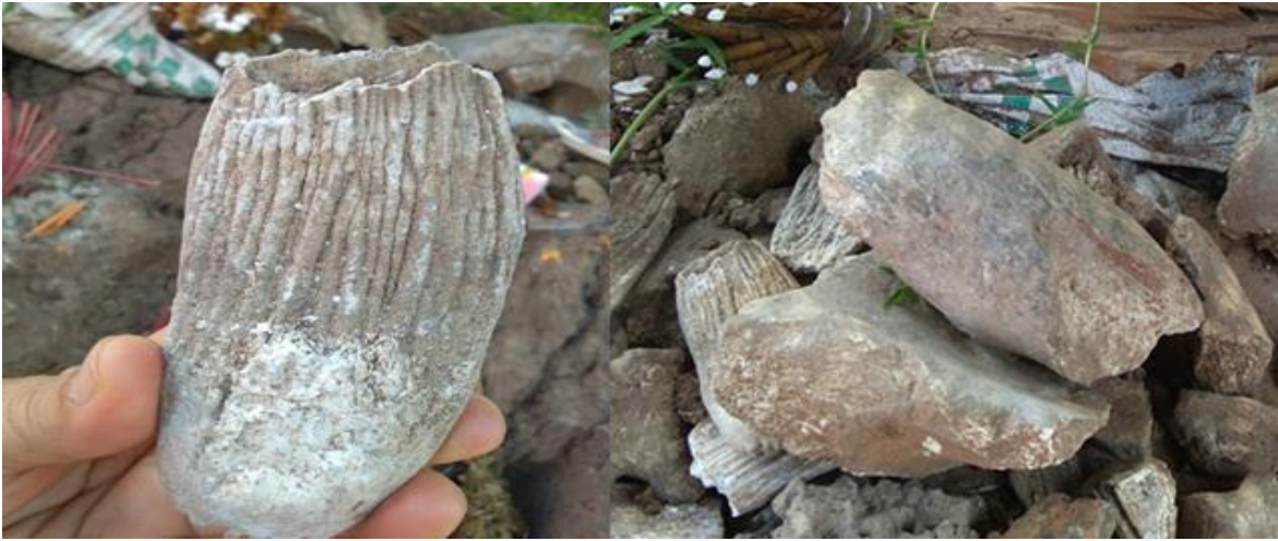
ภาพที่๑๘ สันนิษฐานว่าเป็นฟืนกรามข้าง : ถ่ายเมื่อวันที่ ๒๐ พฤษภาคม ๒๕๖๐ นายทองม้วน สีเนตรหอย

เล่าว่า จะพบภาชนะเครื่องใช้ อยู่รอบๆ เนิน ชาวบ้านเรียกเนินนี้ว่าเนินโพธิ์ ส่วนมากพบทางทิศตะวันตกของหมู่บ้าน บางทีไถพรวนไปก็เจอเศษภาชนะโบราณ แต่ไม่มีใครเอาไปครอบครอง จึงพบเศษภาชนะโบราณในสภาพที่วางอยู่บนพื้นดิน