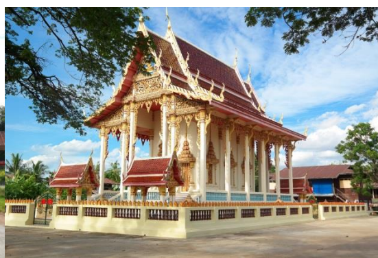
ภาพที่ ๒ วัดสุวรรณรังสี ถ่ายเมื่อวันที่ ๒๐ พฤษภาคม ๒๕๖๐