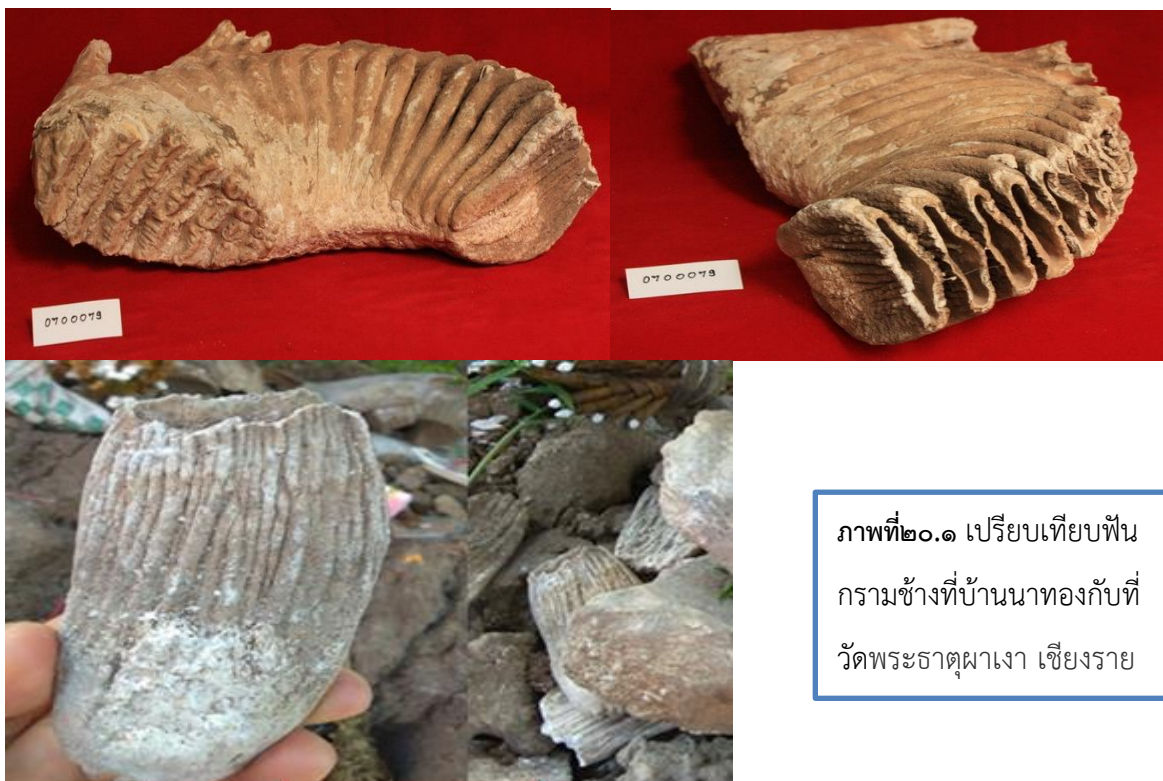
ภาพที่๒๐.๑ เปรียบเทียบฟัน กรามช้างที่บ้านนาทองกับที่ วัดพระธาตุผาเงา เชียงราย