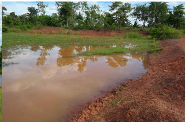
ภาพที่ ๖ สระแดง