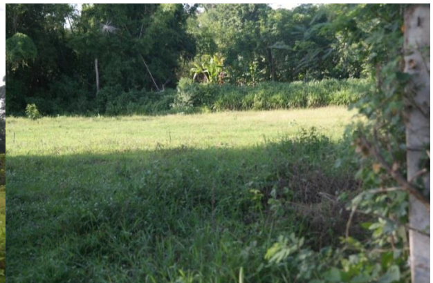
ภาพที่๑๓ บริเวณที่บ้านหลังแรกที่ย้ายเข้ามาตั้งถิ่นฐาน