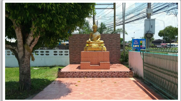
ภาพบรรยากาศโรงเรียน

บรรยากาศได้รับการปรับปรุงและพัฒนาทั้งภายในภายนอกได้ร่มรื่น สวยงาม และจัดบรรยากาศเอื้อต่อการเรียนการสอน ได้รับความร่วมมือจากหน่วยงานทั้งภาครัฐ เอกชนและประชาชนในพื้นที่เป็นอย่างดี