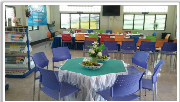
บรรยากาศห้องสมุด