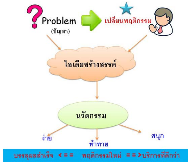
รูปที่ 2 ความหมาย ความแตกต่างของไอดีสร้างสรรค์กับนวัตกรรม

โดยสรุปแล้วผู้เขียนสรุป ไอดีสร้างสรรค์ว่ามีความหมายดังนี้