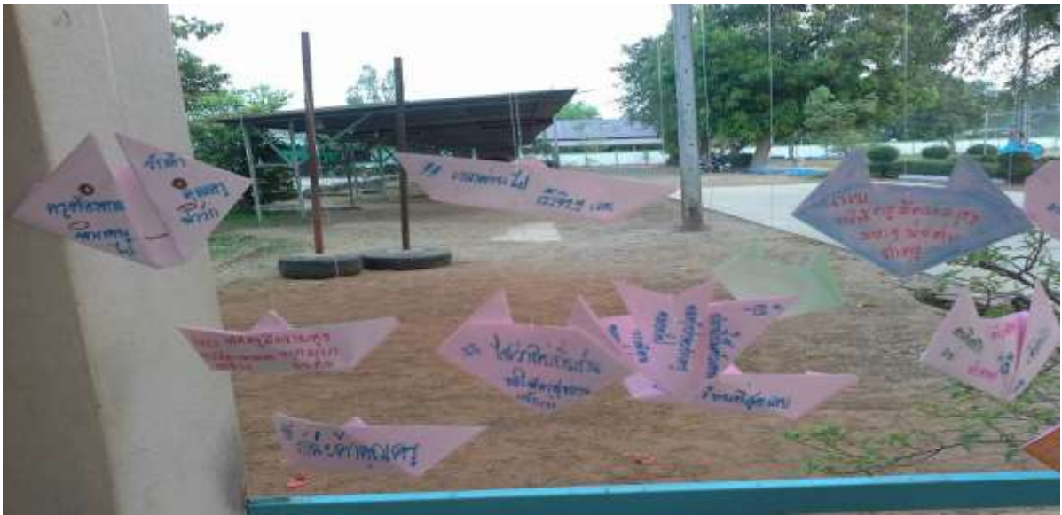
เครดิต ภาพจาก facebook โรงเรียนบ้านปะทาย

งานครุฑคล้ายปลุก พฤษภา ลำตันอ่อนเอนหา ทางเหนียว ไวน้อ ไม้เต็บแตกกิ่งก้าน สาขา ศิษย์ประกอบนนา อาชีพ