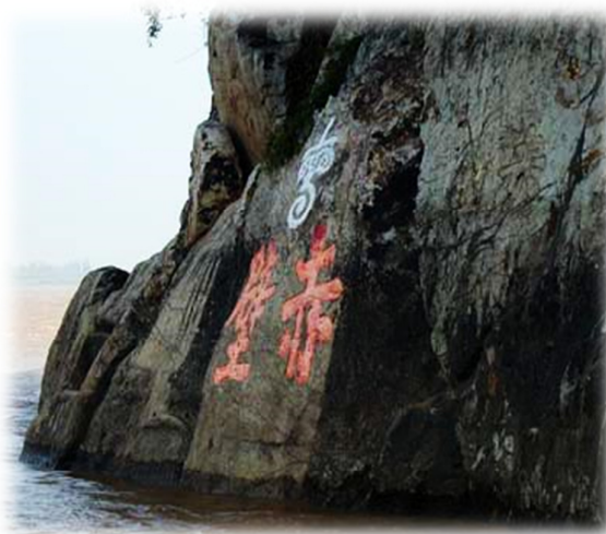
ภาพที่ 4 ผาแดง (เซ็กเพ็ก) ริมฝั่งแม่น้ำแยงซี แดนยุทธภูมิสำคัญในสามก๊ก ตอน โจโจแตกทัพเรือ ที่มา: ออบอร์ดแดชทัวร์ดอทคอม (2558)

สมรภูมิเซ็กเพ็ก ยุคสามก๊กอยู่ที่อำเภอผู่ฉี มณฑลหูเป่ย์ ในปัจจุบันไม่เกี่ยวข้องกับเซ็กเพ็ก เมืองหวงโจว มณฑลหูเป่ย์ ในบทกวีทวนรำลึกศึกเซ็กเพ็กของซูซือ 7 แต่เนื่องจากเกียรติคุณทางอักษรศาสตร์ของซูซือ โดยเฉพาะอย่างยิ่งสัมฤทธิ์ภาพอันสูงส่งทางวรรณศิลป์ของกวีนิพนธ์บทนี้ ทำให้ผู้คนพูดต่อๆ ฟังต่อๆ กันไป และให้สมญาอันสูงส่งแก่สถานที่แห่งนี้ว่า “เซ็กเพ็กบุน” (เซ็กเพ็กทางอักษรศาสตร์) เป็นเหตุให้เซ็กเพ็กที่เมืองหวงโจวกับเซ็กเพ็กที่อำเภอผู่ฉี ซึ่งอยู่ในมณฑลหูเป่ย์ด้วยกันทั้งคู่ มีสมญาแยกกันว่า เซ็กเพ็กบุน (เซ็กเพ็กทางอักษรศาสตร์) กับเซ็กเพ็กบู (เซ็กเพ็กทางยุทธศาสตร์) เป็นตำนานอันงดงามอยู่ในวงการประวัติศาสตร์ (หลี่ฉวนจวินและคณะ, 2556: 149-150)