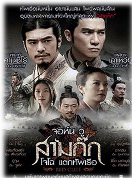
ภาพที่ 3 สามก๊ก ตอน โจโจ่แตกทัพเรือ จากภาพยนตร์เรื่อง สามก๊ก พ.ศ. 2551

เป็นคำถามที่ 37 ใน 101 คำถามสามก๊กสามก๊ก ตอน โจโจ่แตกทัพเรือนี้ถือเป็นเหตุการณ์สำคัญตอนหนึ่งที่ทำให้ขยายสามก๊กดুমี่สี่สัน นับเป็นเหตุการณ์ในสามก๊กที่มีความสนุกสนานมากที่สุดตอนหนึ่ง กลยุทธ์ในการสงครามถูกนำมาใช้ในเหตุการณ์นี้อย่างเต็มเปี่ยม อาทิ ขงเบ้งยุยงให้จิวยี่และซุนกวนรบกับโจโจ่ ขงเบ้งยืมลูกเกาทัดตโจโจ่ จิวยี่ใช้อุบายเจ็บกายโดยใช้อุบายแม่ทัพง่อก๊กเป็นหนึ่งในอุบาย จิวยี่ซ่อนกลเจียวก้านให้ไปพบบังทอง สุดท้ายบังทองวางกลห้วงโซ่เหล็กแก่ทัพเรือโจโจ่ ขงเบ้งเรียกลมอาคเนย์ให้ทัพง่อก๊กและการใช้ไฟเผาทัพเรือ ซึ่งการใช้ไฟเผาทัพเรือนี้ ตามเรื่องสามก๊กฉบับเจ้าพระยาพระคลัง (หน) นั้น ผู้ที่คิดอุบายนี้มีอยู่ 2 คน ด้วยกัน คือ ขงเบ้งและจิวยี่ 6 ผลสุดท้ายทัพเรือของโจโจ่ก็ต้องพินาศยับเยิน การที่ทัพเรือของโจโจ่แตกพ่ายไปด้วยไฟนั้น ในพงศาวดารสามก๊กจี ภาคอุยก๊ก บทประวัติโจโจ่ ไม่มีการกล่าวถึงการโจมตีด้วยไฟ แต่กล่าวว่าเกิดโรคระบาดขึ้น มีแพทย์ชาวจีนชื่อ หลีโหย่วซง เห็นว่า “โจโจ่ฟ่ายตีกเซ็กเพ็กเพราะโรคระบาด คือโรคพยาธิใบไม้ในเลือด” (หลี่ฉวนจวินและคณะ, 2556: 147)