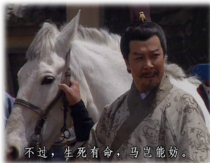
ภาพที่ 1 เล่าปี่และม้าเด็กเลา จากภาพยนตร์เรื่อง สามก๊ก พ.ศ.2537

ทำไมเหล่าที่ปรึกษาจึงเห็นว่าม้าเด็กเลาของเล่าปี่ให้โทษแก่เจ้าของ