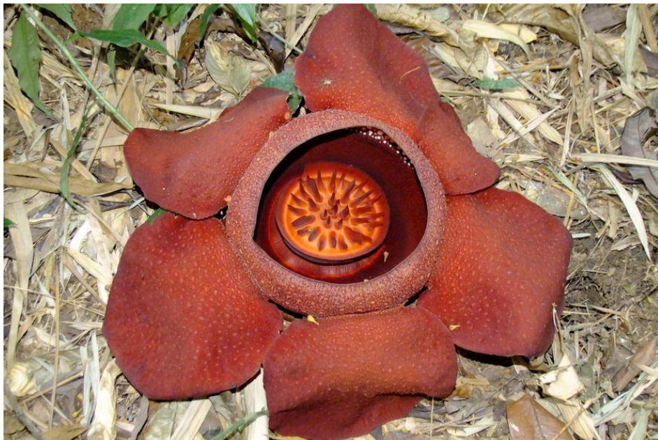
ดอกบัวผุด

ที่มา: https://www.youtube.com/watch?v=GVpM83F0SJE