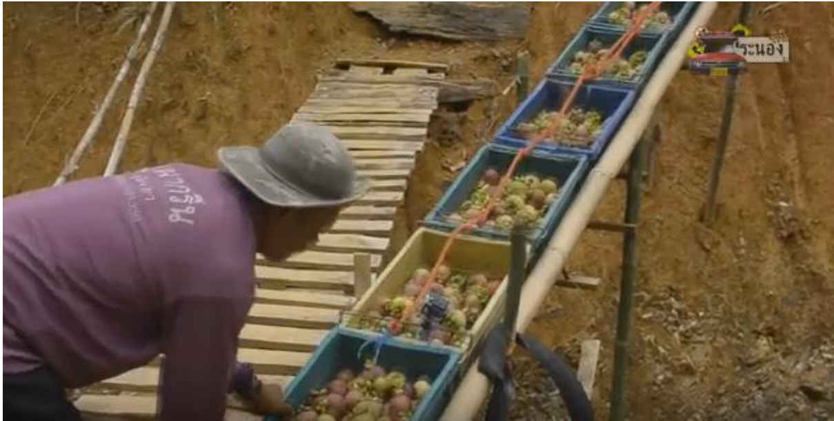
บ้านในวง