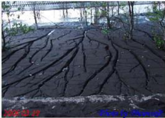
เกาะทรายดำ

เกาะทรายดำ มีหาดทรายสีดำ สีดำที่ฉาบตัวหาดคือสีของไบโโองคาง หาดทรายดำเป็นแหลมที่ยื่นออกสู่ทะเล มันจึงเป็นที่รวมเอาตะกอนและสิ่งต่าง ๆ ที่น้ำพัดพามา เกาะทรายดำเป็นเกาะสถานที่ท่องเที่ยวเชิงอนุรักษ์ที่ยังคงสภาพนิเวศวิทยาที่อุดมสมบูรณ์ นอกจากนี้ยังเป็นแหล่งท่องเที่ยวชุมชน เพราะมีชุมชนบ้านหาดทรายดำซึ่งเป็นหมู่บ้านเล็ก ๆ ของชาวประมงพื้นบ้าน และประชากรเกือบ 100% เป็นชาวมุสลิม ถือเป็นแหล่งท่องเที่ยว Halal Tourism อีกด้วย