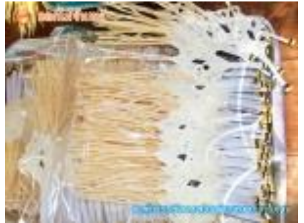
กลุ่มทำดอกไม้จันทน์บ้านหนองกระทุ่ม หมู่ที่ 7