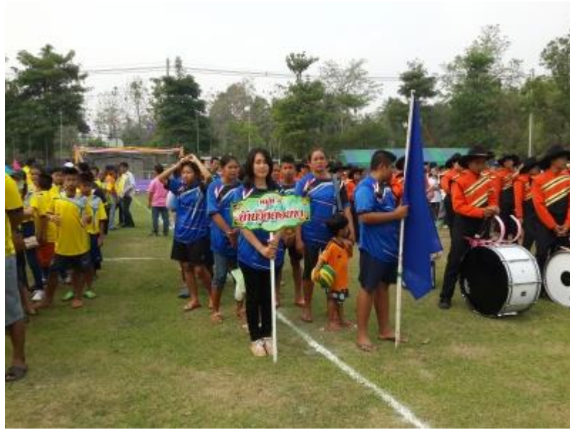
กิจกรรมทอดผ้าป่าสมทบ “กองทุนแม่ของแผ่นดิน”