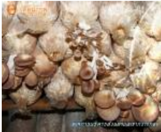
กลุ่มเพาะเห็ดนางฟ้า บ้านเกาะแก้ว หมู่ที่ 10