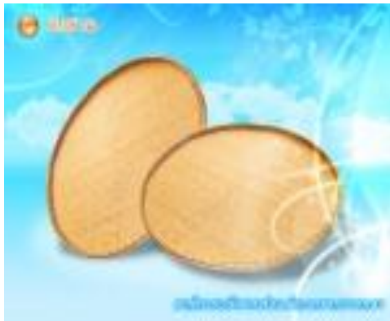
กลุ่มจักสานบ้านเกาะแก้ว หมู่ที่ 10