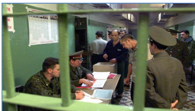
นักโทษลงคะแนนเลือกตั้งประธานาธิบดีในเรือนจำในกรุงมอสโก ปี 2000

การให้นักโทษมีสิทธิใช้สิทธิเลือกตั้งประธานาธิบดีในเรือนจำและศูนย์กักกันของรัสเซีย เป็นการดำเนินการภายใต้แนวคิดเรื่อง สิทธิ เสรีภาพ เช่น การใช้สิทธิเลือกตั้งประธานาธิบดีของนักโทษในเรือนจำกรุงมอสโก ประเทศรัสเซีย เมื่อปี 2000 ผลการเลือกตั้งปรากฏว่าอดีตสายลับ เค จี บี และ รองนายกรัฐมนตรียูตินชนะด้วยคะแนนร้อยละ 53 ของผู้ใช้สิทธิเลือกตั้งทั่วประเทศ