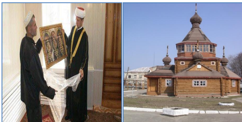
พิธีเปิดมัสยิดแห่งแรกในเรือนจำเขตพื้นที่โบโกจอนซึกส์ รัสเซีย 2013 และ คริสตจักรในเรือนจำอาณานิคมเมืองอาซาน รัสเซีย

ในปี 2001 ปรากฏว่าครั้งหนึ่งของอาณานิคมราชทัณฑ์ ในสาธารณรัฐมอร์ดวี (Mordoviia) รัสเซีย ได้มีการก่อสร้างโบสถ์คริสต์จักรในเรือนจำอาณานิคม ข้อมูลจาก เว็บไซต์ http://www.lovehusain.com/index.php?mo=3&art=42103143 พบว่า เป็นการดำเนินงานโดยบาทหลวงของคริสตจักรออร์ทอดอกซ์ สามารถแก้ไขฟื้นฟูนักโทษได้อย่างมีประสิทธิภาพมากกว่าเจ้าหน้าที่เรือนจำ นอกจากนี้ สภามุฟตีแห่งรัสเซีย ได้ลงนามข้อตกลงร่วมกับกรมเรือนจำบริการแห่งชาติรัสเซียในการเปิดห้องละหมาด อย่างเป็นทางการในเรือนจำรัสเซีย เมื่อ ปี 2011 การก่อสร้างมัสยิดแห่งแรกในเรือนจำเขตพื้นที่ “โบโกจอนซึกส์” รัสเซีย เมื่อปี 2013