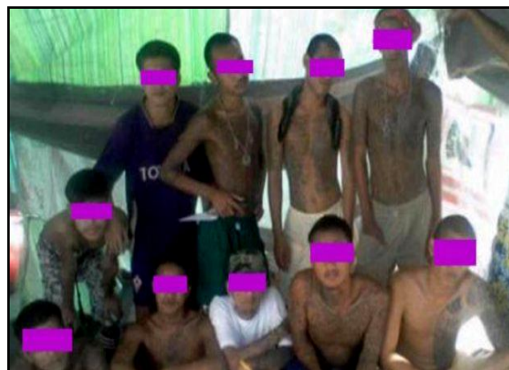
รอยสักของนักโทษไทย