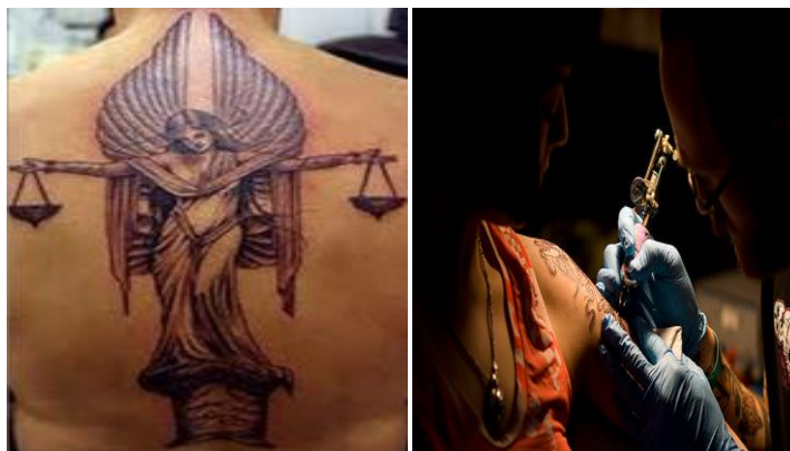
การสักรอยสัก

การสักรอยสักได้กระทำภายใต้แนวความคิดความเชื่อที่หลากหลาย เช่น เชื่อว่ารอยสักสามารถป้องกันภูตผีปีศาจและกำจัดภัยพิบัติ เชื่อว่ารอยสักเป็นสิ่งสวยงาม เช่น รอยสักคิ้วและแต่งหน้าอื่น ๆ การใช้รอยสักในการแสดงสถานะทางสังคมของผู้หญิง และ การตีความพันธมิตรเฝ้าของชาวอียิปต์โบราณ ในอังกฤษเชื่อว่ารอยสักสามารถใช้ข่มขู่ศัตรู เชื่อว่ารอยสักเป็นตัวแทนขององค์กร ครอบครัว ผู้หญิง และความสัจซื่อของพระเจ้า บันทึกของอังกฤษโบราณที่กล่าวถึงการใช้การสักรอยสักเพื่อการลงโทษนักโทษ เช่น การสักรอยสักแก่อาชญากรและทาสของโรมัน การสักใบหน้านักโทษในยุคราชวงศ์จีน และการใช้รอยสักเพื่อแสดงความรักที่เกิดขึ้นหลังจากสงครามโลกครั้งที่หนึ่ง ที่มีรอยสักส่วนใหญ่เป็นรูปผู้หญิงที่แสดงถึงความรักที่หายไป สงคราม เช่น การสักรอยสักขนนก ผีเสื้อ กุหลาบแดงหรือชื่อของคนรัก เป็นต้น