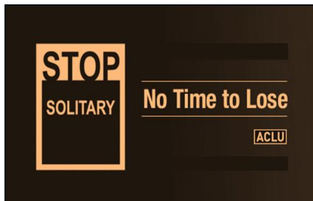
กระแสระเรียกร้องให้หยุดการขังเดี่ยวในต่างประเทศ

○ ให้ศาลมีคำพิพากษาและคำสั่ง “.....กำชับจำเลยและพวก ดูแลรักษา นักโทษ การประกันคุณภาพการรักษานักโทษ ให้ถูกต้องตามกฎหมายและบทบัญญัติแห่งรัฐธรรมนูญ ของสหรัฐอเมริกา รวมตลอดถึงข้อห้ามของการคุมขังโดยเฉพาะการขังเดี่ยว ที่มีความเสี่ยงที่จะเป็นอันตราย ต่อร่างกายและจิตใจอย่างรุนแรง ให้จัดหาอาหารที่จำเป็นและมีคุณค่าทางโภชนาการ จัดให้มีการออกกำลังกายกลางแจ้งเป็นประจำเพื่อรักษาสุขภาพร่างกายและจิตใจของนักโทษ เป็นต้น”