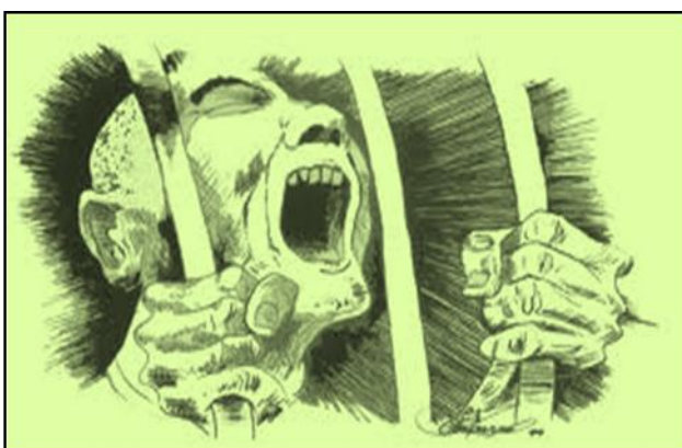
ขังเดี่ยว