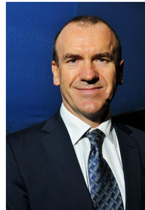
Sir Terry Leahy

“ความหวาดระแวงเหล่านั้น จะเป็นแรงผลักดันให้เราตั้งมั่นในการทุ่มเทและพยายามอย่างหนักในการสร้างบริการที่ดีขึ้นให้กับลูกค้า”