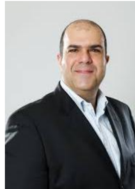
Sir Stelios Haji-Ioannou

3. เมื่อท้องทะเลสงบ ใครก็ควบคุมเรือได้ ( Anyone can hold the helm when the sea is calm )