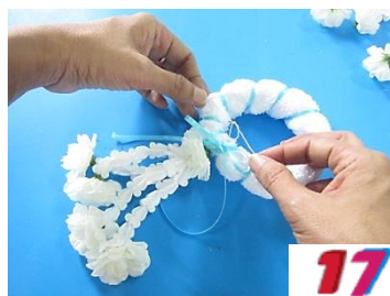
17. ร้อยด้ายขึ้นให้ดอกมะลิชนขด ผ้ามัดด้ายให้แน่นแล้วตัด