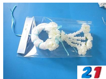
21. จัดใส่ถุงพลาสติกติดสติ๊กเกอร์ รักแม่หรือข้อความวันแม่ จำหน่ายในราคา 30-50 บาท ขึ้นอยู่กับผ้าที่ใช้และราคาวัสดุ อุปกรณ์