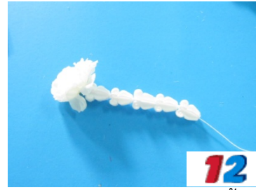
12. ร้อยดอกรัก 5 ดอกเป็นตุ้ตึ่ง