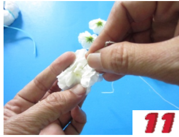
11. ร้อยดอกมะลิโดยแทงเข็มผ่าน กลีบดอกมะลิด้านใน