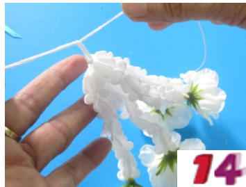
14. รวบตุ้ตึ่งเข้ามัดด้ายให้แน่น