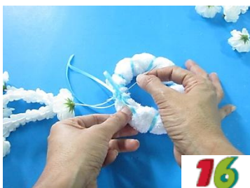
16. ร้อยเข็มทะลุขึ้นด้านในขดผ้า หลังโบว์