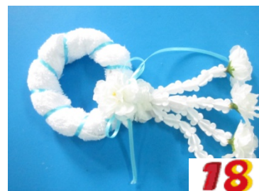
18. ติดดอกมะลิตรงกึ่งกลางโบว์