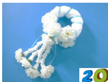
20. พลิกกลับติดดอกมะลิอีก 3 ดอกตำแหน่งตรงกัน ได้มาลัย ผ้ามะลิวันแม่ที่สวยงาม