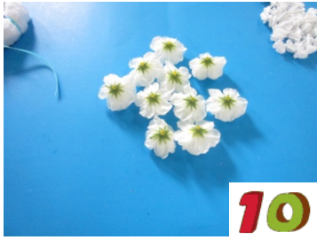
10. ตัดก้านดอกมะลิ 11 ดอก