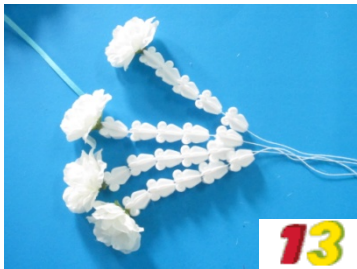
13. ร้อยตุ้ตึ่ง 4 สาย