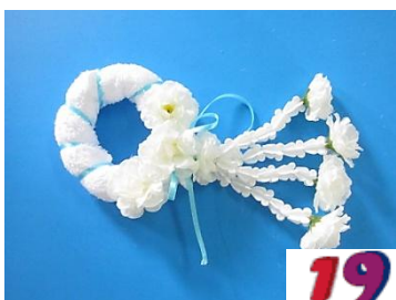
19. ติดดอกมะลิด้านข้างดอกแรก ข้างละ 1 ดอก