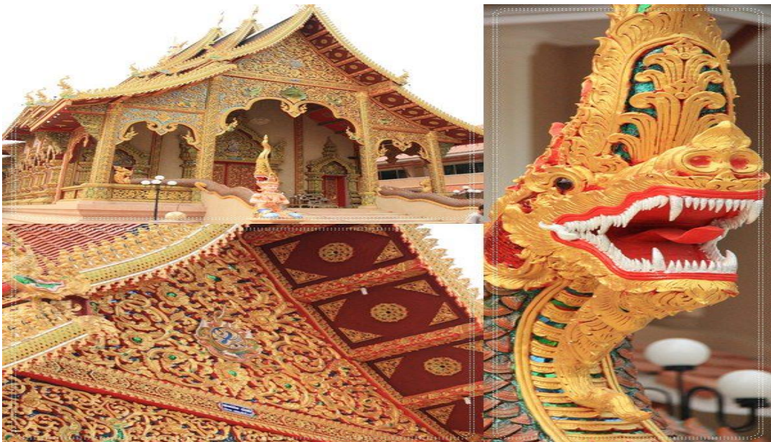
ภาพที่ 21 วัดศรีบุญเรือง