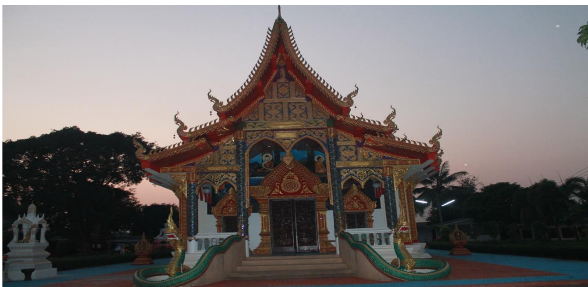
ภาพที่ 35 วัดสักวัน