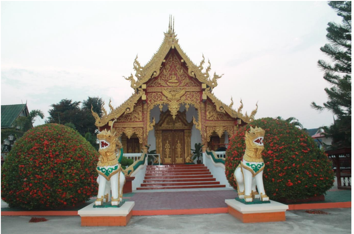
ภาพที่ 32 วัดคีรีชัย