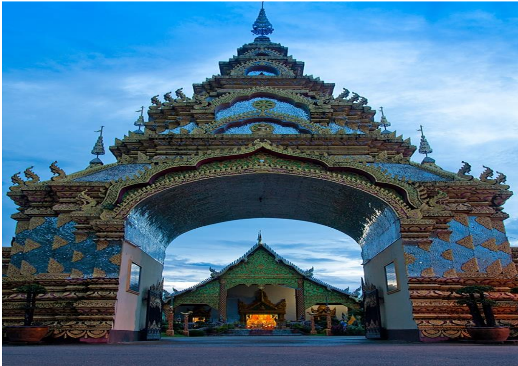
ภาพที่ 12 วัดเชตุพน