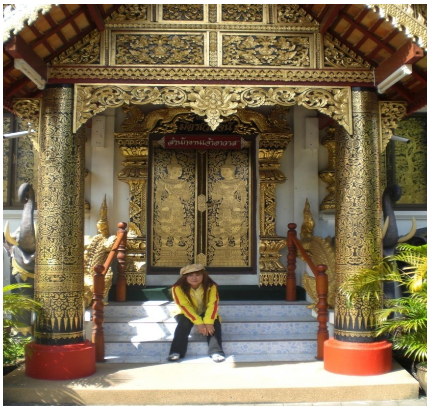
ภาพที่ 27 วัดกลางเวียง