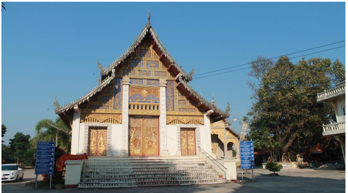
ภาพที่ 15 วัดเชตวัน(วัดพระนอน)