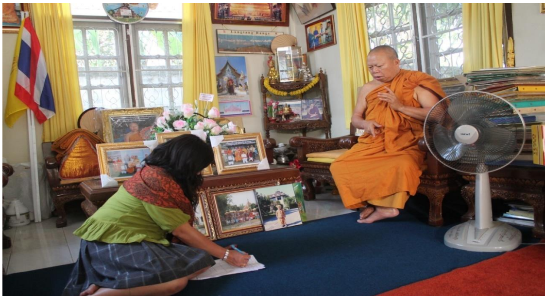
ภาพที่ 23 สัมภาษณ์พระครูบัณฑิตวนคุณ เจ้าอาวาสวัดสันป่าก่อ