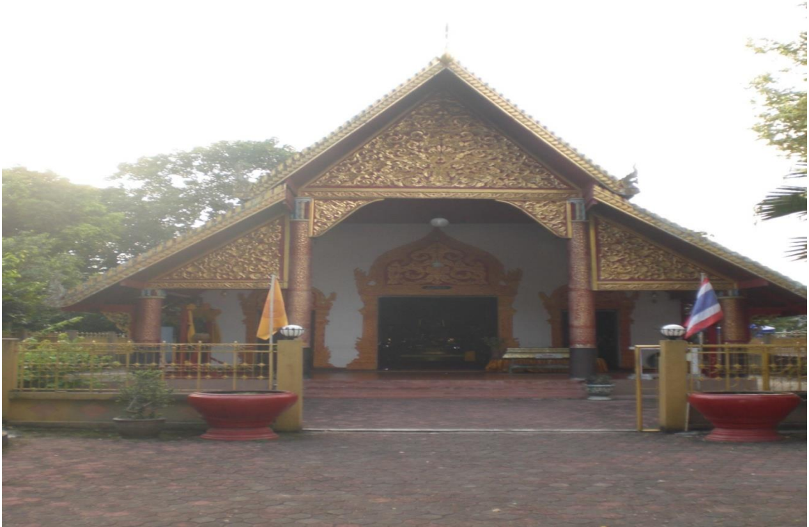
ภาพที่ 29 วัดพระธาตุคอกยทอง