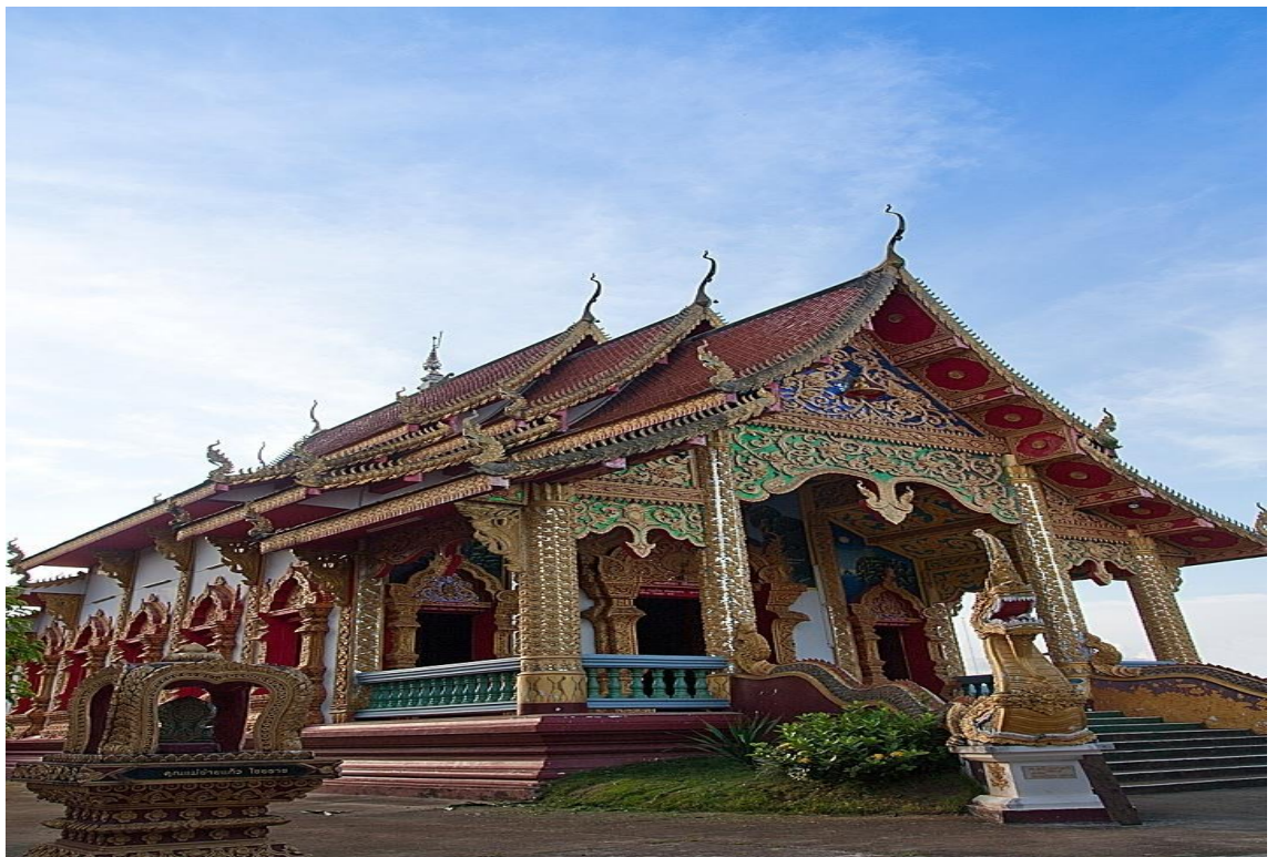
ภาพที่ 25 วัดใหม่หน้าค่าย