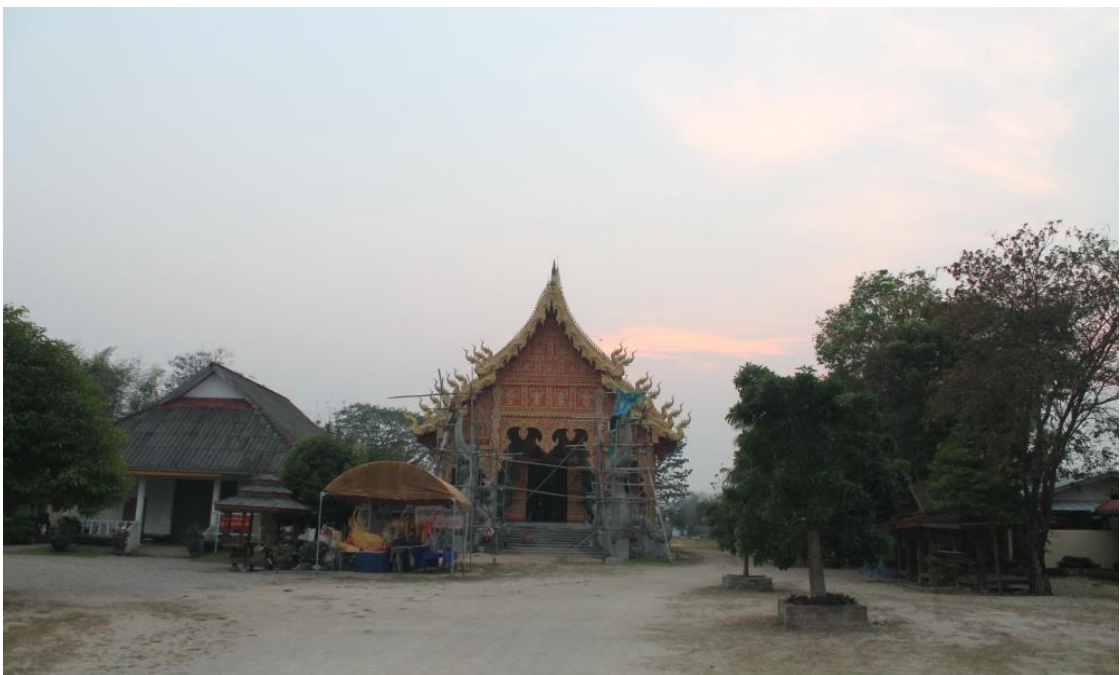
ภาพที่ 37 สำนักสงฆ์ร่องเสือเต้น