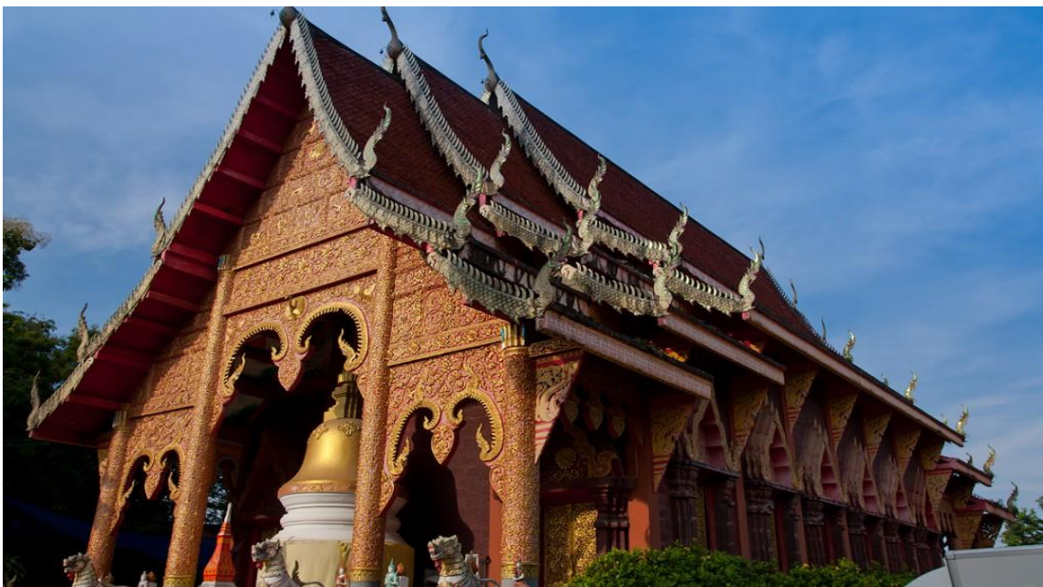
ภาพที่ 17 วัดเชิงยี่น