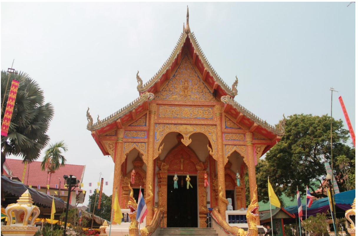
ภาพที่ 19 วัดศรีมิ่งแก้ว