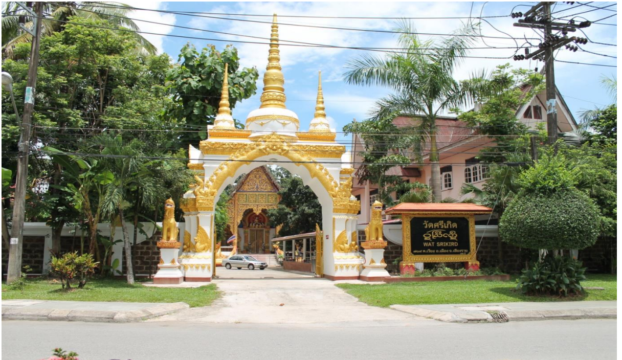
ภาพที่ 10 วัดศรีเกิด