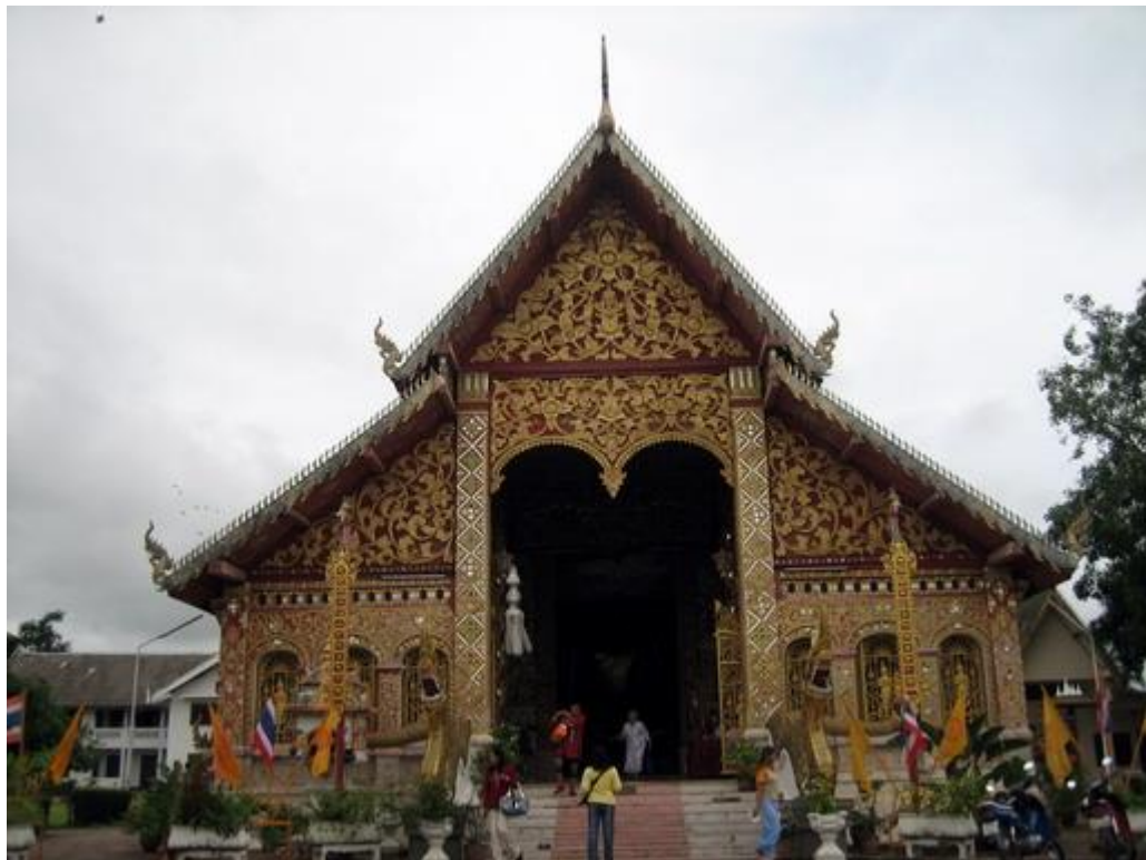
ภาพที่ 5 วัดเจ็ดยอด