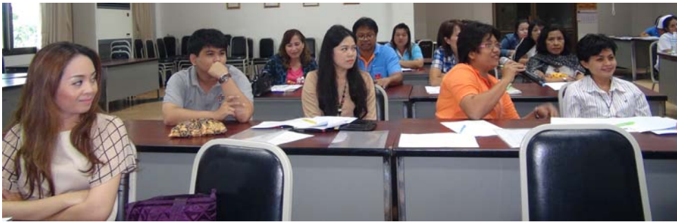
งานเปิดบ้านฯ ครั้งที่ 1 ปี 2557 : 24 มกราคม 2557