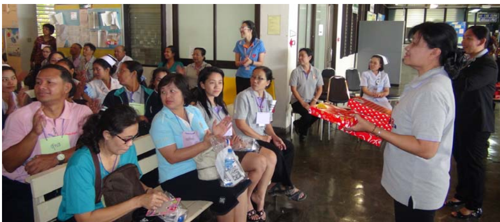
มอบรางวัลกลับคืนสู่ผู้ป่วย