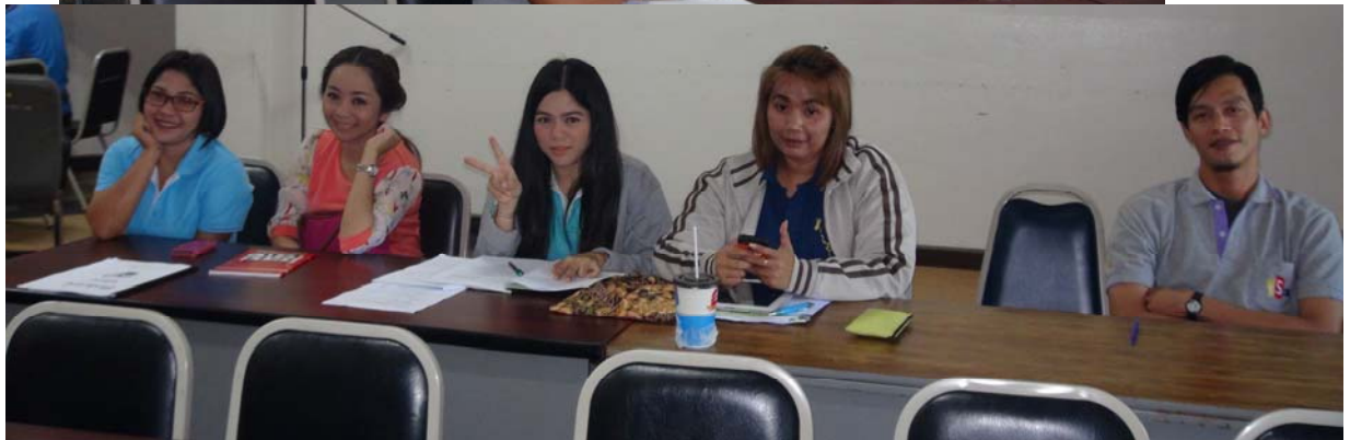
สาว สาว สาว และหนุ่ม หนุ่ม หน้าใหม่ ไฟแรง