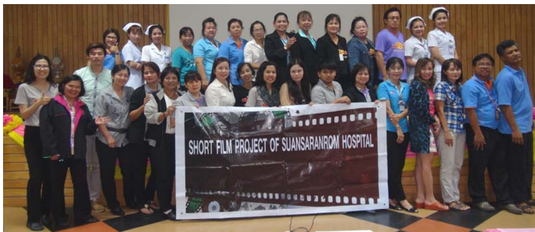
อบรมหนังสือ / สารคดี : 10 มกราคม 2557