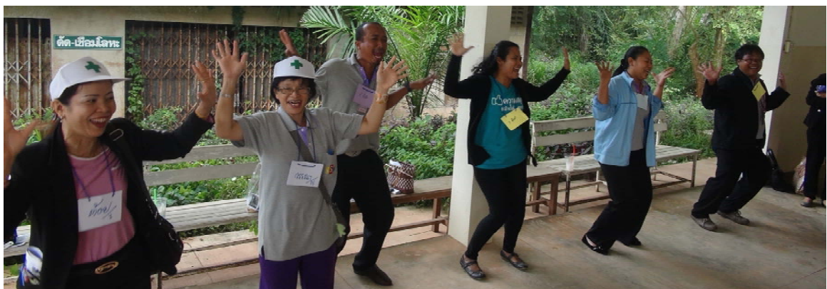
สนุกสนานกับการออกเสียงสระต่าง ๆ เพื่อเป็นการผ่อนคลายความเครียด