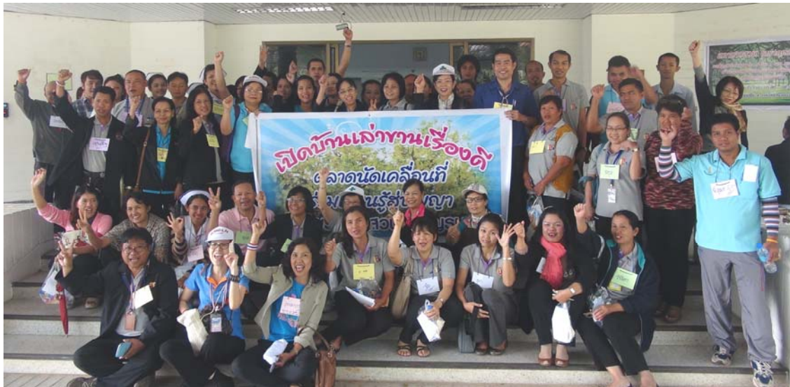
เข้าบ้าน ชาย 12 : ดุลยภาพแห่งชีวิต Balance in Quality Life