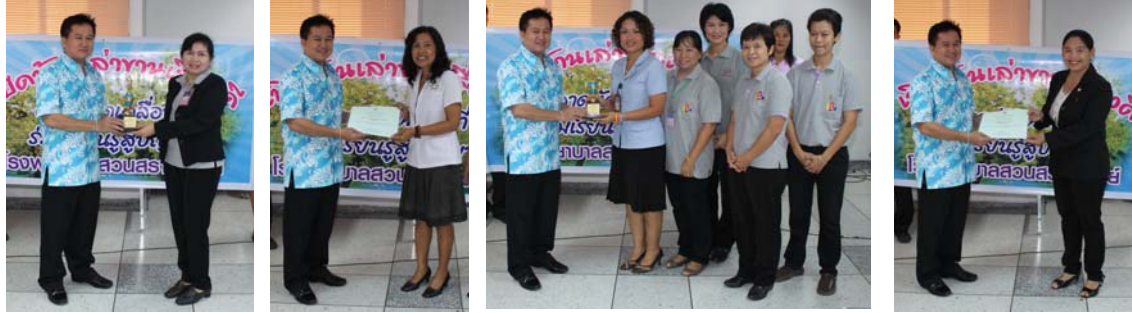
ผู้ที่รับรางวัลจากการประกวดประเภทต่าง ๆ มีดังต่อไปนี้