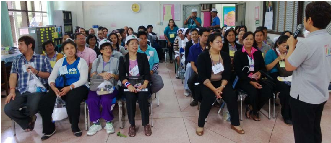
เตรียมความพร้อม ก่อนชมการแสดงละคร