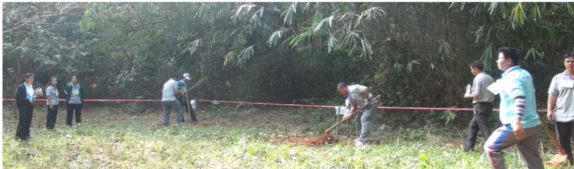
ฐานการอนุรักษ์ป่า และสิ่งแวดล้อม