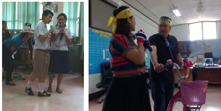
เปรียบเทียบการใช้ชีวิตของ พี่เทพ กับน้องปู และน้องแตงโม กับพี่ไต้ฝุ่น