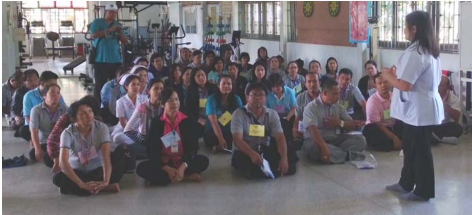
แนะนำบริการ ของคลินิกแพทย์แผนไทย ฤาษีตัดตน และประโยชน์