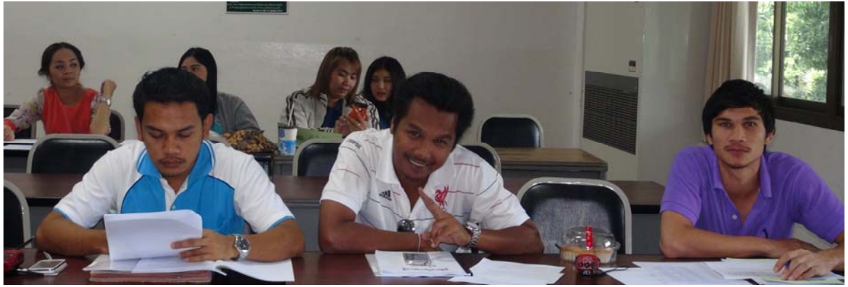
งานอบรม LO สำหรับบุคลากรใหม่ : 24 ธันวาคม 2556