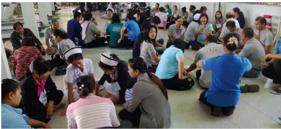
แต่ละทีมศึกษาทำฤาษีตัดตน