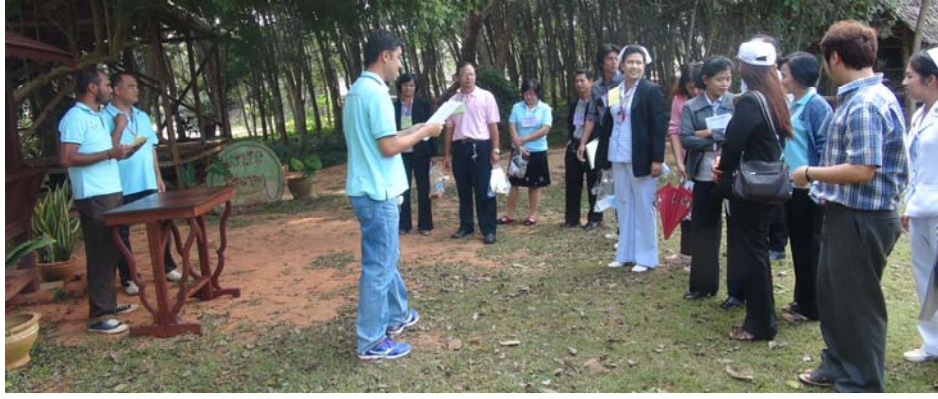
ฐาน การปรับสู่สภาวะสมดุลแห่งชีวิต : ตอบคำถามสุขภาพ