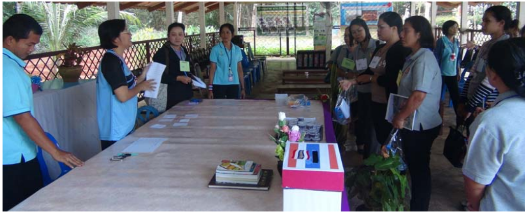
ฐานการทำงานใจสามานไพร