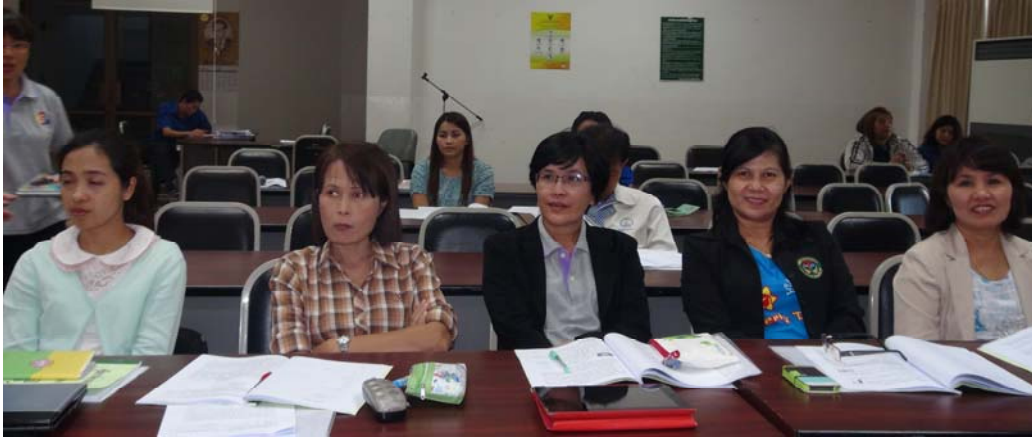
KM Man รุ่น 6