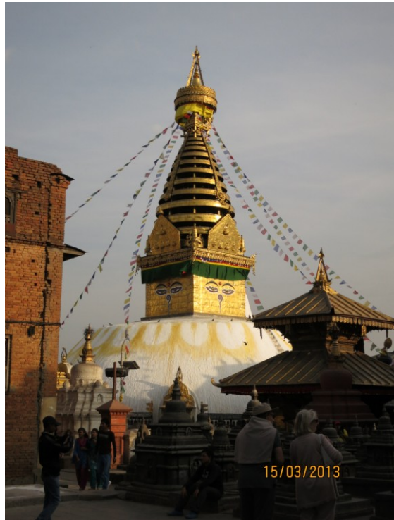
วันนี้เที่ยวอีก 2 แห่งแต่จำชื่อไม่ได้แล้ว ลงรูปให้ดูเล่นไปก่อน