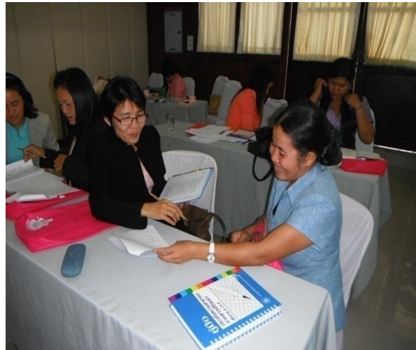
อบรมการพัฒนา I.Q. สำหรับเด็ก โดยกรมสุขภาพจิต