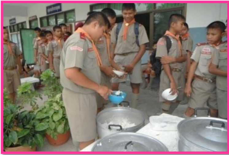
รูปภาพประกอบกิจกรรมข้าวกันบาตร สถานสายใยรักจากบ้านสู่โรงเรียน