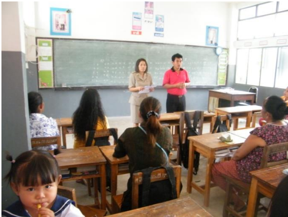
๒๕๕๕ กิจกรรมประชุมผู้ปกครองชั้นเรียน