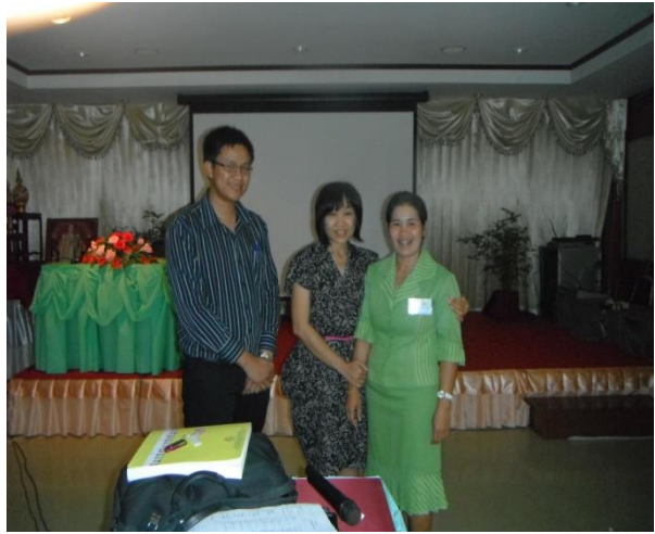
อบรม Master Teacher แนะนำ โดยมหาวิทยาลัยราชภัฏสุรินทร์