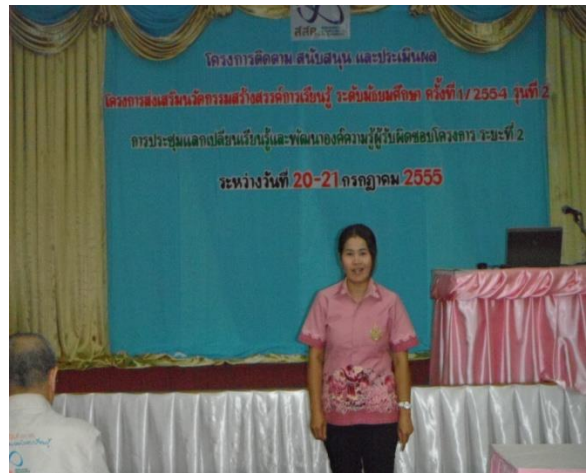
ประชุมแลกเปลี่ยนเรียนรู้และพัฒนาครูผู้รับผิดชอบโครงการสร้างสรรค์นวัตกรรมแห่งการเรียนรู้ ได้รับการสนับสนุนโครงการจาก สสค.