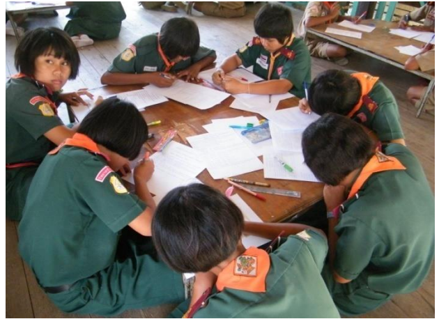
ภาพ : กัญระญา ยืนยิ่ง ๒๕๕๕ การจัดกิจกรรมแนะแนว โดยใช้กระบวนการกลุ่ม