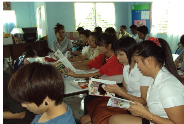
อ่านกันวันละนิด ชีวิตก็เปลี่ยนแปลง

ผู้ร่วมกิจกรรมชวนกันอ่านหนังสือเริ่มต้นวันนี้และเดี๋ยวนี้