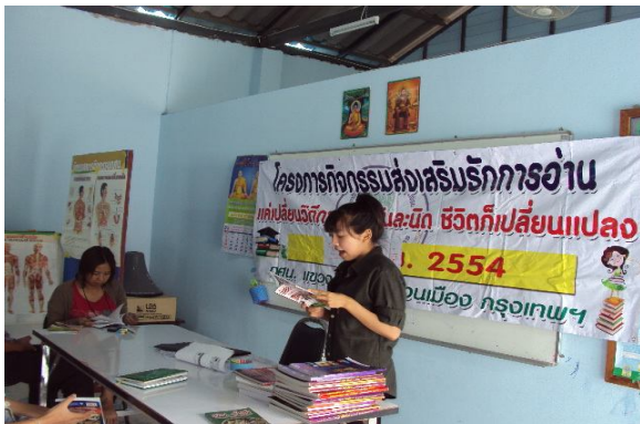
ขออ่านออกเสียงที่ถูกต้องให้เพื่อน ๆ ฟัง

ผู้ร่วมกิจกรรมชวนกันอ่านหนังสือเริ่มต้นวันนี้และเดี๋ยวนี้