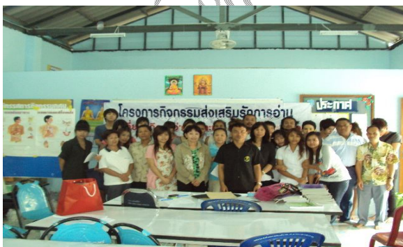
ผู้ร่วมงานถ่ายภาพร่วมกัน