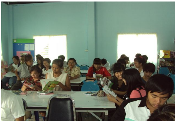
มหกรรมการอ่านวาระแห่งชาติ วาระของชีวิต