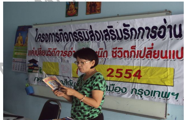
นักศึกษารุ่นใหญ่ก็ไม่ยอมน้อยหน้า