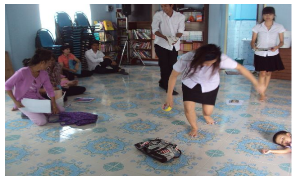
กิจกรรมกลุ่มสัมพันธ์