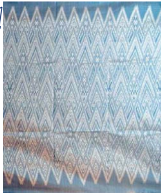
ผ้าลายประตูไม้แกะสลัก