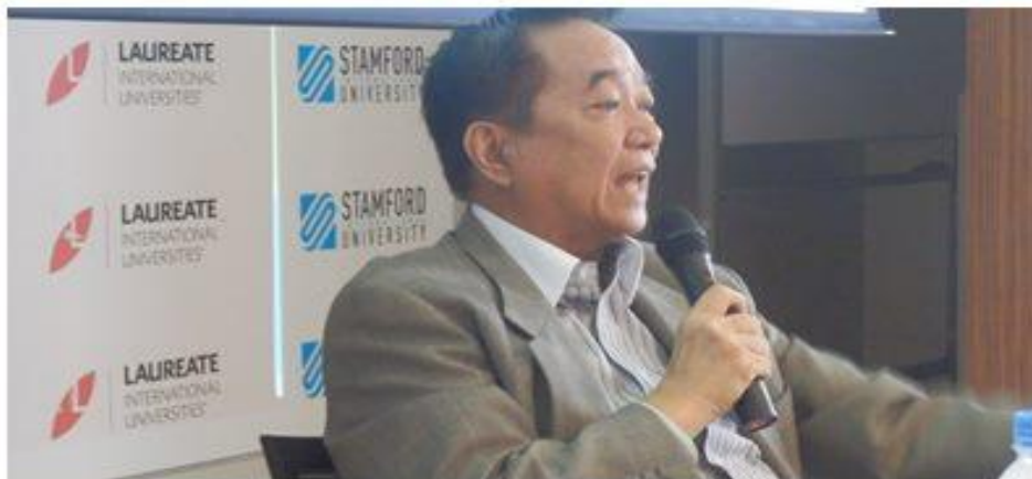
20 กุมภาพันธ์ 2556 สโมสรไลออนส์กรุงเทพ รัตนชาติ และมูลนิธิพัฒนาทรัพยากรมนุษย์ระหว่างประเทศ ร่วมกันจัด โครงการเผยแพร่ความรู้เรื่องประชาคม เศรษฐกิจอาเซียน (AEC) ครั้งที่ 8 ณ โรงเรียนบ้านนา “นายกพิทยากร” จ.นครนายก