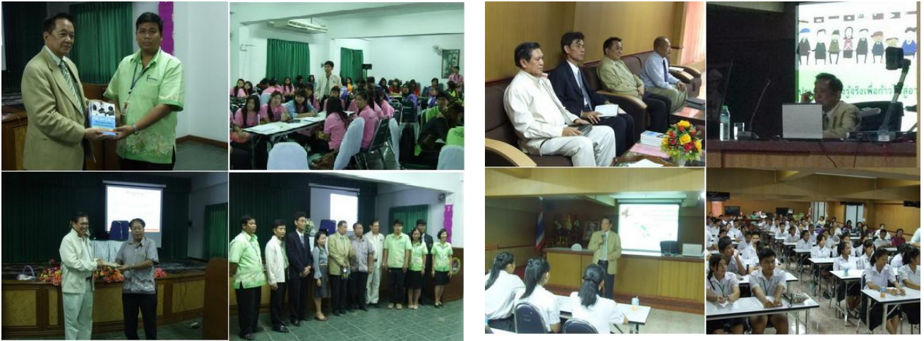
20 กุมภาพันธ์ 2556 สโมสรไลออนส์กรุงเทพ รัตนชาติและมูลนิธิพัฒนาทรัพยากรมนุษย์ระหว่างประเทศ ร่วมกันจัด โครงการเผยแพร่ความรู้เรื่องประชาคมเศรษฐกิจ อาเซียน (AEC) ครั้งที่ 7 ณ วิทยาลัยเทคโนโลยีวิวัฒน์ จ.นครนายก