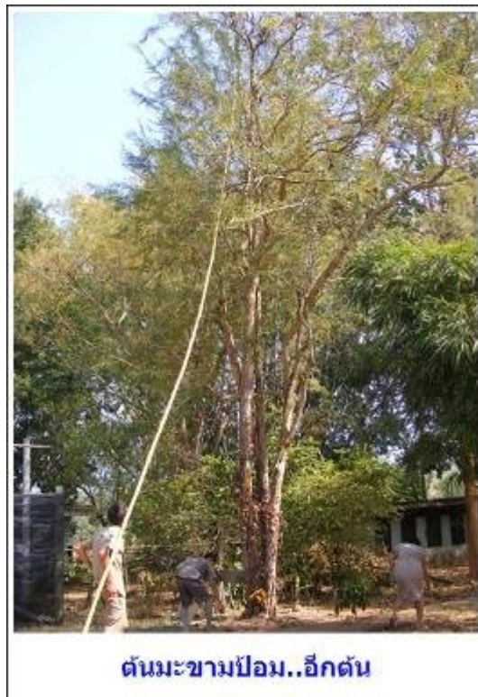
ต้นมะขามป้อม..อีกต้น

บังเอิญมีผู้ปกครองนักเรียนที่ฉันสอนเขา และจบไปหลายปีแล้วมาทำธุระที่วัดนั้น เขาได้แนะนำฉันว่ายังมี ต้นมะขามป้อมอยู่อีกต้นหนึ่งอยู่ด้านหลังกุฏิ พวกเรารู้สึกดีใจมาก ฉันมองขึ้นไปเห็นมีลูกมะขามป้อมยังพอมีอยู่ ทำให้มีความหวังมากขึ้น