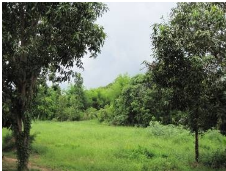
บรรยากาศด้านหลังโรงเรียน

นอกจากนี้ยายบอกได้ความจริงกับฉันว่า หลานคือจิ้งตีบ่อยๆ ตีเท่าไรก็ไม่หลาบจำ ตีจนไม้แขวนผ้าหิ้งงอก็ไม่จำ ฉันได้โอกาสชวนยายมาเข้าค่าย Humanized Educare กับนักเรียนในวันพรุ่งนี้ด้วย ยายตอบตกลงด้วยหน้าตาสดชื่น ตั้งแต่พบเหตุการณ์มาจนขณะนี้ เขียนบันทึกจบฉันยังรู้สึก“สะเทือนใจ”อยู่ไม่หาย