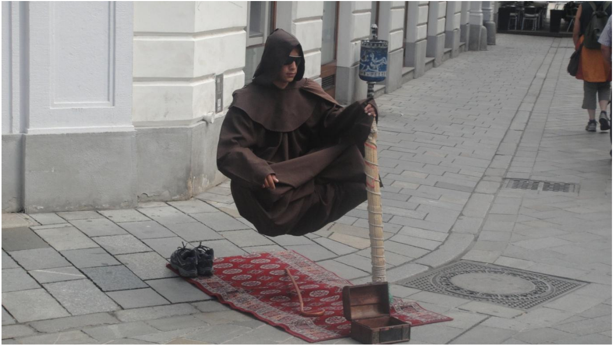
คนลอยได้ ศิลปะการแสดง