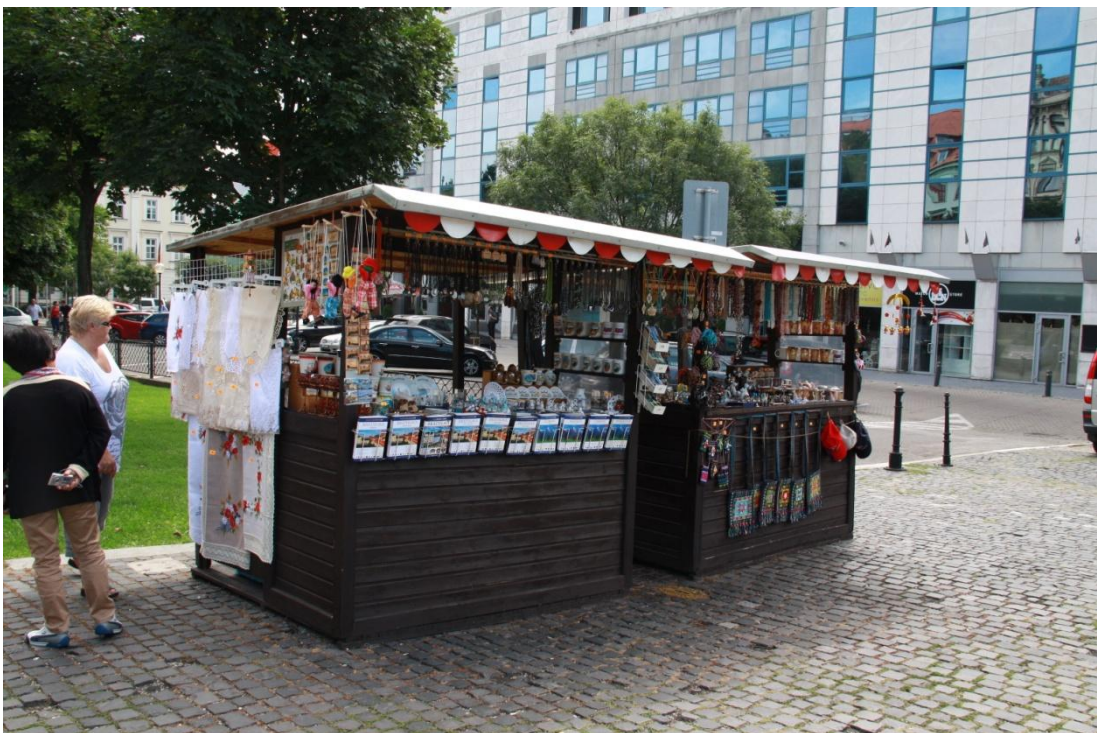
ร้านขายของที่ระลึก เป็นงานฝีมือ ประดิษฐ์ เช่นผ้าปัก ของที่ระลึก