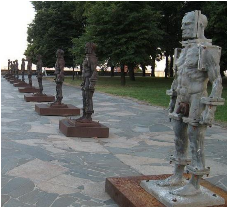
ต้องตลิ่งกว่า..!! รูปปั้นหุ่นยนต์ ที่ปราสาท บราติสลาวา