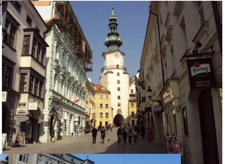
St. Michael's Gate ประตูเมืองเก่า ที่ยังเหลืออยู่แห่งเดียว