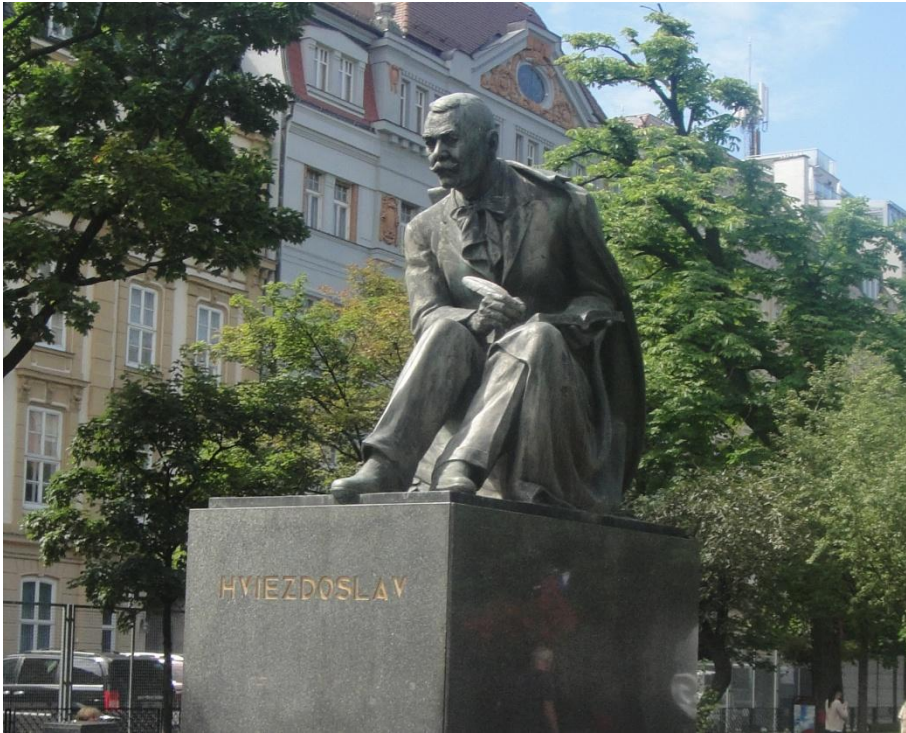
รูปปั้นนักเขียน ผู้มีบทบาทสำคัญของจัตุรัส ที่มาของชื่อ Hviezdoslav Square