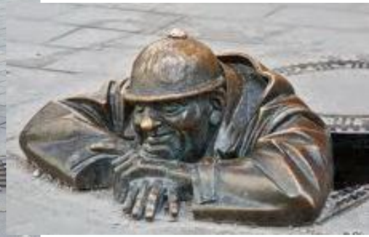
รูปปั้น ชื่อ คูมิน (Cumil) คนงาน กำลังมองอะไรสักอย่าง อย่างมีความสุข

คนจริง โชคดีถึงจะเห็น เพราะไม่ได้มาทุกวัน