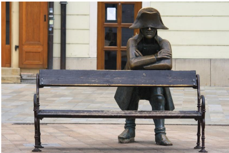
ทหารนโปเลียน หลังเก้าอี้ยาว

Schone Naci รูป ปั้นคนเปิดหมวก ที่มี ชีวิตอยู่จริงศตวรรษที่ 20 เขาเป็นคนยากจน แต่ แต่งตัวดี อารมณ์ดี เดิน ย่ำไปมาแถวจัตุรัสเมือง เก่า ทักทายคนที่เดินผ่าน