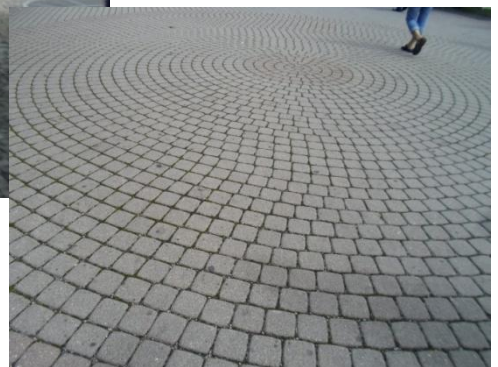
ภาพเคลื่อนไหว ชมเมือง ii