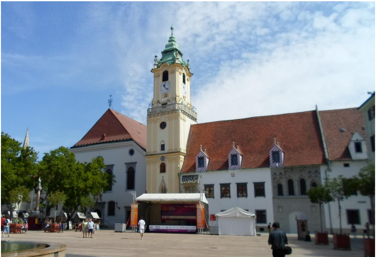
ซ้ายมือ โบสถ์ Jesuit (The Holy Saviour Church) ตรงกลางหอคอยเก่าของเมือง (St. Michael's Tower) เคยใช้สังเกตการณ์ป้องกันเมือง