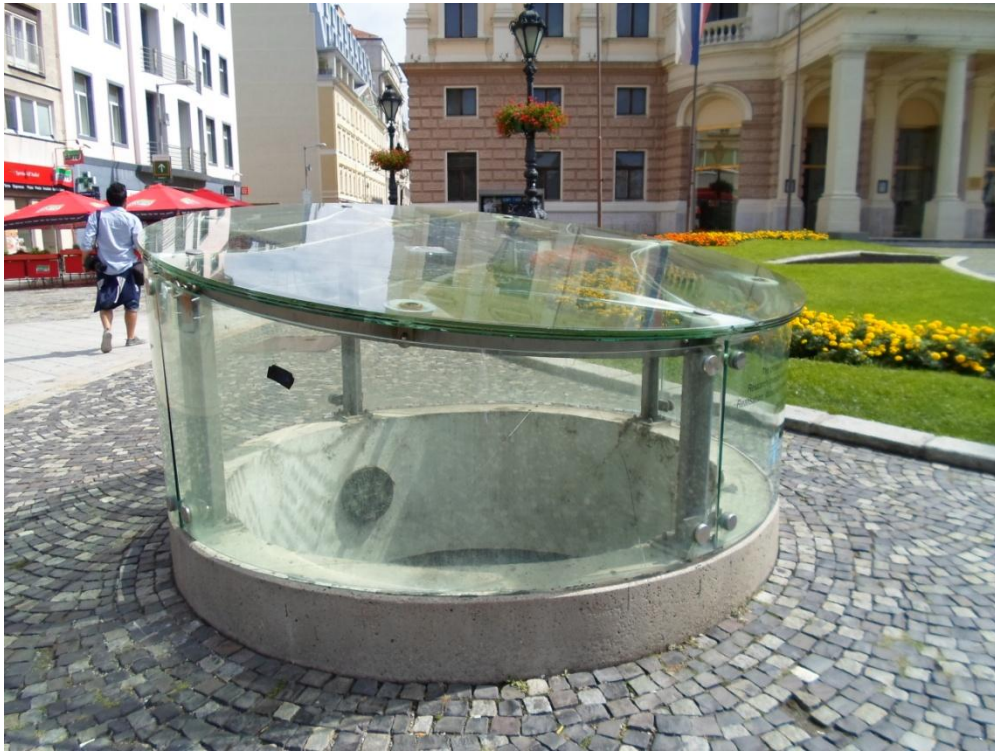
ทางลงไปสู่อุโมงค์ชาวประมง สิ่งก่อสร้างเดิม หน้าโรงละครแห่งชาติ

สะพานรูปทรงงานบิน โนวี่โมสต์ Nový Most เป็นสะพานข้ามแม่น้ำดานูบ (ในภาษาสโลวาเกีย Nový Most แปลว่า สะพานใหม่ หรือ New Bridge) ก่อสร้างในระหว่างปีค.ศ. 1967-1972 และเปิดใช้อย่างเป็นทางการเมื่อวันที่ 26 สิงหาคม ค.ศ. 1972 ความยาวรวม 430.8 เมตร ความกว้าง 21.0 เมตร ความสูง 84.60 เมตร เป็นสะพานที่สองที่ข้ามแม่น้ำดานูบของเมืองบราติสลาวา มีทางสำหรับรถวิ่ง 4 ช่องทางอยู่ชั้นบน มีทางสำหรับรถจักรยานและคนเดินอยู่ชั้นล่าง