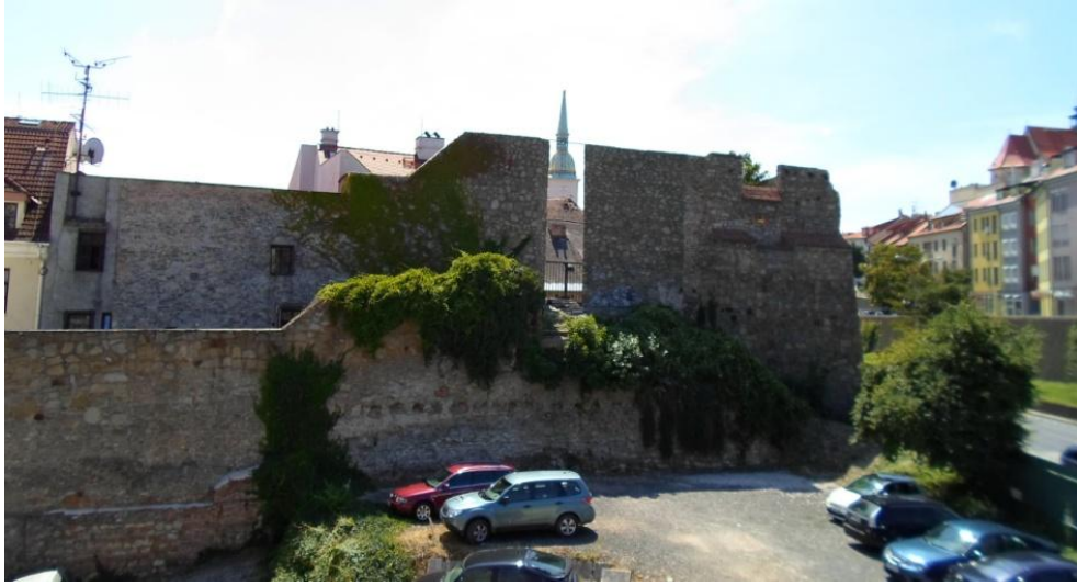
กำแพงเมืองเก่า ยังรักษาไว้