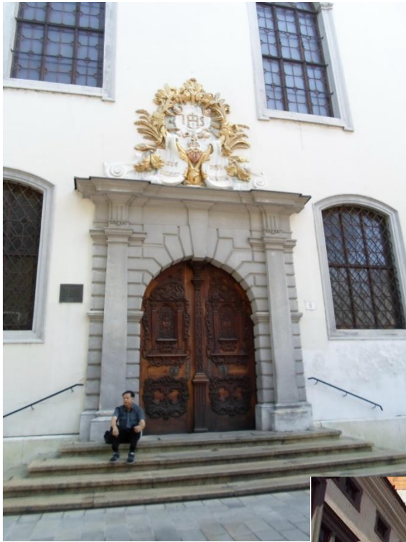
ประตูโบสถ์ Jesuit สไตล์เรเนสซ็องส์ สร้าง ระหว่าง ค.ศ. 1636-1638 โดยรัฐบาลเยอรมัน ที่มาปกครอง ภายในตกแต่งสไตล์ร็อกโกโก ภาพเขียน ของศิลปิน