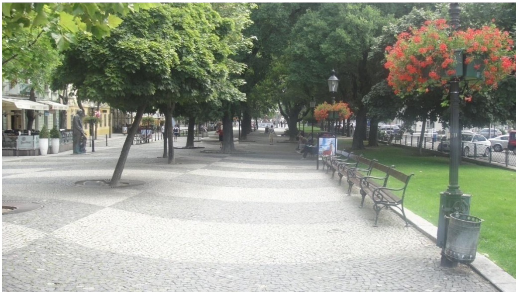
ถนนทางเข้าจัตุรัสเมืองเก่า ถนนปูด้วยหิน ปลุกต้นไม้ ดอกไม้ เป็นสวนสาธารณะ

จัตุรัส Hviezdoslav อันเป็นที่ตั้งของโรงละครแห่งชาติ ถนนกว้าง มีสวนสาธารณะ 2 ข้างทางประดับด้วยรูปปั้น ผลงานศิลปะ จากคนธรรมดาที่มีชื่อเสียง ควรระลึกถึง