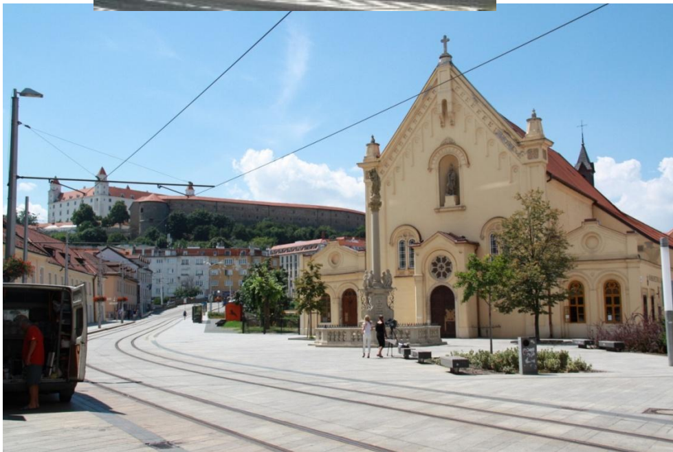
โบสถ์ที่ย่านเมืองเก่า