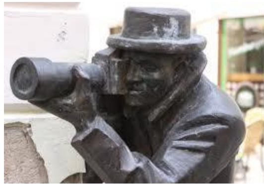
รูปปั้นปาปรัสซี ชุมถ่ายรูปข้างตึก

ฝาดปิดท่อน้ำ ที่ถนน (ลวดลายเหลือเชื่อ บางแห่งมี ป้ายบอกทางไปเมืองต่างๆ )