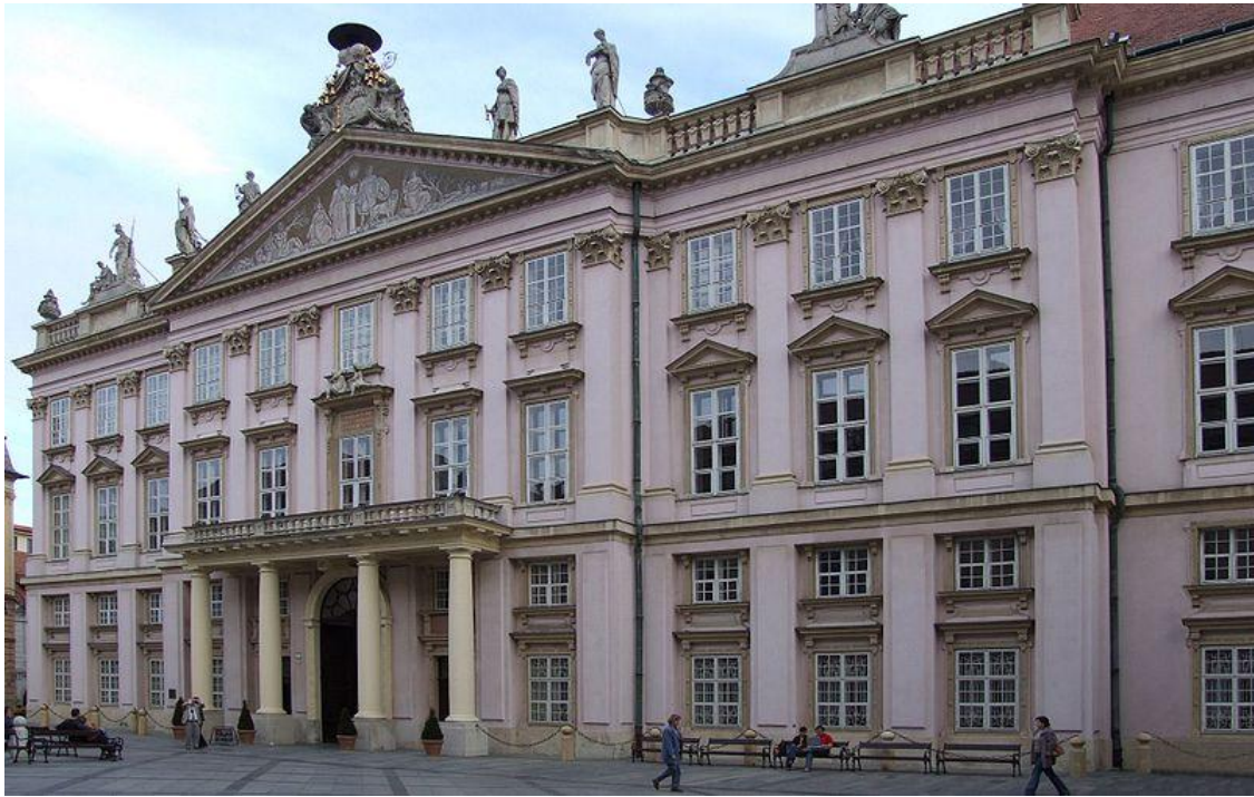
Primate's Palace ตึกสีชมพู วังที่ประทับของอาร์คบิชอป ปัจจุบันเป็นศาลาว่าการเทศบาล