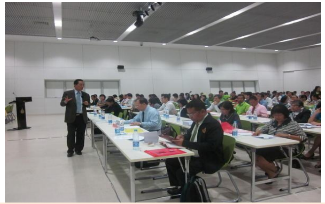
12 กันยายน 2555 ศ.ดร.จีระ หงส์ลดารมภ์ ได้รับเกียรติจากมหาวิทยาลัยสงขลานครินทร์ บรรยายหัวข้อ มหาวิทยาลัยสงขลานครินทร์กับการเป็น Education Hub ของอาเซียน ณ ห้องประชุม BSC 3 อาคารคณะวิทยาศาสตร์ มหาวิทยาลัยสงขลานครินทร์