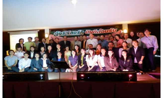
11 - 14 กันยายน 2555 ภาพบรรยากาศปิดโครงการพัฒนาสมรรถนะข้าราชการกรมพัฒนาที่ดินระดับชำนาญการ รุ่นที่ 2 ได้รับเกียรติจาก ดร.อรุณ สมร่าง อดีตอธิบดีกรมพัฒนาที่ดิน ในการบรรยายในหัวข้อภาวะผู้นำในกรมพัฒนาที่ดิน และเปิดโอกาสให้ผู้เข้าฝึกอบรมได้แลกเปลี่ยนประสบการณ์ทำงาน