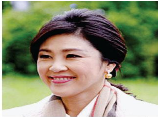
ยิ่งลักษณ์ ชินวัตร

ตัวอย่างคือ อดีตนายทักซิณ สุนทรเวช ซึ่งเป็นตัวของตัวเองและมีความมั่นใจสูงมาก หลังจากถูกศาลรัฐธรรมนูญปลดออกจากตำแหน่งนายทักซิณ คุณทักษิณก็ไม่สนับสนุนให้กลับมาเป็นนายทักซิณอีกทั้งๆ ที่มีสิทธิ์เป็นไปได้ โดยเลือกน้องเขยคุณสมชาย วงศ์สวัสดิ์ มาเป็นแทนคุณทักษิณ ซึ่งคุณทักษิณคงตรอมใจมาก ในที่สุดก็เสียชีวิตไปก่อนวัยอันควร สาเหตุเพราะคุณทักษิณคุมคุณทักษิณไม่ได้