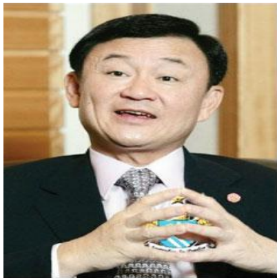
ทักษิณ ชินวัตร

วิธีการทำงานของอดีตนายทักซิณมองตัวเองเป็นหลัก ใครก็ตามที่ไม่ตามใจ ไม่ว่าจะญาติหรือคนอื่น คุณทักษิณอาจจะจัดการหรือกำจัดออกไปในที่สุด