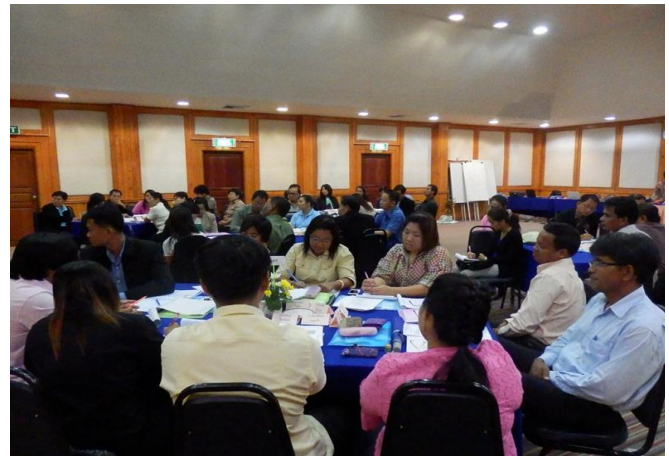
21-24 สิงหาคม 2555 ภาพบรรยายภาคโครงการพัฒนาสมรรถนะข้าราชการกรมพัฒนาที่ดินระดับชำนาญการ หลักสูตร การพัฒนาทุนทางความรู้ ทักษะ และทัศนคติ รุ่นที่ 1 สำหรับโครงการนี้แบ่งการเรียนรู้เป็น 2 ช่วงระหว่างวันที่ 21 สิงหาคม -7 กันยายน 2555