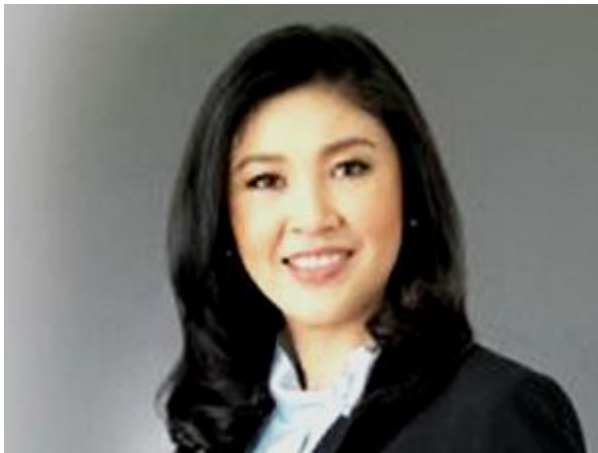
ยິงลักษณ ชินวัตร