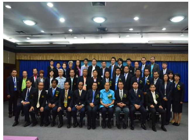
23-25 สิงหาคม 2555 โครงการพัฒนาผู้นำสหกรณ์ หลักสูตร ผู้นำสหกรณ์เครดิตยูเนียนขั้นสูงรุ่นที่ 2 ระหว่างวันที่ 23สิงหาคม - 24 พฤศจิกายน 2555 ณ ชุมนุมสหกรณ์เครดิตยูเนียนแห่งประเทศไทย จำกัด โดยได้รับเกียรติอย่างสูงจากท่าน ฯพณฯ อำพล เสนาณรงค์ องคมนตรี มาเป็นประธานในพิธีเปิดโครงการ