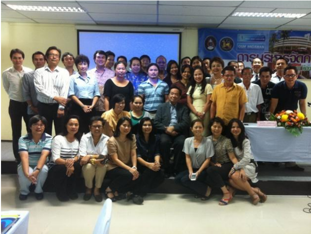
20 สิงหาคม 2555 ศ.ดร.จีระ หงส์ลดารมภ์ ได้รับเกียรติจาก มหาวิทยาลัยราชภัฏภูเก็ตให้มาแลกเปลี่ยนกับบุคลากร ผู้บริหารด้านการโรงแรมและการท่องเที่ยว ในการอบรมหลักสูตรการบริหารจัดการโรงแรมรุ่นที่ 1