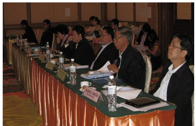
24 สิงหาคม 2555 ศ.ดร.จิระ หงส์ลดารมภ์ ได้รับเกียรติจากสำนักพัฒนาสมรรถนะครูและบุคลากรอาชีวศึกษาเชิญบรรยายให้แก่ผู้บริหารอาชีวศึกษาทั่วประเทศ ประมาณ 80 คน เรื่อง ผู้บริหารอาชีวศึกษาต้องรู้จักเรื่องอาเซียนเสรี ณ โรงแรมทาว์นอินทาว์น กรุงเทพฯ