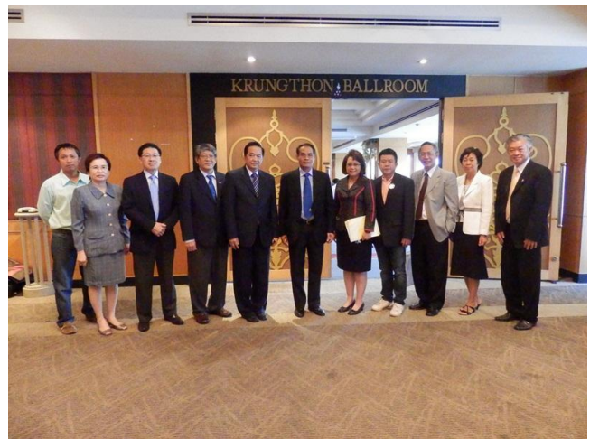
21 สิงหาคม 2555 การสัมมนาระดมความคิดเห็นเรื่อง “ศักยภาพของท่องเที่ยวและกีฬาไทยกับการสร้างพลังขับเคลื่อนประชาคมอาเซียน” ณ ห้องประชุมกรุงธนบอลรูม โรงแรมรอยัลริเวอร์ กรุงเทพฯ