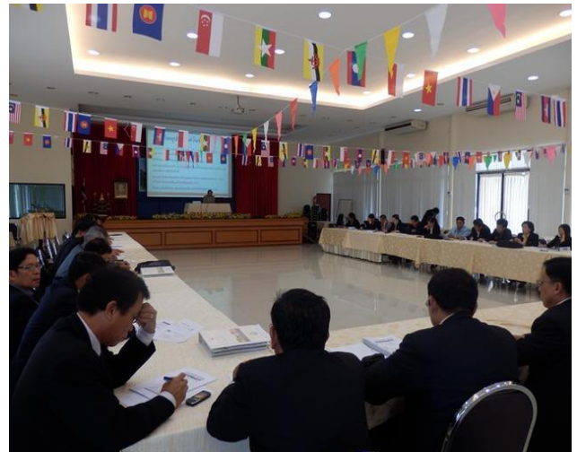
15 สิงหาคม 2555 ศ.ดร.จิระ หงส์ลดารมภ์ ได้รับเกียรติจาก สำนักงานปลัดกระทรวงการท่องเที่ยวและกีฬา ให้เป็นวิทยากร โครงการฝึกอบรม "Provincial Tourism Roadmap and Preparation to AEC" หัวข้อ "ประเด็นเกี่ยวกับ AEC ที่ผู้นำท้องถิ่นด้านการท่องเที่ยวต้องรู้ : Local Awareness" ณ บึงฉวาก รีสอร์ท จังหวัดสุพรรณบุรี