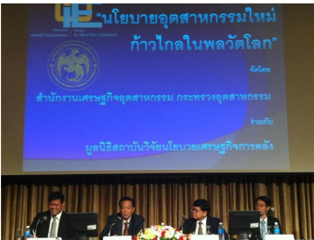
16 สิงหาคม 2555 ศ.ดร.จิระ หงส์ลดารมภ์ ได้รับเกียรติจาก กระทรวงอุตสาหกรรมและมูลนิธิสถาบันวิจัยนโยบายเศรษฐกิจการคลัง ในการเสวนาเรื่อง นโยบายพัฒนาอุตสาหกรรมของเกาหลีใต้ จีน และอินเดีย : นายต่อไทย” ณ ห้องอโนมา 1-2 โรงแรมอโนมา