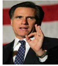
Romney ตัวเก่งของพรรครีพับลิกัน