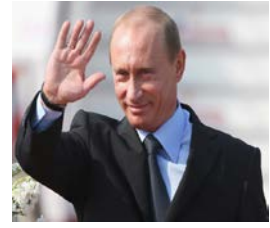
Putin จะสมัครชิงประธานาธิบดีในเดือนมีนาคม