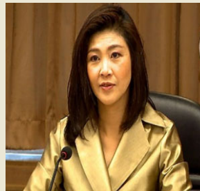
นายกฯ ยิ่งลักษณ์ ชินวัตร