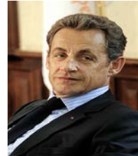
Sarkozy ลงสมัครต่อ