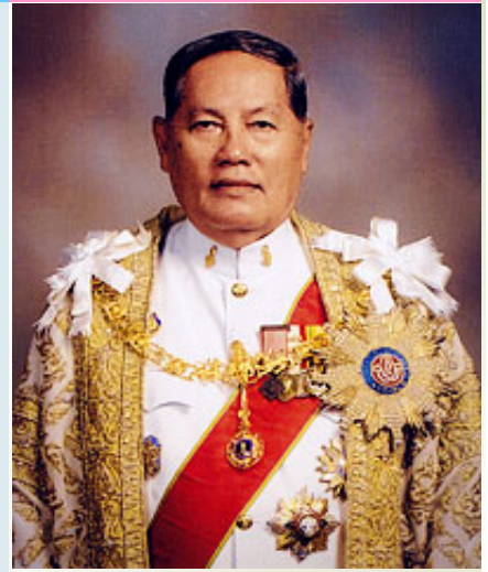
กราบขอบพระคุณ ฯพณฯ ดร. อ่ำพล เสนาณรงค์ องคมนตรี