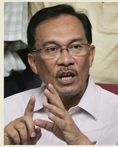
อันวาร์ อิบราฮิม

สุดท้าย ชาวดีคือใครว่าคุณธีระชัย ภูวนาถนารานูบาล รัฐมนตรีว่าการกระทรวงการคลัง เป็นหุ่น อย่างน้อยในเรื่องการโอนหนี้ไปธนาคารแห่งประเทศไทย ท่านก็แสดงจุดยืนได้ดี ที่จะให้ธนาคารฯ ชาติมีอิสระ สามารถค้านคุณวีรพงษ์ รามางกูร กับ คุณกิติรัตน์ ณ ระนอง ได้อย่างน่าชื่นชมครับ