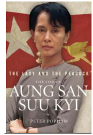
อองซาน ซูจี (Aung San)