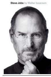
สตีฟ จอบส์ (Steve Jobs)