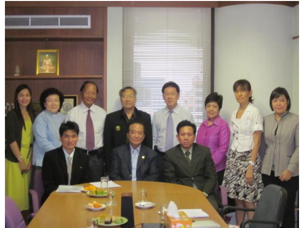
มูลนิธิพัฒนาทรัพยากรมนุษย์ระหว่างประเทศได้จัดการประชุมระดมสมองเพื่อหารือแนวทางการทำงานของสถาบันคุณวุฒิวิชาชีพ ได้รับเกียรติจากที่ปรึกษาผู้ช่วยรัฐมนตรีประจำสำนักนายกรัฐมนตรี 2 ท่าน คือ ดร.มัทวาทิ สุวรรณเรือง และคุณอากาศร เผือกสุวรรณ ร่วมประชุมและให้ข้อคิดเห็น (9 ธ.ค. 54)